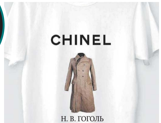
А вот так дизайнеры смеются над брендом Chanel

весёлых и уникальных принтов придумала команда Кирилла Караваева