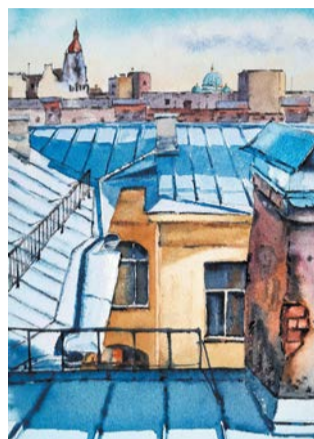
На конкурс прислали более 300 картин

– Обычно мы отправляем почтой порядка 30–40 писем с открытками каждую неделю, – рассказывает Яна. – Всего около 100–150 в месяц. Пока мы не стали проводить акцию, даже не догадывались, что так много людей во всём мире любят наш го-