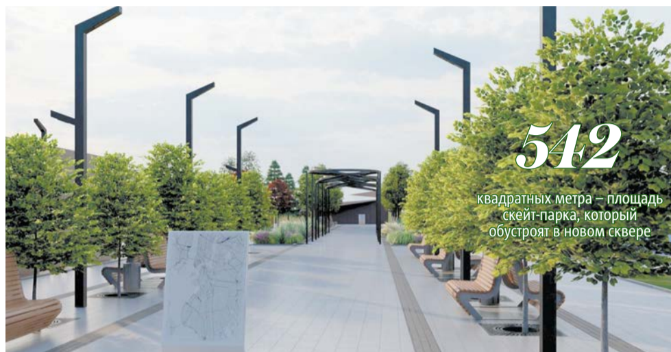
В новом сквере высадят деревья, кустарники и обустроят цветники с многолетними травянистыми растениями

– Проектом благоустройства предусмотрена установка