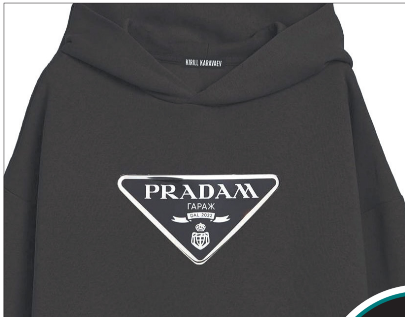
«PRADAM гараж» — один из самых новых принтов