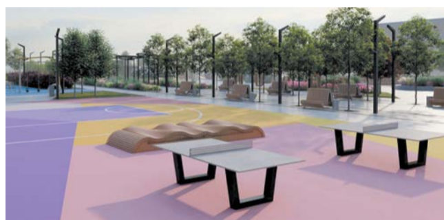
Фанаты настольного тенниса смогут устраивать в Молодёжном сквере турниры на свежем воздухе