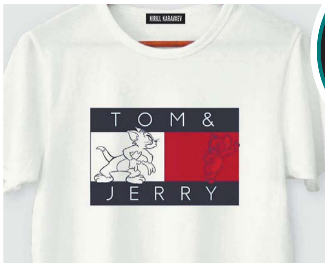
А это Tommy Hilfiger, который превратился в Tom & Jerry