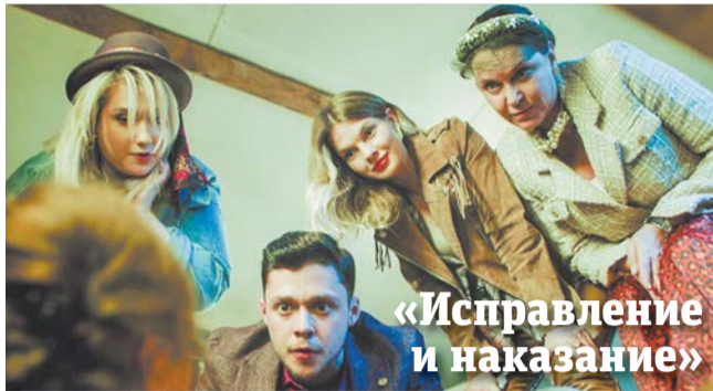
Члены семейства Верхоланцевых выпытывают у родственницы пароли от счетов умершего папши

Несмотря на довольно демократичные нравы, царящие в колонии-поселении, больше напоминающей пионерский лагерь, гоп-компания всячески со-