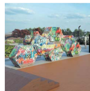
Стену для граффити оценят уличные художники

ка 167 единиц оборудования и малых архитектурных форм, – поясняют в пресс-службе района.