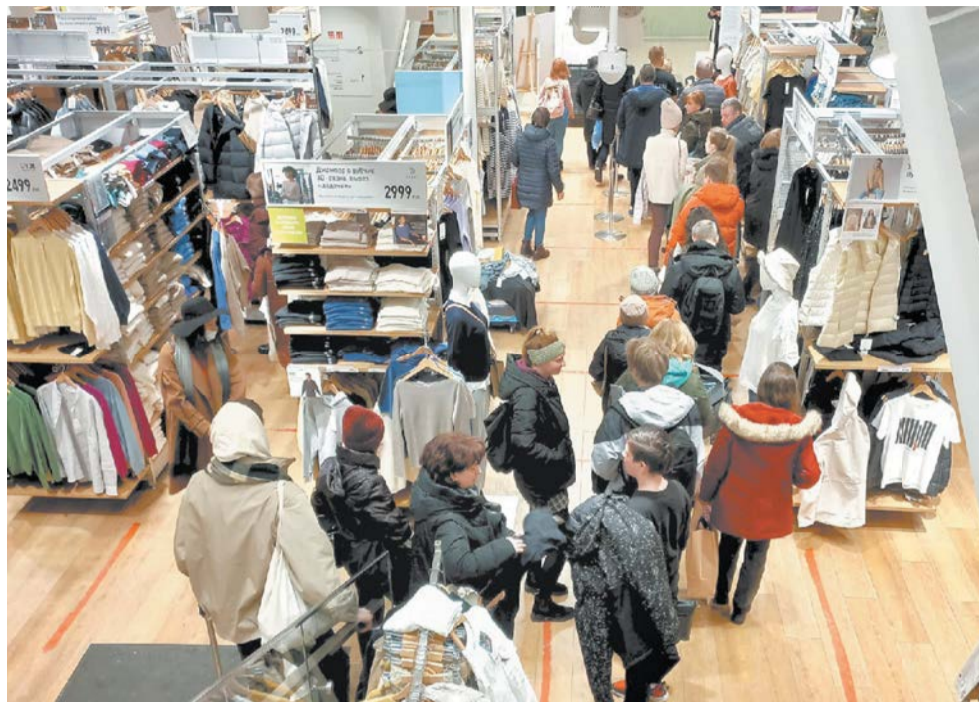
Магазины японского бренда появились в Петербурге семь лет назад | АЛЕНА БОБРОВИЧ

В Петербург пришла весна. Синоптики прогнозируют, что до конца этой недели столбик термометра будет подниматься до 6 градусов тепла, нас ожидает солнечная погода. У птиц в городских парках начался брачный период. Синицы, дятлы и воробьи ищут вторую половинку и скоро начнут обустроить семейные гнёзда. | АЛЕНА БОБРОВИЧ