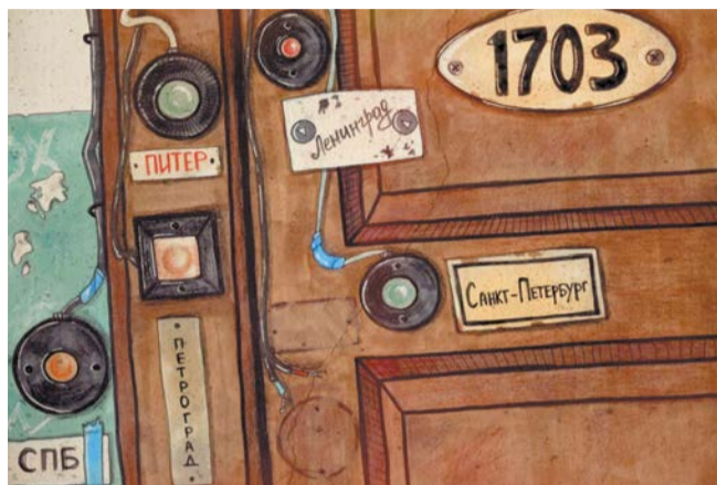
Такие открытки разлетаются во все концы нашей страны

и возраст участников конкурса. Самому младшему едва исполнился год, и рисовать ему помогали родители. Писали картины и люди средних лет, и пенсионеры, любители и профессионалы.