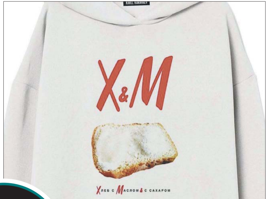
Пародия на ушедший от нас H&M — «хлеб с маслом и с сахаром»