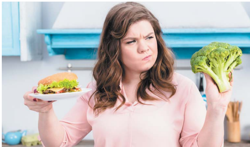
Даже если сели на диету, это не означает, что вы теперь питаетесь правильно

Неправильное питание влияет не только на фигуру. Такой рацион отражается на здоровье всего организма. Рассказываем, к чему может привести увлечение нездоровой едой