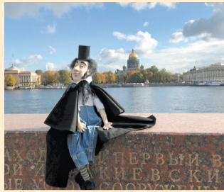
Войлочно-текстильный Пушкин