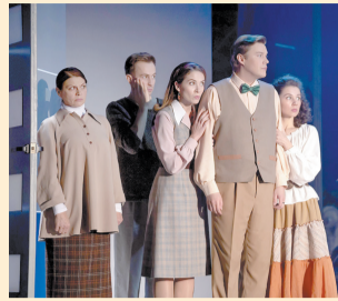
Спектакль «Странная миссис Сэвидж»

Эта постановка, насыщенная трогательной и противоречивой поэзией, прекрасной музыкой, о творчестве великого русского поэта создаёт непривычный образ гуляки и певца «берёзового ситца», где публика увидит Есенина бунтующего, ищущего утопическую страну Инонию, страдающего от своей безраздельной любви к родине, Есенина – подлинного новатора в искусстве. Где: музыкальный салон «АртСтандарт» Когда: 19 марта