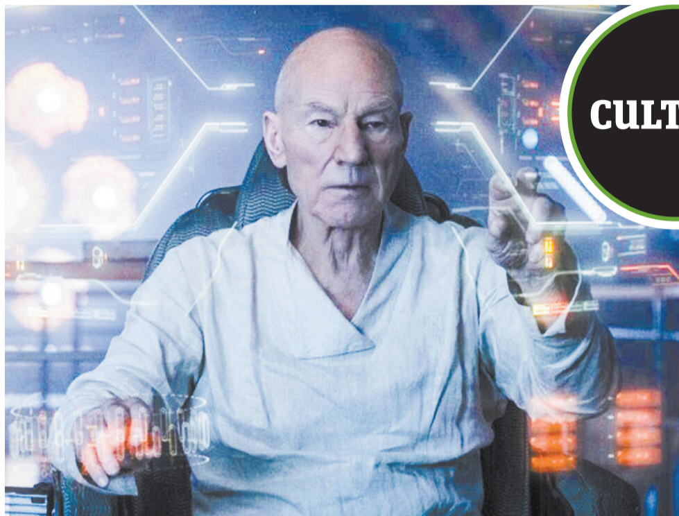
Патрик Стюарт продюсирует сериал и снимается в роли Жан-Люка Пикара спустя 20 лет

– Маргинализация общества, жестокосердие, чёрствость – это, на мой взгляд, общие проблемы, которые давно созрели для решения. «Звёздный путь» вносит свою лепту в лечение социальных болезней. Я не говорю, что мы превращаем «Пикар»