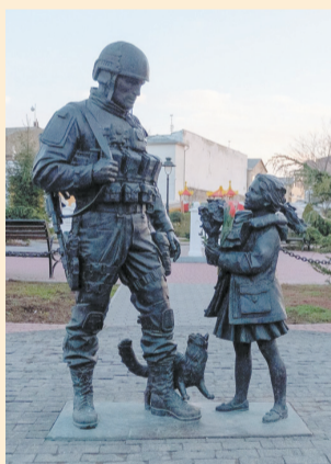
Симферополь. Памятник вежливым людям | АЛЕНА БОБРОВИЧ

вошли в состав России. Каждый год в этот день вся страна отмечает «Крымскую весну». METRO