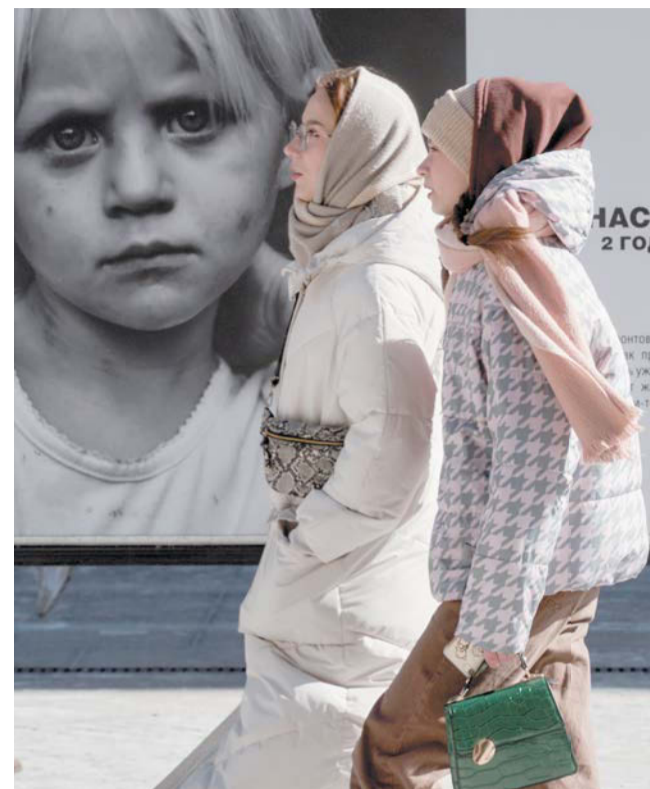
На Большой Морской улице рядом с аркой Главного штаба открылась уличная экспозиция, посвящённая детям, которые родились и живут в зоне боевых действий. Рядом с каждым чёрно-белым снимком – история из жизни ребёнка. Над выставкой «Пусть всегда будет мама, пусть всегда буду я! Дети Донбасса» работали российские военные корреспонденты Ирина Лашкевич и Даниил Богдан.