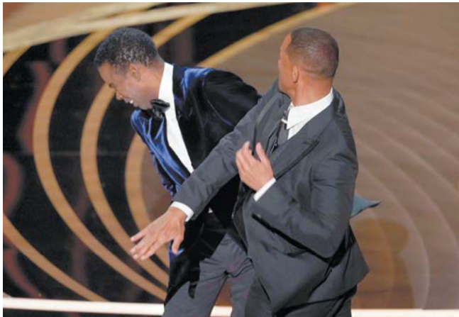
Эпизод с Крисом Рокком и Уиллом Смитом

Победителей не угадали Лучшим фильмом стала драма CODA, рассказывающая про непростые отношения