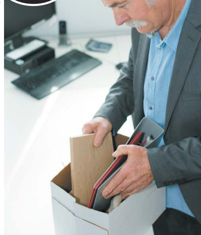
У Центра занятости населения в Санкт-Петербурге есть горячая линия, где специалисты готовы выслушать и помочь человеку, потерявшему работу: (812) 320-06-52