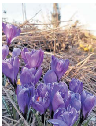
«Весна – слово из пяти букв всего, но в нём так много веры».