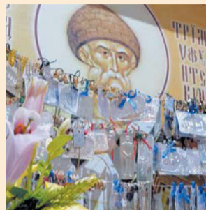
Храмовая икона с подвесками до ограбления

– Подвеска – это дар людей тому святому, которому они молились и получили просимое, – объясняет дьякон храма отец Серафим. – Это может быть что-то личное и что-то ценное. Для таких целей в нашем храме можно было приобрести специальную табличку с изображением дома, машины, семьи, ребёнка... Святой Спиридон «от-