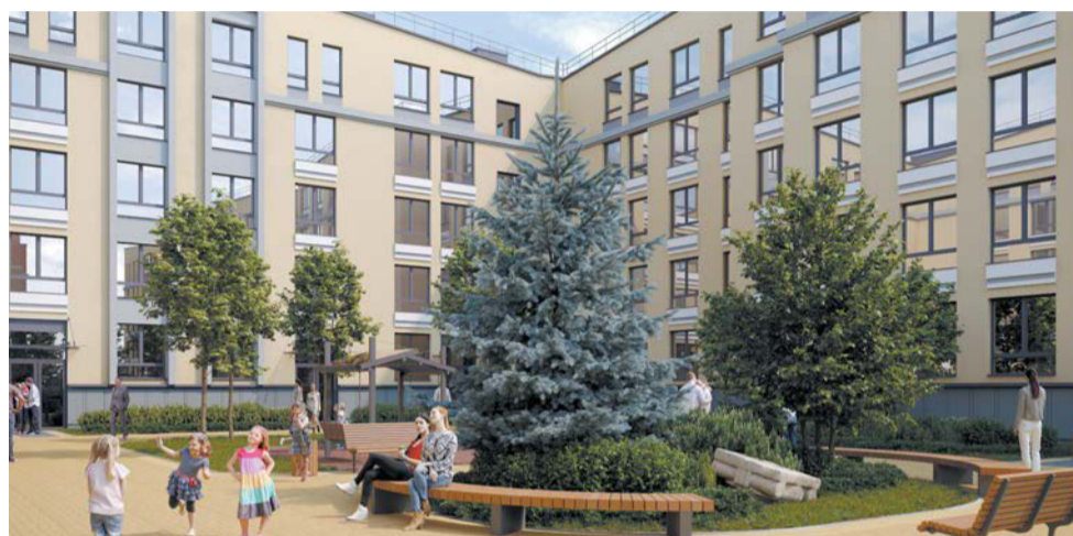
На практике вариантов для покупки жилья не становится меньше

Несмотря на то что ставка теперь составляет 12%, воспользоваться программой смогут практически все клиенты. Предыдущий лимит в 3 млн рублей делал льготную ипотеку недоступной для многих: оформить её могли либо покупатели самых бюджетных студий, либо обладатели большого первого взноса, — отмечает эксперт.