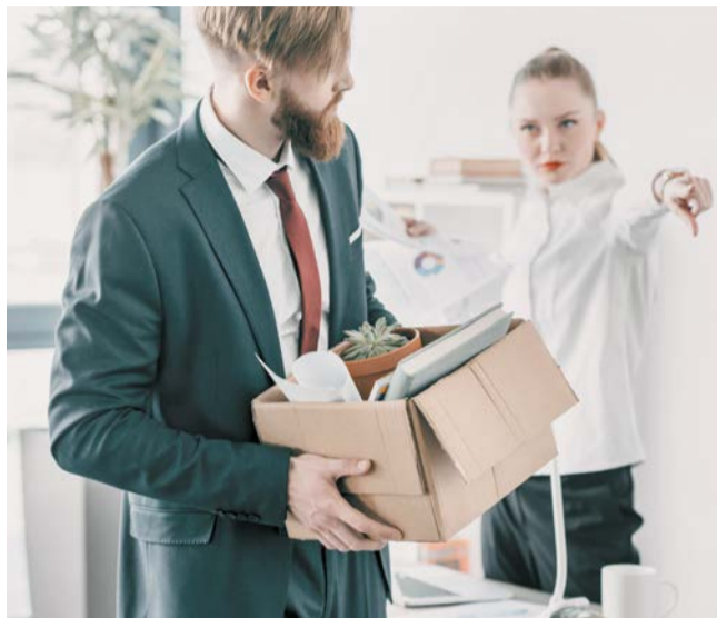
Сокращение, увольнение с работы – это стресс для человека. Мужчины такие кризисы часто переживают гораздо тяжелее женщин

Эксперт советует искать новую работу так, как ищите близкого вам человека. Представляйте её нужной, красивой и полезной. Такой она и появится, верьте в это – и ваша дорога приведёт вас именно туда. Не отчаивайтесь, если она не сразу откликнется. Помните: вы сильный человек, рядом с вами – друзья, они вас под-