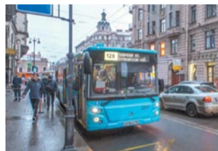
В новых автобусах есть кондиционеры, USB-розетки, мультимедийные экраны

– Все наши автобусы расширяют безбарьерную среду города. Благодаря отсутствию ступеней и откидной платформе в салон легко пройти и мамам с колясками, и маломобильным пассажирам, и лицам с самокатами, чемоданами и пр. Вдобавок автобус умеет