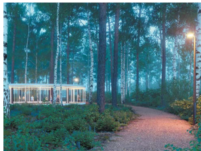
В парке будут созданы павильоны из лёгких и экологичных материалов

– Лесной массив и экосистема парка максимально сохраняются, а все площадки концентрируются в зонах, подвергшихся антропогенной нагрузке: на заросших дорогах и расчищенных территориях свалки строительного мусора, – продолжает Олег Шапиро.