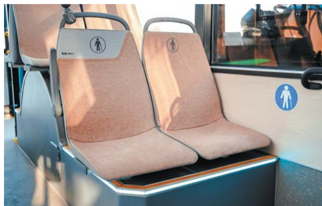
В новых автобусах МАЗ сделан светлый салон. В Петербург прибыла партия из 50 таких моделей | WWW.GOV.SPB.RU

Модернизация транспортной схемы пройдёт в три этапа. Каждый будет сопрово-