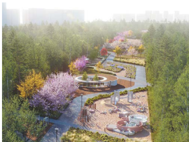
Весной на бульваре будут цвести яблони, каштаны, сирень

– Внутри ячеек кладут кору, шишки и другие предметы, которые своим запахом привлекают разных насекомых, – рассказывает Metro Олег Шапиро, основатель бюро, которое выиграло конкурс на благоустройство.