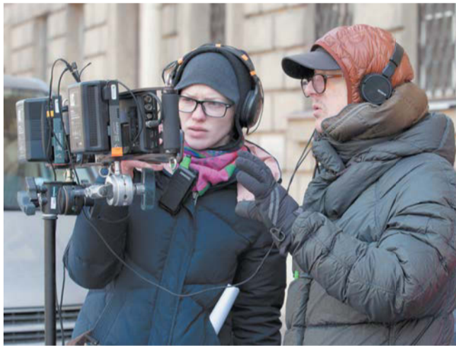
В Кировском районе Петербурга снимают один из районов Москвы

должил Игорь. – Но даже тогда никто не собирался ехать в Штаты. На улицах Всеволожска мы установим декорации и будем производить комбинированную съёмку, то есть снимать несколько объектов в разных местах, а результат потом монтировать.