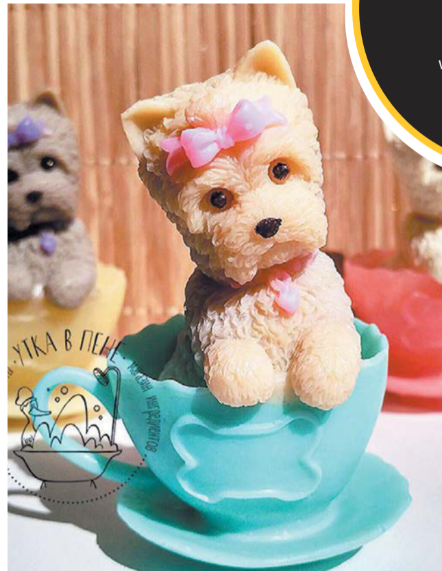
Купить ингредиенты для самодельного мыла можно в любом магазине для творчества