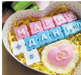
Хендмейд-мыло может стать оригинальным подарком на день рождения, Новый год, 23 Февраля, 8 Марта и даже на свадьбу | МАРИНА МАЛЬЦЕВА

8 Дождавшись застывания основы, вынимаем её из формы. Наше мыло готово!