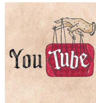
Логотип YouTube превратился бы в вывеску