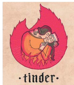
В Средние века любой бы сразу понял, что это приложение для поиска любви