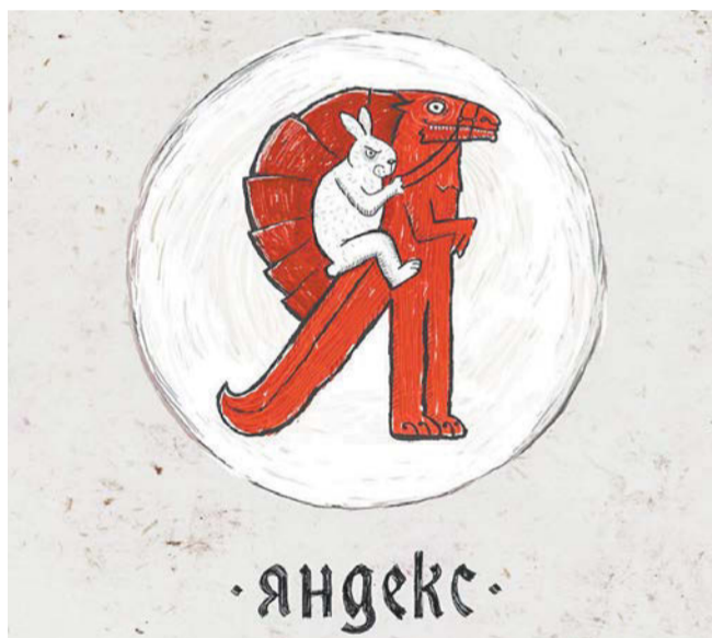
Такой воинствующий логотип «Яндекса» пользователи бы точно не забыли!