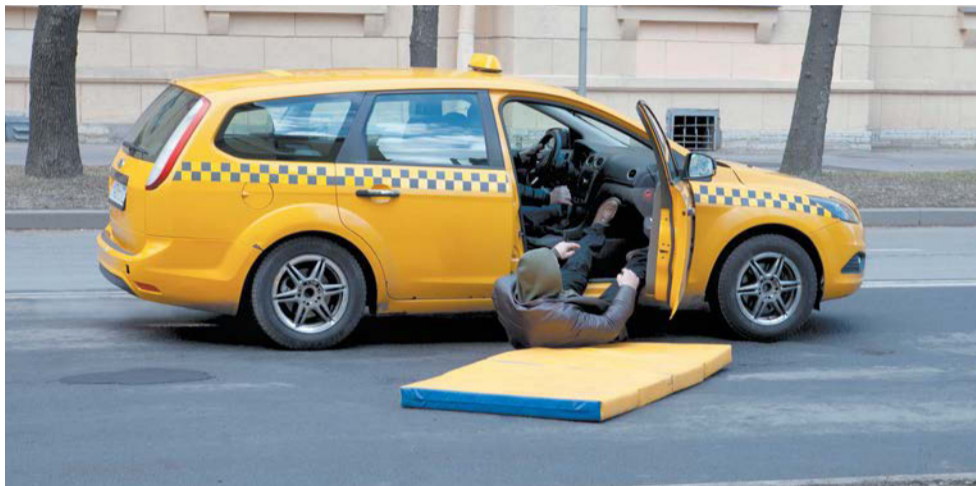
По сюжету американский шпион выпадает из машины | ИГОРЬ АКИМОВ

– Сериал, над которым мы работаем, был запущен перед Новым годом, – про-