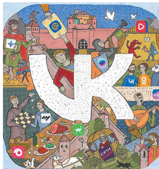
Эту иллюстрацию можно рассматривать часами и каждый раз находить здесь знакомые всем россиянам бренды. Признавайтесь, сколько насчитали вы?

Трикотажное производство приглашает в свою команду: