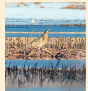
Большая выпь включена в Красную книгу Петербурга и Ленобласти. Птицы обитают на водоёмах

В Петербург прилетели краснокишечные выпи Птицы возвращаются из Африки и с юго-востока Евразии после зимовки. Горожане уже сообщили о трёх особях больших выпей. Информация об этом появилась в группе во «ВКонтакте» «Птицы СПб и России». Эти пернатые относятся к семейству цаплевых. METRO