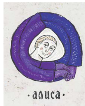
Голосовой помощник «Алиса» получил бы человеческое лицо