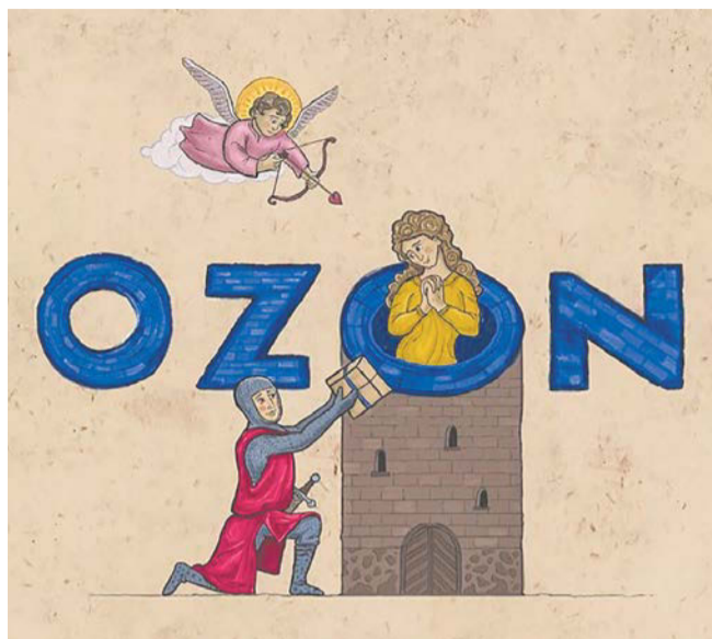
В Средние века посылки OZON доставляли бы рыцари. Вот это романтика!