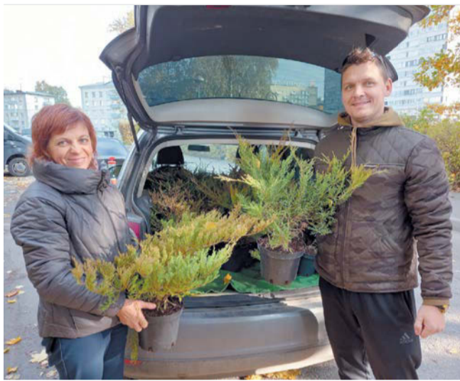
Активисты и их зелёная «награда». Где посадить дерево или кустарник, участники акции решают сами

– «Цена» выражается в зелёных баллах, а один зелё-