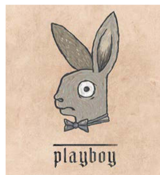
Знаменитый плейбойский кролик выглядит не таким равнодушным, как современный. Кажется, что у него в глазах даже читается испуг!

– эти годы принято называть Средними веками