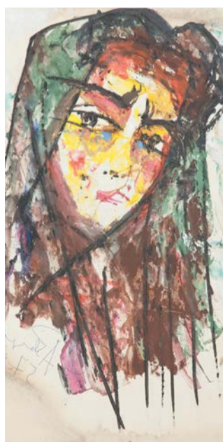
Выставку «Лики/Лица/Морды» посвятили художнику Анатолию Звереву

Команда «Культурной эволюции» подготовила для читателей Metro подборку самых актуальных событий из жизни Петербурга, которые ни в коем случае нельзя пропустить