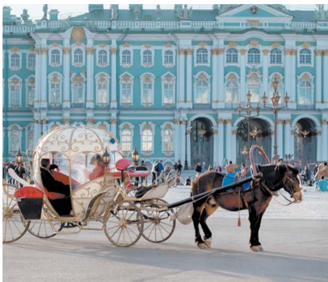
В XVIII веке, как и сейчас, в Петербурге можно было встретить только лошадей, остальной скот Пётр I запретил выводить на улицы | АЛЕНА БОБРОВИЧ

— Штраф мог составлять до 10 рублей, что по тем временам было большой суммой. При регулярных злостных нарушениях могли прибегнуть к розгам, — рассказывают Metro в пресс-службе регионального оператора. — Эти обязанности вменялись всем домовладельцам указом