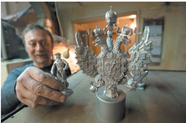
Экспозиция Музея оловянного солдатика понравится как детям, так и взрослым

Оркестр musicAeterna был создан в 2004-м в Новосибирске усилиями Теодора Курентзиса, в то время — музыкального руководителя Новосибирского театра оперы и балета. Летом 2019-го musicAeterna стал независимым коллективом. Теперь его творческая лаборатория — Дом Радио.