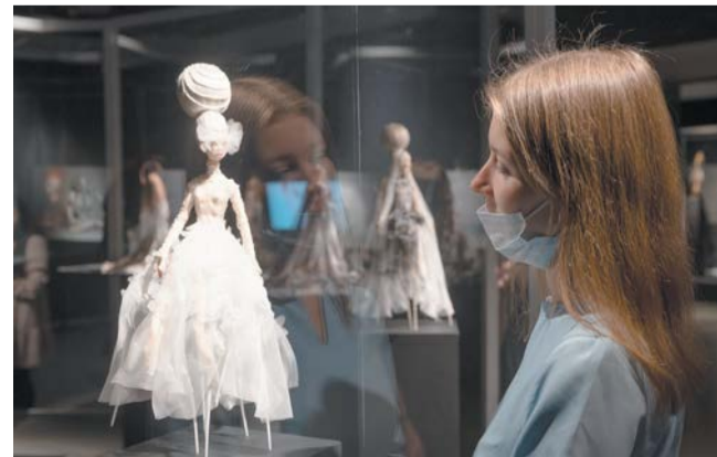
Выставку «Сёстры Поповы. Non-Nutap» можно увидеть в «Эрарте» до 10 мая

Работу ума и радость для глаз сочетает и выставка Сергея Сергеева в «Эрарте». Даже название «Свобода от актуальности» уже звучит предельно вызывающе. А когда видишь эти картины, где художник вовлекает в игру смыслов, зашифровывая свои послания под видом компьютерного теста Тьюринга, включается ещё и азарт детектива. Вишенка на торте: работы Сергеева находятся даже в коллекции кинодивы Хелен Миррен.