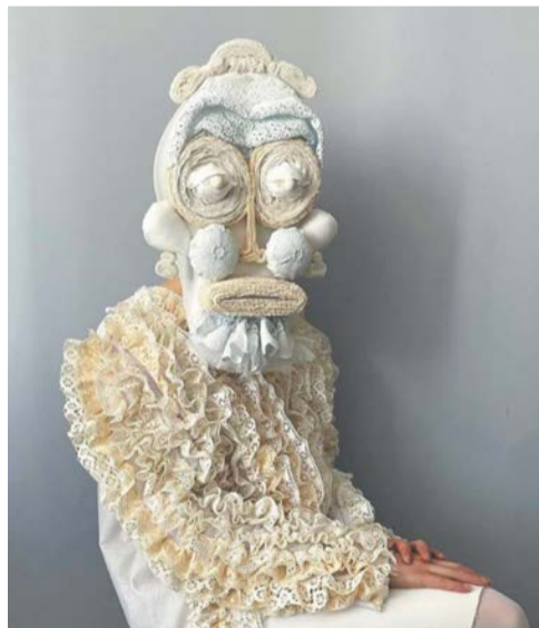
В шитье помощников у Венеры нет, все работы она делает сама

Модели дизайнера – это актёры перформансов