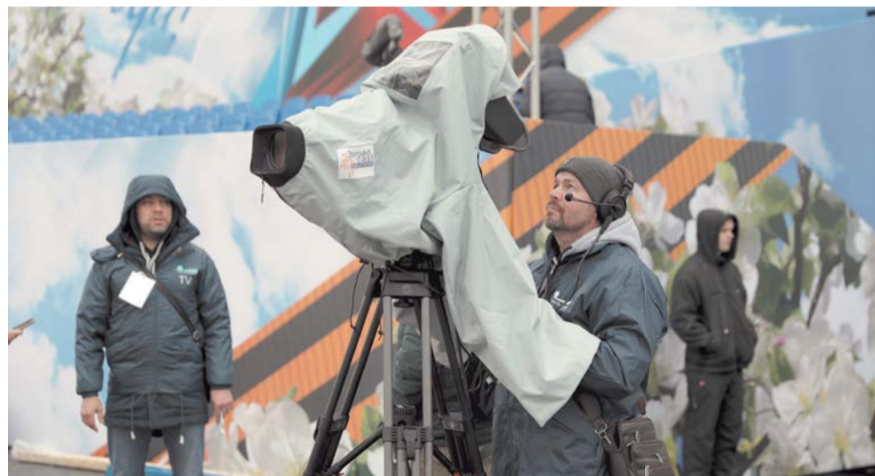
Журналисты телеканала «Санкт-Петербург» будут работать 8 и 9 мая, чтобы зрители могли почувствовать атмосферу праздника, не выходя из дома

8 мая телезрителям покажут пять художественных фильмов и два документальных: «Знамя Победы» и «От героев былых времён. Песни Великой Победы».