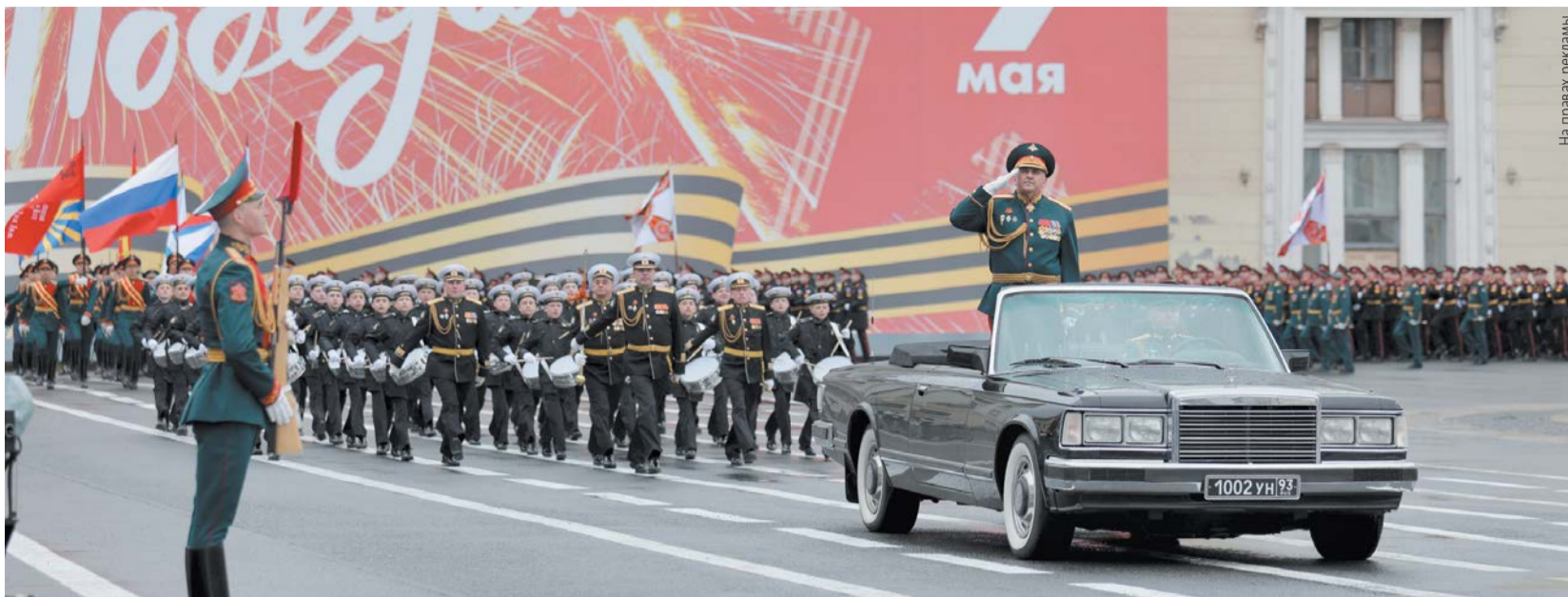
Включив телеканал «Санкт-Петербург», зрители почувствуют сопричастность с великим Днём Победы