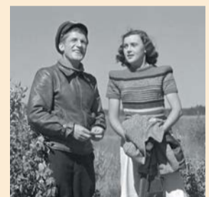
«Небесный тихоход» – советский музыкальный художественный фильм | СКРИНШОТ

художественных фильмов, которые покажут 8 мая на телеканале «Санкт-Петербург»