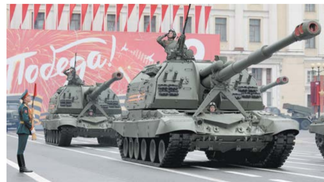
Специалисты делают всё, чтобы те, кто не сможет лично присутствовать на торжественных мероприятиях, ничего не пропустили