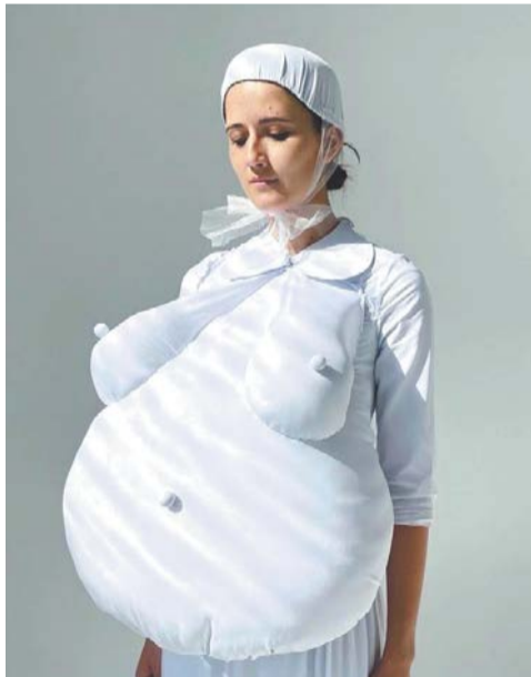
Одна из самых ярких и неоднозначных работ дизайнера