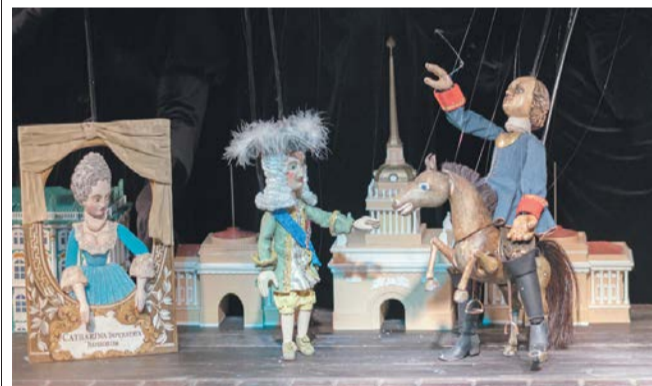
Сцена из спектакля: Александр Меншиков и супруга императора наблюдают, как Пётр I превращается в памятник самому себе