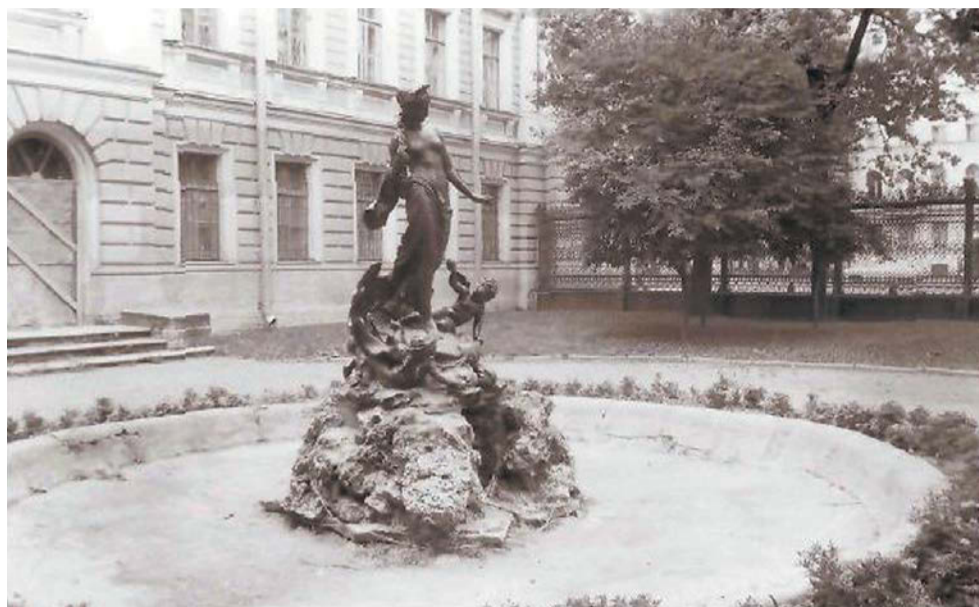
Петербургский климат чугунной Афродите не по душе – постоянные дожди и снег довели скульптуру до аварийного состояния

Первая Афродита, которая сейчас находится в фондохранилище КГИОП, была