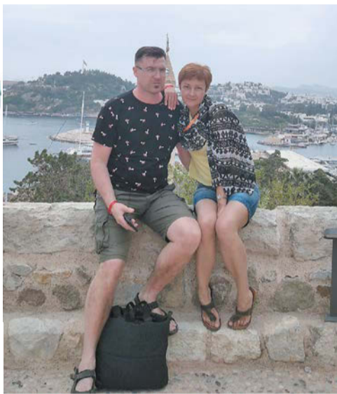
По словам туристов, турецкий Бодрум по климату и атмосфере напоминает соседнюю Грецию (отсюда хорошо виден остров Кос)