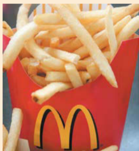
McDonalds должен перезапустить- ся летом