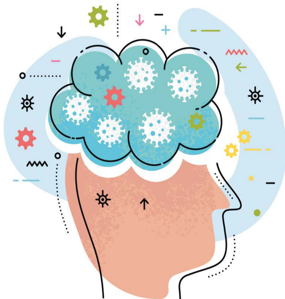
У участников эксперимента, переболевших коронавирусом, наблюдали снижение общего объёма серого вещества коры головного мозга

Потеря обоняния Одним из наиболее частых признаков возникновения и течения коронавирусной инфекции является короткая или же длительная потеря обоняния. Недавние исследования утверждают, что у 86% людей она может быть частичной или полной. А у меньшего процента пациентов, ко всему