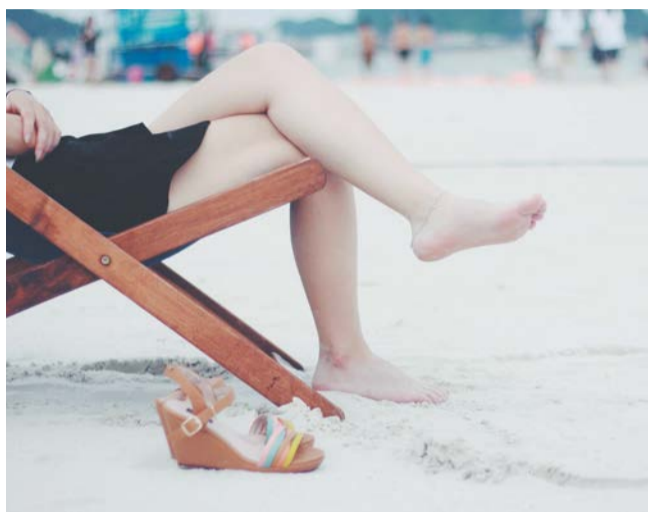
Перед долгожданным отпуском позаботьтесь и о здоровье своих ног | РИХАВАУ

Эффективным методом его лечения считается лазерная терапия. Она позволяет вылечить грибок без приёма системных препаратов и удаления ногтя. Сама процедура комфортная и хорошо переносится людьми любого возраста.