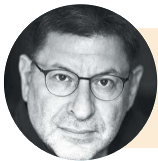
МИХАИЛ ЛАБКОВСКИЙ психолог