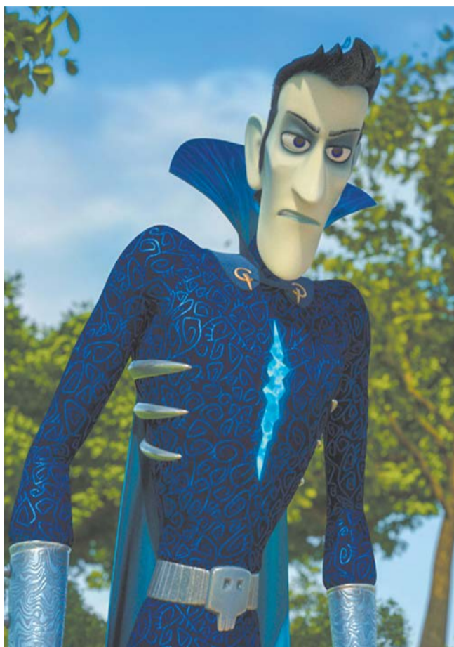
Кощей в новом мультфильме больше похож на принца

В кинопрокат вышел мультфильм «Кощей. Похититель невест», в котором знаменитый злодей предстанет в неожиданном образе. Metro поговорило с Виктором Добронравовым, озвучившим обновлённого персонажа