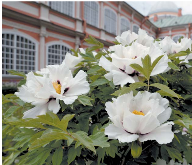
Пионы приветствуют посетителей распусившимися бутонами

В Петербурге завершился I Всероссийский фестиваль детского творчества «Арт-ассамблея». Культурный форум посвящён празднованию 350-летия со дня рождения Петра I. Участники фестиваля прошли в колонне театрализованного шествия уличного праздника «Россия молодая» в Кронштадте.