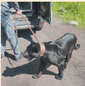
| ПРОКУРАТУРА САНКТ-ПЕТЕРБУРГА

фотосессий. При этом лицензия владельца разрешила содержать дикую кошку исключительно в зоопарке, расположенном не в границах города. Кроме того, у хозяина не оказалось на руках ветеринарных сопроводительных документов. Возбуждено административное дело. METRO