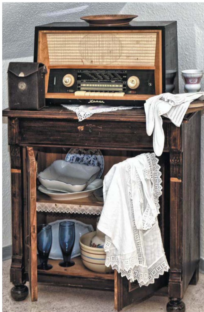
Многие выбрасывают антикварные вещи, хотя их можно продать и заработать денег