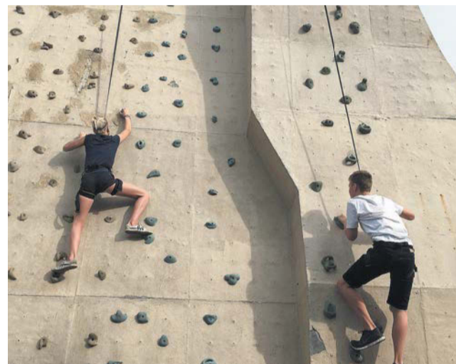
Адаптивное скалолазание помогает также усвоению норм и правил поведения, развитию речи и навыков социального взаимодействия

Родителям не стоит ожидать, что за несколько занятий