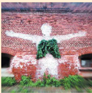
Где: Планетарий 1 Когда: 26–27 августа

XIII Международный экологический фестиваль искусств «КронФест» – проект, объединяющий искусство и экологию, пройдёт в Кронштадте с 25 по 28 августа 2022 года. Фестиваль является знаковым культурным событием Санкт-Петербурга. «КронФест» проводится 13-й год подряд, его события разнообразны и увлекательны. Центральным событием традиционно является выставка арт-объектов, созданных художниками из России и стран зарубежья. Где: Музей истории Кронштадта, форт Риф, форт Павел I Когда: 25–28 августа