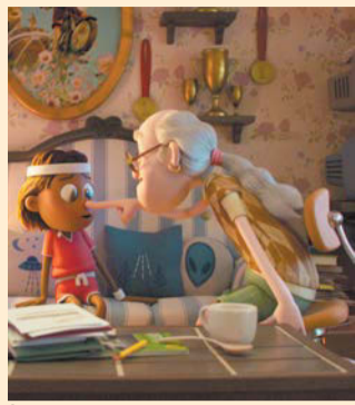
Где: 25 августа

Гости смогут не только узнать о музеях Северной столицы, но и принять участие в разнообразных мастер-классах, интерактивных детских программах, конкурсах, научных шоу, играх, розыгрышах призов. Программу дополняют музыкальные и театрализованные представления на сцене. Для детей до 16 лет – билет бесплатный. Где: Летний сад Когда: 27 и 28 августа