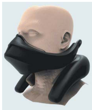
Маска-тренажёр создана из долговечного пластика и проста в использовании

— Внутри маски есть механизм — сеть каналов, встроенных таким образом, что, когда вы дышите, часть выдыхаемого углекислого