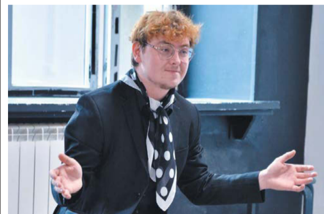
Режиссёр Владимир Чухланцев поставил спектакль по произведению «Иностранка»