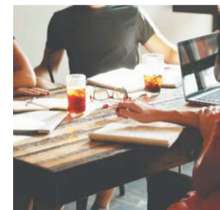
По закону длительность сверхурочной работы не может превышать четырёх часов в течение двух дней подряд и 120 часов в год | PИХАВАУ

здесь связаны с разными часовыми поясами. Не исключено, что уже в 6 утра сотруднику, который должен приступить к работе с 10, придётся отвечать на важный звонок, потому что на другом конце провода рабочий день в разгаре. METRO