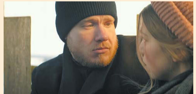
«Непослушник» | КАДР ИЗ ФИЛЬМА | КАРОПРОКАТ