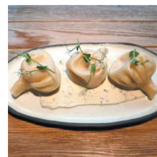
Хинкали с горгонзолой и томатами (ресторан грузинской кухни Vakh)

муссом из терьяки и кремом из брокколи. По вкусу такая рыба даже нежнее тунца. Вот чем угощают в «Charlie»: 1. Паштет из сома – подаётся на цельнозерновом хлебе, небольшая перчинка – это чили-масло. 2. Тапас с сардиной-иваси и с икрой сельди копчёной. Подается на сливочной бриоши с крем-чизом и грушей с зернистой горчицей. 3. Горячее – это фермерский сом, описанный выше. 4. Десерт – базиликовый крем на основе белого шоколада и базилика, лимонное граните и желе из одуванчиков. Подается вместе с миндальным печеньем. АННА СИРОТА