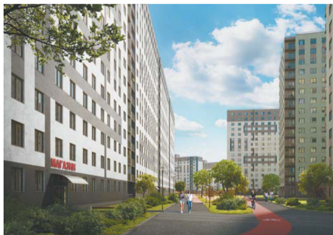
Стандарт нового жилья: вся необходимая инфраструктура внутри жилого комплекса

городских условиях сегодня это фактически невозможно, поэтому, когда речь идёт о настоящему экологичном жилье, обычно подразумевается крупная квартальная застройка в пригородах. Она предполагает собой не только комфортное место