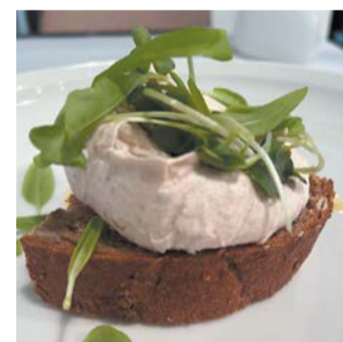
Паштет из копчёного сома и сеном из порея (ресторан Charlie) | АННА СИРОТА