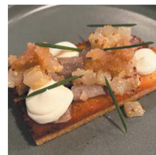
Тапас с сардинами иваси и подкопчённой икрой сельди (ресторан Charlie) | АННА СИРОТА