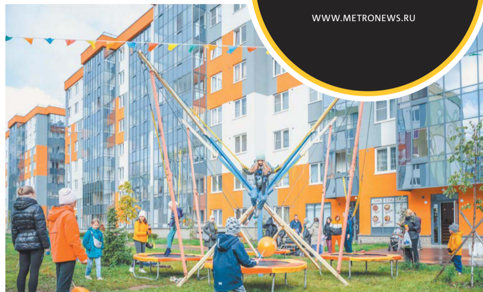
Атмосфера добрососедства и совместные активности не менее важны для жителей новых домов, чем инфраструктура, транспортная доступность и качественное жильё

– Нас радует, что среди наших жителей много инициативных людей, готовых внести вклад в то, чтобы сделать жизнь в своём комплексе интереснее, – отме-