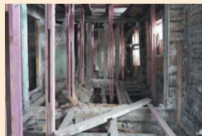
Внутренние интерьеры особняка утеряны

В Петербурге обсудили способ реставрации памятника деревянного зодчества на Васильевском острове, сообщается на сайте КГИОП. Председатель комитета Сергей Макаров призвал проектировщиков вместо новой древесины использовать исторические брёвна от разобранных срубов.