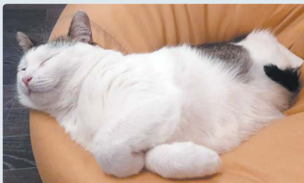
«Кошка Снежанна на своём любимом кресле». АЛЕНА

ДРУЗЬЯ, мы продолжаем конкурс «Без задних лап». Присылайте фото своих спящих котиков и небольшой рассказ о них (не более 70 знаков) на адрес konkurs@metronews.ru с пометкой «Без задних лап» или выкладывайте с хештегом #gazetametro. Лучшие мы обязательно опубликуем.