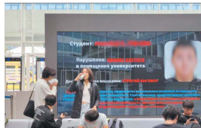
Экран с нарушителями висел в главном холле казахстанского университета | TELEGRAM-КАНАЛ «ATANOVKA98»

– Определённые лица начали жаловаться. В городе