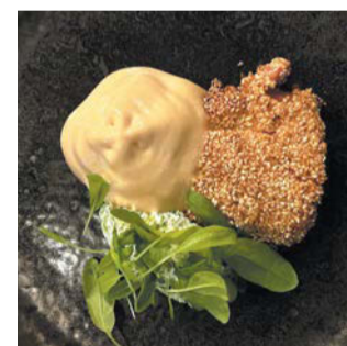
Сом мисо, обжаренный в кунжуте, с кремом из брокколи и муссом из терьяки (ресторан Charlie) | АННА СИРОТА