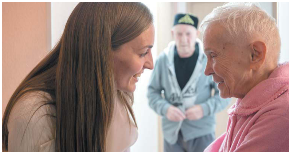
Постояльцы дома для пожилых не всегда могут вспомнить имена, но часто улыбаются

— Это не медицинское учреждение, а скорей взрослый детский сад. Но со своими нюансами. Наши сиделки