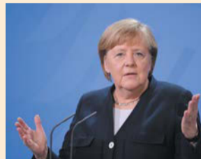
Ангела Меркель

Экс-канцлер ФРГ Ангела Меркель, выступая на открытии «Фонда федерального канцлера Гельмута Коля», призвала серьёзно относиться к словам Владимира Путина, пишет Süddeutsche Zeitung. «<...> Серьёзно относиться к ним – это ни в коем случае не признак слабости, а признак политической мудрости», – считает политик. METRO