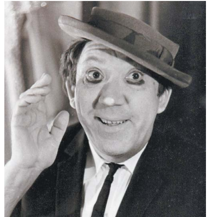
Знаменитый и любимый клоун. 1980-е годы