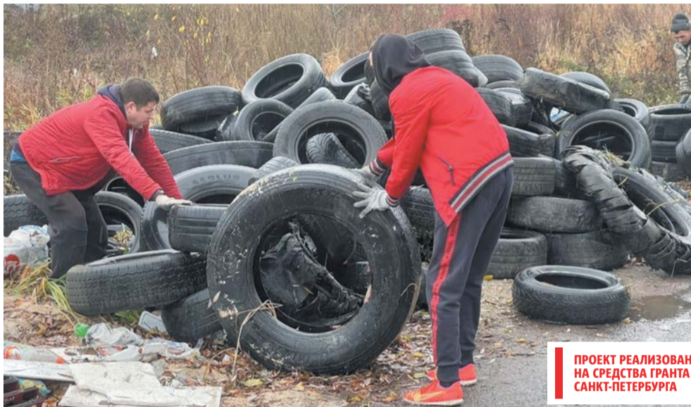
Стихийную свалку автопокрышек нерадивые горожане «приспособили» ещё и под бытовой мусор

Красносельский район, по мнению эоактивиста, один из самых загрязнённых в Петербурге. Чаше всего на улицах находят строительный мусор. Непростая ситуация со стихийными свалками, по