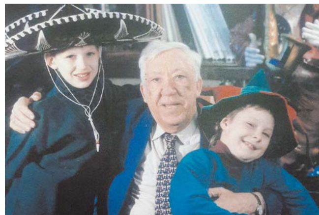
Юрий Никулин с внуками Юрием (слева) и Максимом. 1990-е годы

– Когда мы с братом были совсем маленькими, он с нами почти не общался, – говорит Юрий Никулин – младший. – Сюсюкаться не любил, а собеседники мы были так себе. Когда подросли и стали формулировать свои мысли, деду стало с нами интереснее. Но воспитанием он нашим не занимался. Конечно, объяснял, что такое хорошо, а что такое плохо и что спички детям не игрушки. Помню, что ему всё время было некогда: дед постоянно говорил по телефону. А когда появлялось время, рисовал нам рисунки, придумывал истории и озвучивал их. Так как мы были мальчишками, эти истории были связаны с военной тематикой. Но чья эта война, придумана она или нет, мы тогда не задумывались. Наверняка что-то придумывалось, а что-то бралось