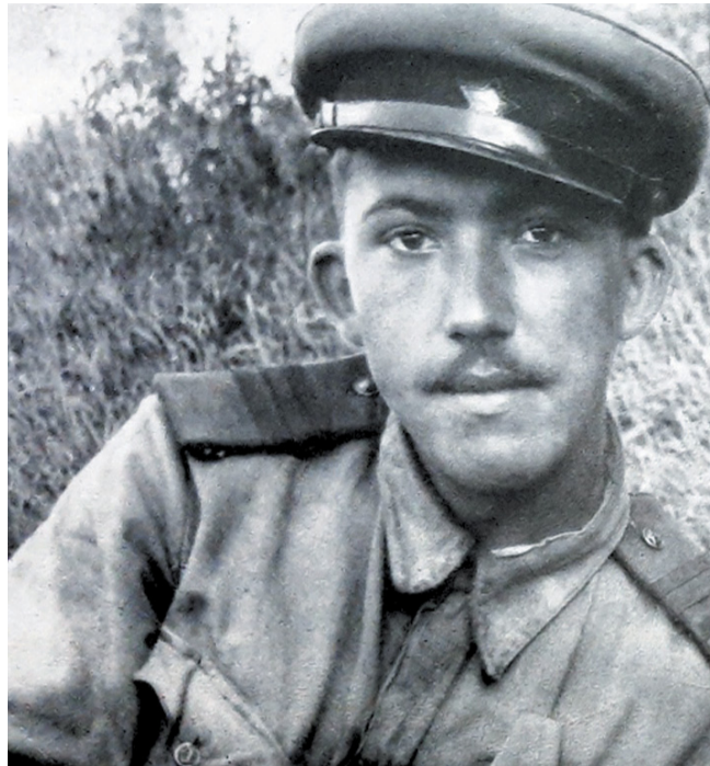
Фронтвик Юрий Никулин. 1940-е годы

Рыжая подопечная Ленинградского зоопарка приготовилась к зиме. Лиса по кличке Джинджер сменила шубку на более густую и пушистую. Цвет шерсти у зверя остался прежним. В природе в холодное время года лисам не нужна маскировка: они охотятся на грызунов под снегом.