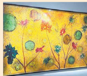
Абстракция Байдена-младшего

Работу сына Байдена оценили в $225 тысяч На выставке картин «Хайку» сына президента США Джо Байдена Хантера самая дорогая работа оценивается в $225 тыс. (более 14 млн руб.), и в ней уже заинтересованы два покупателя, передаёт New York Post. Как отмечает издание, картина без названия «продаётся по цене дома». Это уже вторая выставка Байдена-младшего. METRO