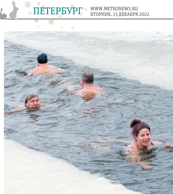
Моржи Петербурга встречаются на дорожке Матросского пруда каждые выходные