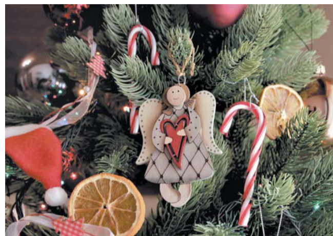
Ёлку и игрушки можно сдать в аренду (не забудьте попросить депозит) | PИХАВАЯ

Могут заработать даже дети Ещё один популярный лайфхак – вырезание снежинок и объёмных фигур. Вы не поверите, но и на этом можно заработать! Причём данная услуга пользуется неплохим