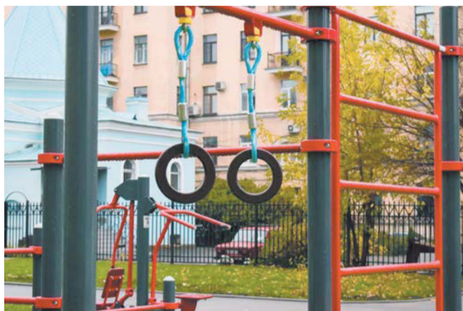
Воркаут-зона позволит петербуржцам оттачивать физические данные прямо во дворе

Площадь нового сквера – 3120 кв. метров. Занятие по душе