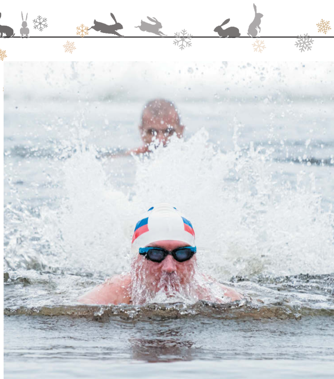
Некоторые участники клуба становятся победителями российских и международных соревнований по зимнему плаванию

В Царском Селе стартовал завершающий этап съёмок исторического сериала «Царская прививка». Сюжет фильма рассказывает о массовой вакцинации в России, которая прошла в 1768 году. Первыми привитыми стали императрица Екатерина II и цесаревич Павел. | ТЕЛЕКАНАЛ «РОССИЯ»