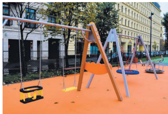
Сквер на Кировочной, 55, был готов ещё осенью, но специалисты устраняли недостатки

– Жители любых возрастов найдут для себя занятие по душе. Мама с детьми смогут с комфортом провести досуг на новой детской