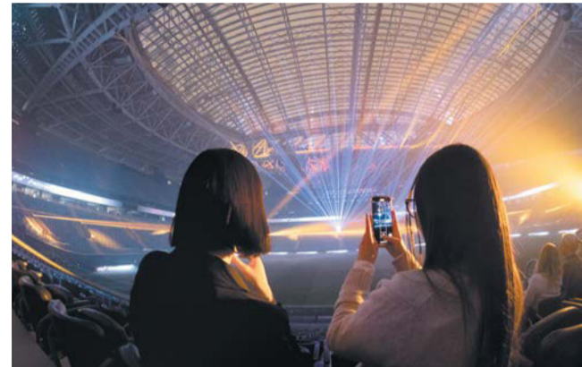
Шоу будут показывать до марта

Чемпионат России по футболу вернётся только в марте. Впрочем, у петербуржцев будет другой повод прийти на главную спортивную арену города