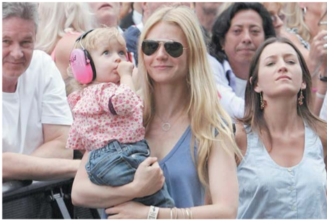
Гвинет Пэлтроу назвала свою дочь необычным именем Эппл, что в переводе с английского означает «яблоко». Сейчас «ребёнку» уже 18 лет, но имя она менять не стала

Что касается девочек, то остаётся только гадать, как