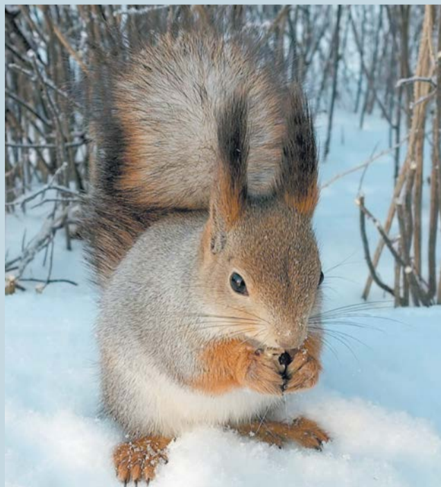
«Красотка парка». | @KRA582-96