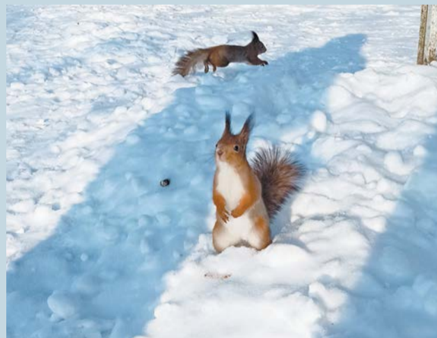
«Две подружки». | ДАРИЯ СИТКОВА