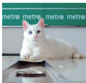
Предсказатель Ахилл в редакции Metro | АЛЕНА БОБРОВИЧ

Кот-оракул Ахилл сейчас также занимается терапевтической практикой, работает в хосписах. До этого он успешно предсказывал футбольные матчи. Прославился во время чемпионата мира – 2018 и Евро-2021. Точный возраст Ахилла никто не называет. Известно, что 10 лет назад он жил в подвалах Эрмитажа. Сотрудники котафе говорят, что кот находится в самом расцвете сил.