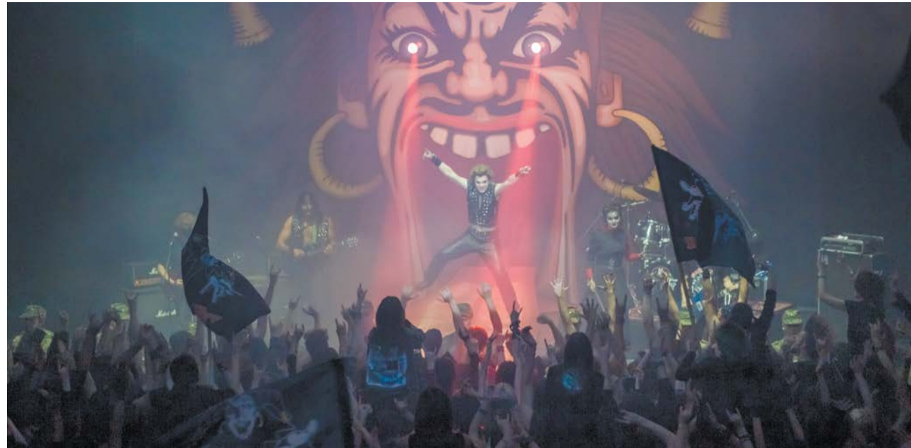
За 26 лет своего существования группа «Король и Шут» записала 19 альбомов и сборников, выпустив несколько сотен песен