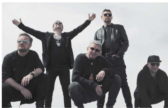
Группа «7Б»