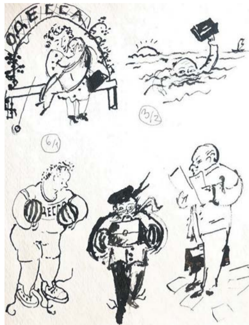
Одна из иллюстраций к книге Михаила Жванецкого. Резо Габриадзе всегда рисовал своего друга