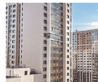
Сегодня модное направление в градостроении — комплексная застройка | METRO

«Такая застройка должна в себя вмещать всю палитру разных градостроительных вещей, таких как отдых, развлечения, обслуживание населения... Сейчас, как правило, этот вид застройки неполноценен. Она ограничивается жилыми домами, парковками, детсадом, школой и поликлиникой. Необходимо дополнять это и бизнес-инкубаторами, и научными центрами, и зелёными