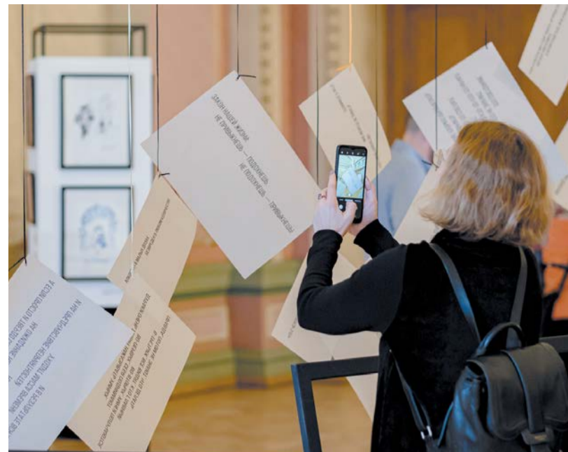
В фойе театра появился чемодан с цитатами сатирика