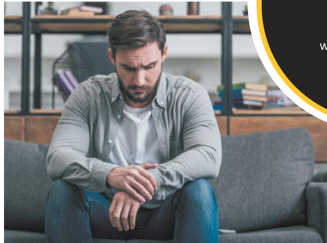
Если жена вдруг начнёт получать больше денег, разговоров на эту тему не избежать

Мужчины по-прежнему зарабатывают больше женщин, однако этот финансовый разрыв сокращается. Metro разбирается, что делать мужу, если у жены кошелек толще