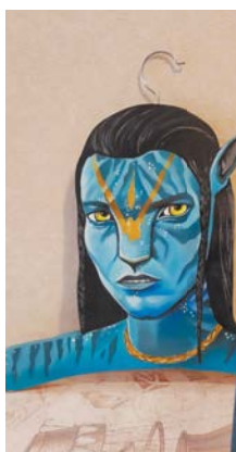
Плечики выдержат даже тяжёлую зимнюю одежду. На фото «Конь в пальто», герой из фильма «Аватар» и Фрида Кало