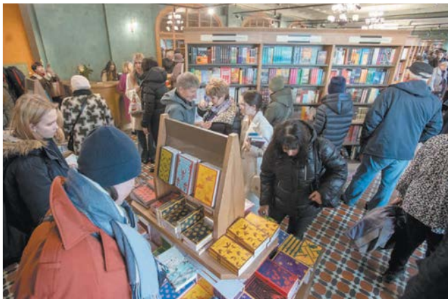
Дом книги отреставрировали в 2022 году