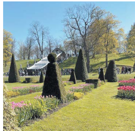
Пирамидальная формовка в Петергофе | АННА СИРОТА

до начала вегетационного периода – это февраль, март, апрель.