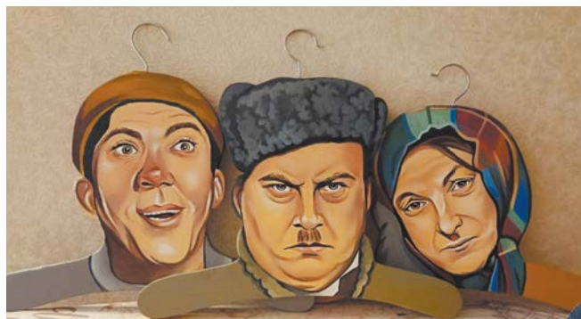
Балбес, Бывалый и Трус хорошо смотрятся в наборе. Эти ребята «уехали» жить в Санкт-Петербург