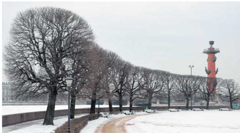
На стрелке Васильевского острова деревья «квадратные»