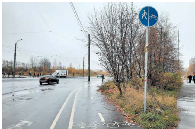
Сейчас в приоритете велосипедная дорожка. Если её нет, тогда двигаться нужно по тротуару, а если и он закончится – по обочине проезжей части