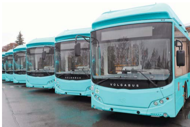
Новая партия лазурных автобусов пополнит городской автопарк | GOV.SPB.RU