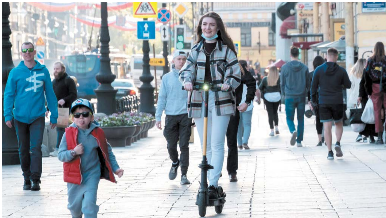
В прошлом году правил придерживались только прокатчики электросамокатов, в этом году ограничения коснутся всех | ИГОРЬ АКИМОВ