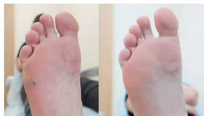
Фото до и после процедуры | MEDCLUB

В кабинете медицинского педикюра для решения проблемы применяются специ-