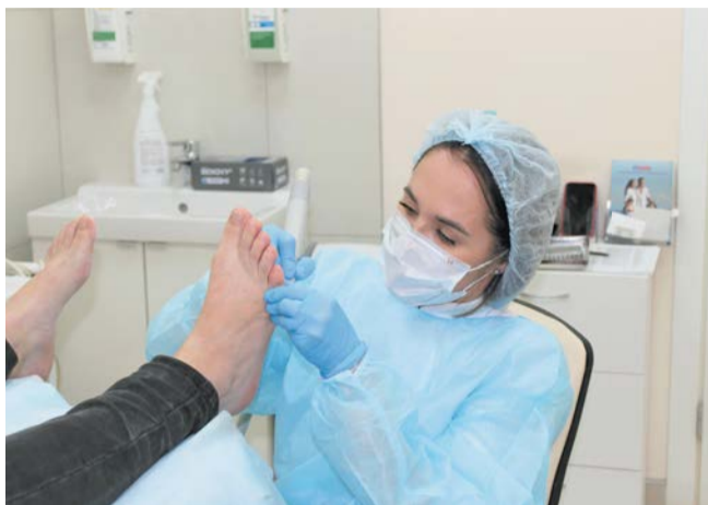
Процедура медицинского педикюра проходит абсолютно безболезненно | MEDCLUB

К подологу стоит обратиться, если у вас отходят от ложа или сорваны ногти, если они трескаются или плохо растут, если появились