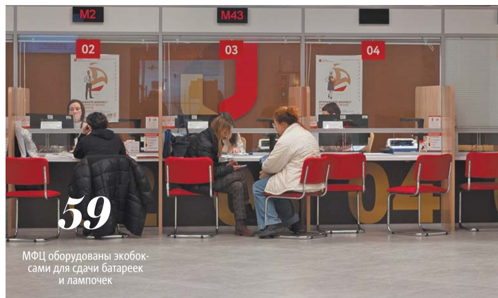
МФЦ оборудованы экокотельнями для сдачи батареек и лампочек

– Это удобно, потому что адреса центров хорошо знакомы петербуржцам, а МФЦ работают в каждом районе