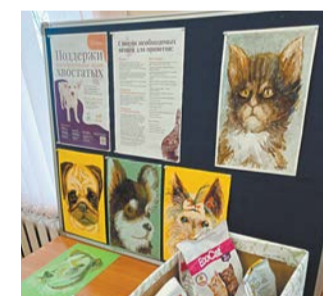
ПРЕСС-СЛУЖБА БИБЛИОТЕК ФРУНЗЕНСКОГО РАЙОНА

www.доли.рф ВЫКУП ДОЛЕЙ КВАРТИР 648-8888