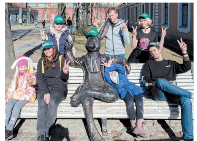
Групповое фото редакции вместе с самым весёлым зайцем, загорающим возле Инженерного дома