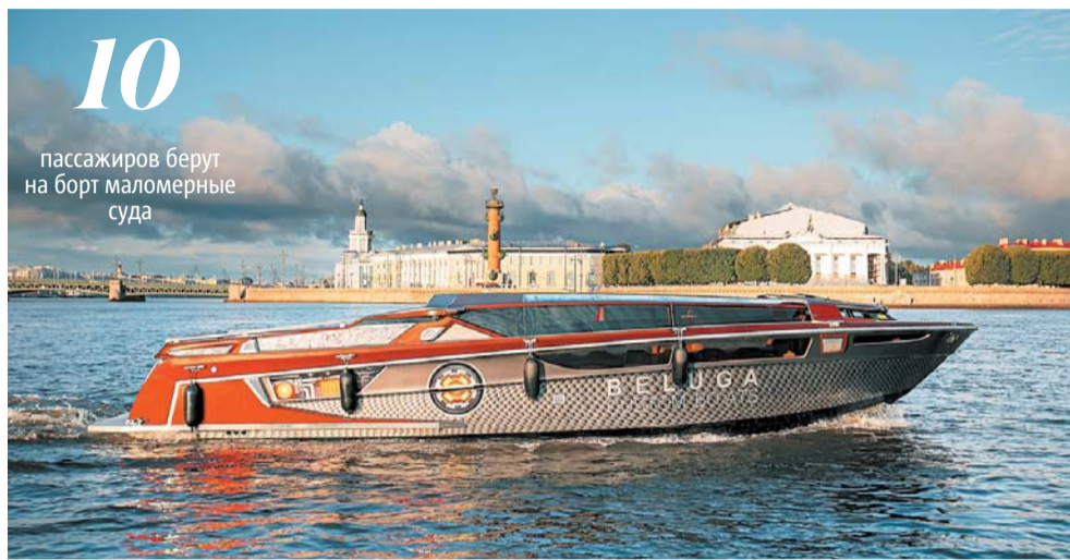
Туристы сравнивают «Белугу» с космическим кораблём или летающей тарелкой

Константин. – Первая, самая простая – теплоход «Ладога», вторая, сделанная в итальянском стиле – кораблик «Византия». А последнюю, может, это и пафосно звучит, решил назвать яхтой. Я очень давно в нашей сфере видел множество различных плавсредств. И мне всегда хотелось сделать что-то необычное, красивое и, главное, просторное и комфортное. Несколько лет назад Константин