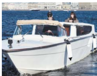
На реках и каналах города можно встретить итальянское такси