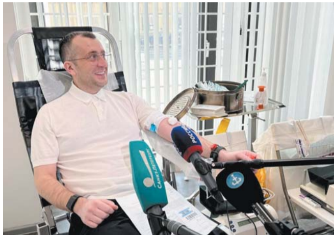
Борис Пиотровский стал донором