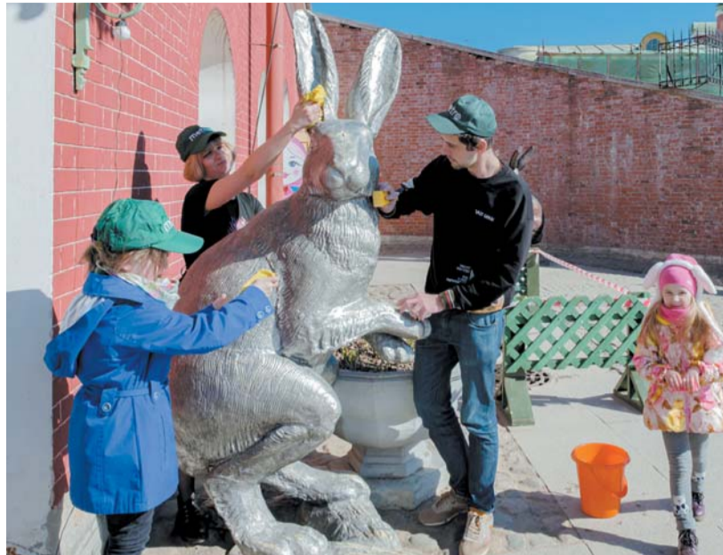
Скульптуры ушастых символов острова на территории Петропавловской крепости мыли всей редакцией, к нам присоединились дети сотрудников