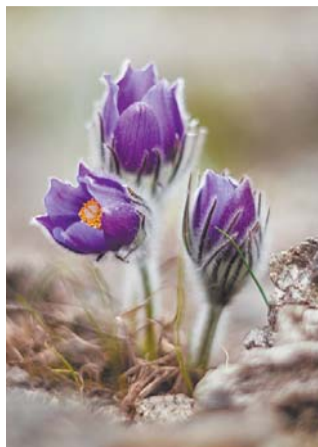
Прострел в Ботаническом саду

– Первоцветы часто цветут на 5–8-й год жизни, так что каждый сорванный букет наносит огромный вред. Если уничтожить первоцветы, то они просто исчезнут и ничего не будет нас радовать ранней