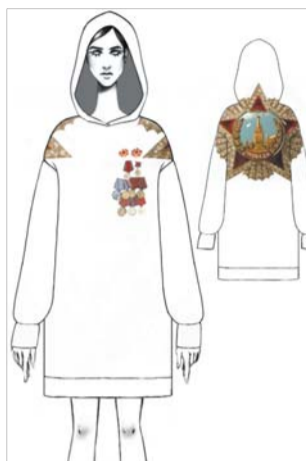
В коллекции отражено новое прочтение главных символов Победы: ордена Победы и ордена Славы, Вечного огня, плаката «Родина-мать зовёт» и красных гвоздик