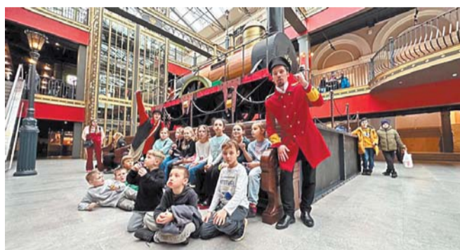
«Загадки Vokzal 1853»