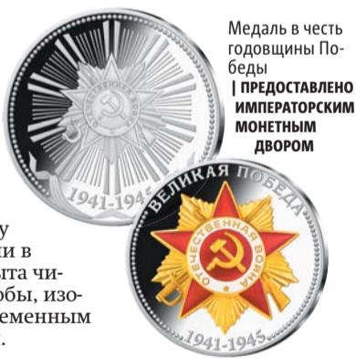
Медаль в честь годовщины Победы

В честь годовщины Победы Императорский Монетный двор выпустил медаль с орденом Великой Отечественной войны. Орден – ярчайший символ военной истории, один из немногих, остающихся в наследство будущему поколению. Как пояснили в компании, медаль покрыта чистым серебром 999-й пробы, изображение нанесено современным методом цветной печати.