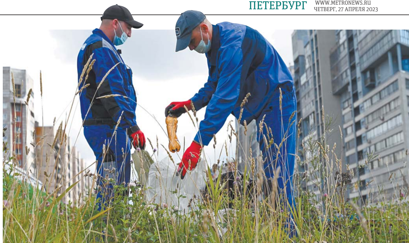
В «Добрый субботник» петербуржцы смогут убрать мусор, посадить дерево и повисить свою экограмотность | СОЦСЕТИ КОМИТЕТА ПО БЛАГОУСТРОЙСТВУ