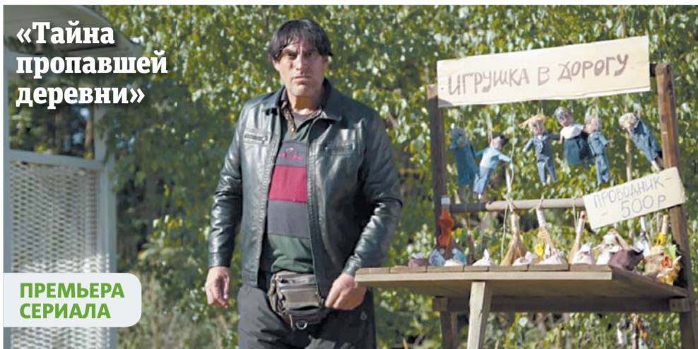
Столкновение города и деревни напоминает, что в чужой монастырь со своим уставом лезть не стоит | ПРЕСС-СЛУЖБА СЕРИАЛА (16+)