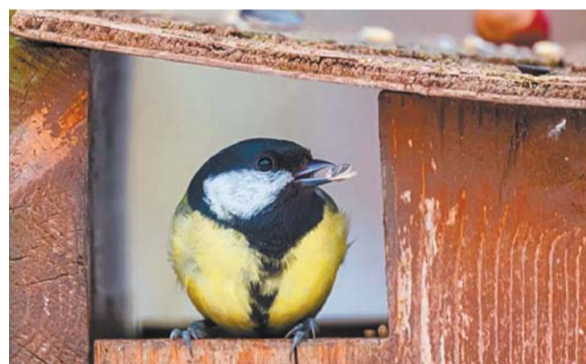
Юные петербуржцы разместят в парках скворечники | АЛЕНА БОБРОВИЧ

– У нас будет открыто для уборки несколько точек: Таврический, Некрасовский,