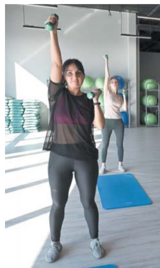
Бокс – это эффективное кардио

Тренировка по боксу длится 40 минут. Вторая её часть посвящена основам единоборства. Первым делом учимся стойке бойца. Ноги ставим на ширине плеч, стопу правой ноги разворачиваем примерно на 45 градусов.левой при этом делаем шаг