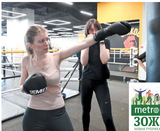
К груше нас подпустили только ради красивого фото

Перед освоением боксёрской базы разогреемся пробежкой – немного напоминает физкультуру в школе. Но по-