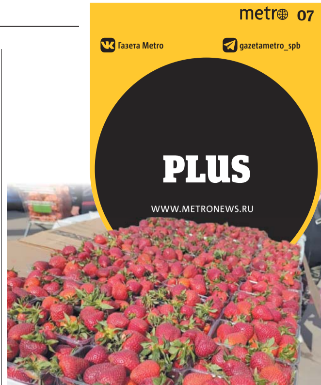
Спелую и качественную клубнику выдадут равномерный цвет и яркий аромат

После инъекций кожа действительно стала выглядеть помолодевшей и увлажнённой. Врач предупредила, что результаты биоревитализации наиболее полно начинают проявляться через неделю после проведения процедуры и сохраняются до полугода. Уже спустя три недели я увидела, что заметно подтянулся и овал лица за счёт того, что кожа помолодела и стала более упругой и свежей.