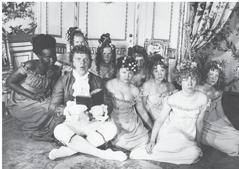
Кадр из фильма «Звезда пленительного счастья»

Напомним, что закрытие «Пионерской» запланировано на 24 июня. Станция возобновит свою работу 22 августа. В ходе работ специалисты заменят железобетонные плиты перекрытий у турникетов и около эскалаторов.