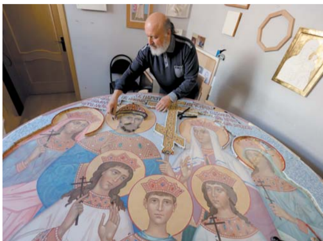
В цехах мастерской кипит работа над мозаикой с царской семьёй

– Мы делаем модули для ребят-инвалидов, а потом их соединяем, – рассказывает журналисту Metro испол-