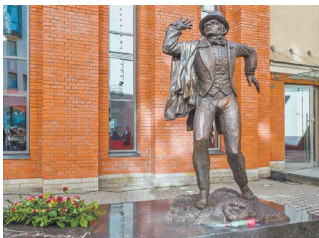
В театре установили памятник Мейерхольду | АЛЕКСАНДРИНСКИЙ ТЕАТР