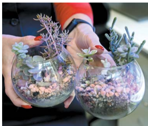
Зелёные подопечные пятиклассников – суккуленты: дети сами подготовили землю и высадили семена