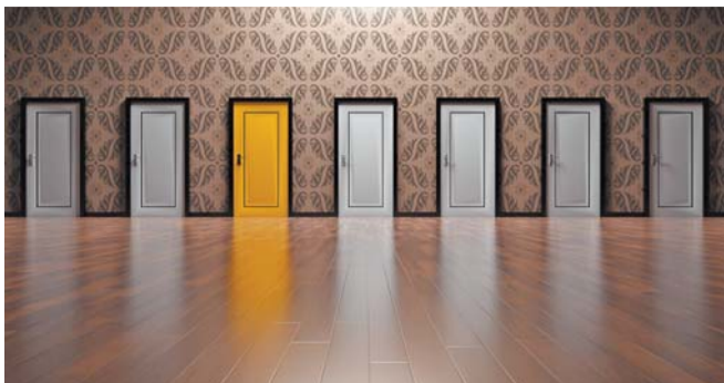
Межкомнатная дверь нужна не для каждого проёма в квартире | PИХАВАУ