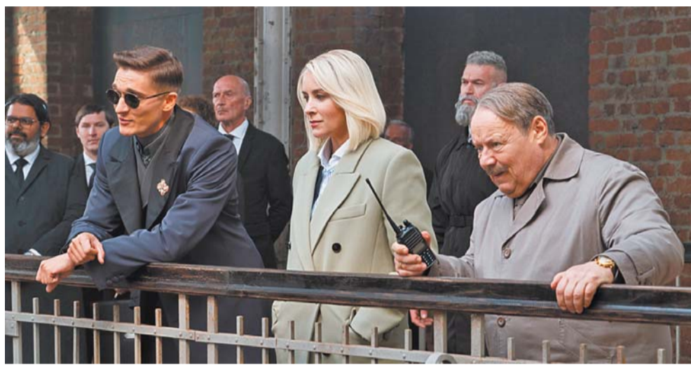
Актеры Матвей Лыков, Ольга Сутулова и Алексей Маклаков в образах своих героев