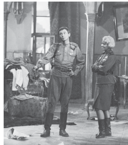
Фильм «Женя, Женечка и «Катюша». В кадре актёры Олег Даль и Галина Фигловская