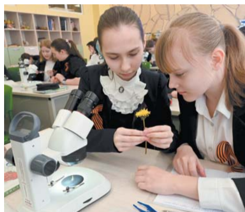
Строение одуванчика петербургские лицеисты изучают не только в теории, но и на практике

к искусственному свету горох, горчица, редис, свёкла. Весь урожай юные петербуржцы вырастили сами. Лицеисты выбирают семена, смешивают почву, следят за развитием зелёных подопечных.