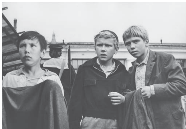
Кадр из фильма «Зелёные цепочки». В этом фильме звучит песня «Мальчишки у стен Ленинграда», которую во времена СССР пели во всех школах

Выставка откроется 30 июня и будет работать до конца лета.