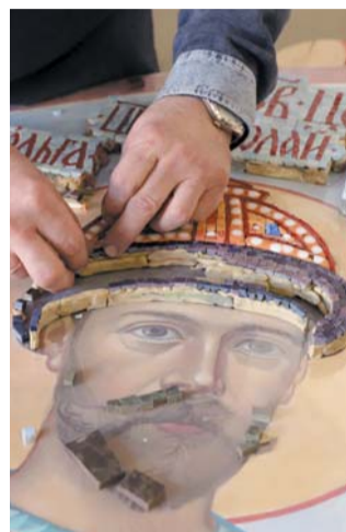
Лики святых – самая сложная часть работы над иконой

ликов. Между тем в многофигурности мозаичной иконы кроется её уникальность. Руками сотрудников реабилитационного центра «Монастырская слобода» собрано уже четыре изображения с образами святых: Александром Невским и его старшим братом Феодором Новгородским, Ксенией Пе-