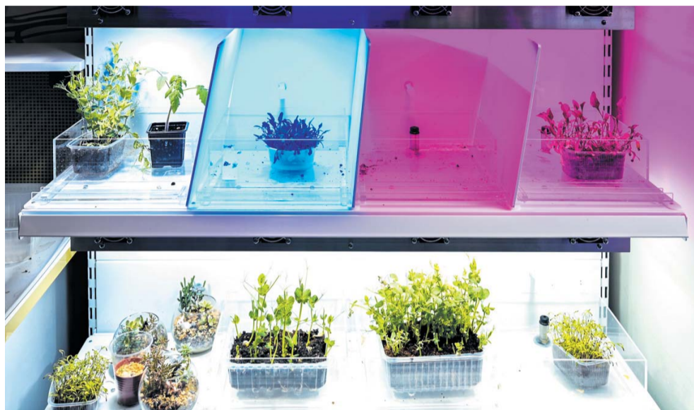
В ботанической лаборатории младшеклассники выращивают микрозелень, а старшеклассники экспериментируют со светом и огурцами