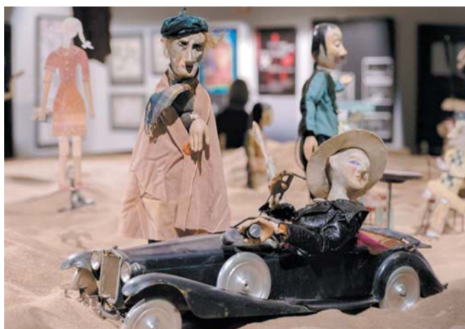
Премьера состоялась в 1996 году. «Песню о Волге» показывали в Петербурге, спектакль гастролировал по Европе