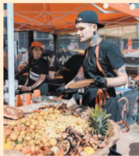
«ЖаритьФест» займёт площадь более 15 000 кв. метров

8–9 июля в Петербурге состоится большой семейный гастрономический шоу-фестиваль «ЖаритьФест». Он объединит собой пространство культурного квартала «Брусницын», Roof Place и набережную Финского залива и будет посвящён теме «Кухни мира» – гости смогут познакомиться с кулинарными традициями разных народов.