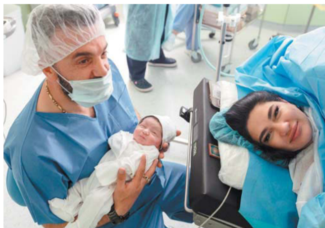
По словам психологов, партнёрские роды сближают супругов

– Супруг находится у головы жены, чтобы помогать ей дышать, вместе тужиться, разговаривать, смотреть в глаза, поддерживать, держать за руку. Если мужчина хочет перерезать пуповину, то он тоже видит лишь маленький её кусочек, который нужно перерезать. Вся анатомия и физиология