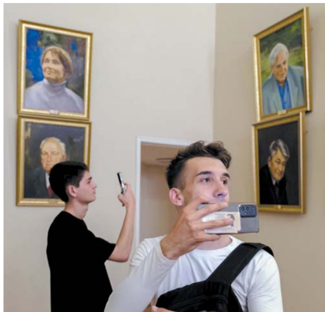
Выпускники мариупольских школ осмотрели залы Марининского дворца, посетили церковь и спустились по знаменитому пандусу

Большой проспект Петроградской стороны впервые опередил Старо-Невский проспект по количеству магазинов одежды, аксессуаров и обуви. Новую главную модную улицу назвали специалисты NF Group. Как отмечают аналитики, примерно каждый третий арендатор на главной магистрали Петроградки представлен в категории fashion-ритейл. Рост происходит за счёт локальных брендов. Часть из них открыли магазины побольше, переехав из небольших помещений, другие раньше были представлены исключительно в торговых центрах. Также некоторые компании из других регионов страны начали свою экспансию в Северную столицу с Большого проспекта.