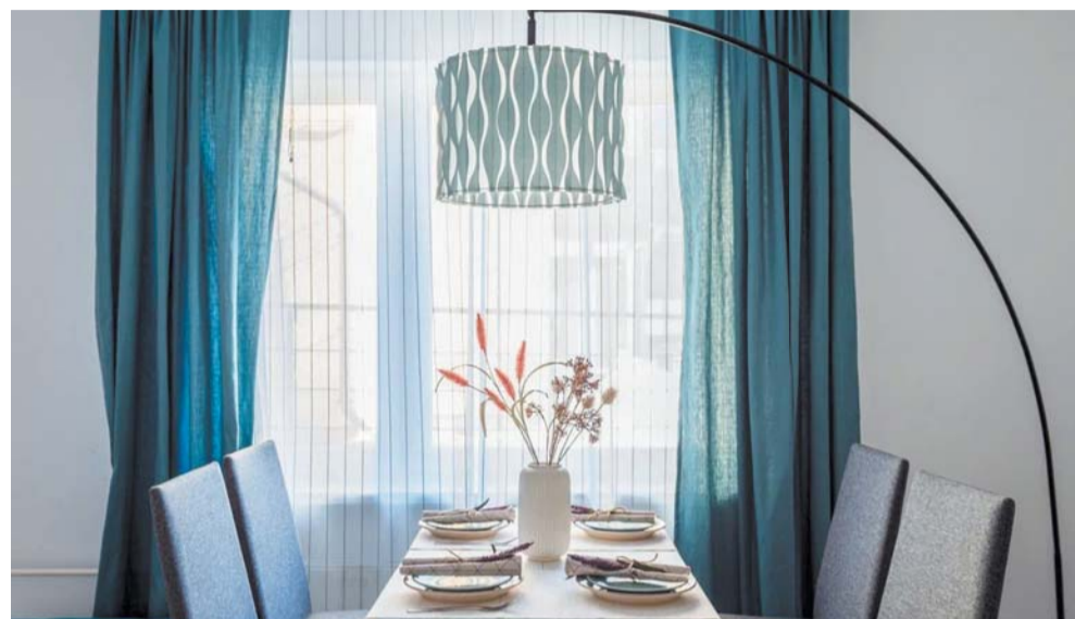
Поменять свою квартиру в хрущёвке или брежневке на новую, светлую и современную, можно через специалистов застройщика

Как объясняют представители застройщиков, сначала покупатель выбирает новую