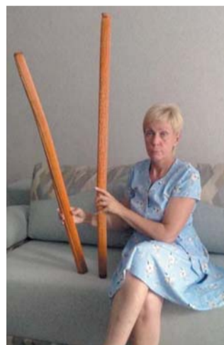
Рейнстик, или посох дождя – музыкальный инструмент индейцев

ми от пластиковых бутылок затыкаем его с двух сторон. Я пробовала всё: рис, горох, пшёнку, бисер. И постоянно был разный звук! Чем длиннее палка, тем он дольше.