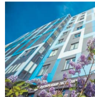
Трейд-ин для застройщика – возможность увеличить спрос

По словам экспертов, на трейд-ин застройщик не зарабатывает. Наоборот, компании часто дают скидки при использовании такой программы – ведь это возможность увеличить спрос.