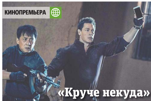
Главные герои сражаются вместе | КАДР ИЗ ФИЛЬМА (16+)

Может быть, больших результатов Рыбы и не добьются, но смогут послужить многим людям.