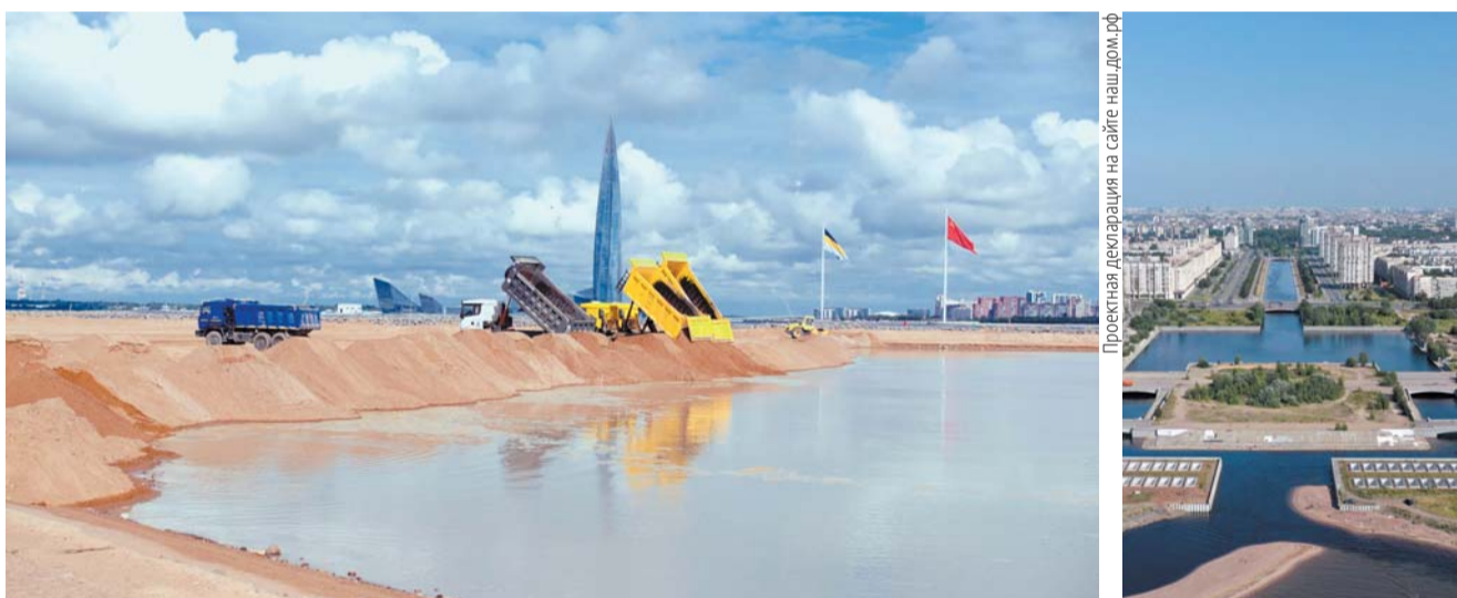
Намывные территории на Васильевском острове