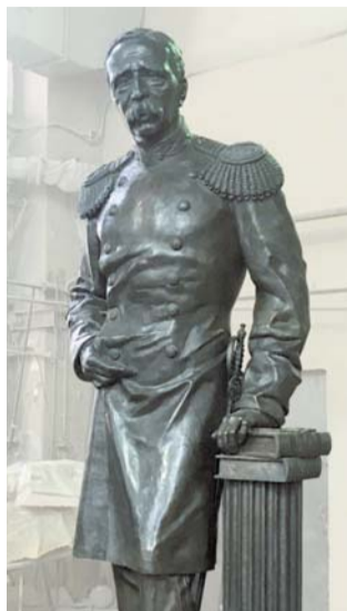
Памятник принцу Ольденбургскому