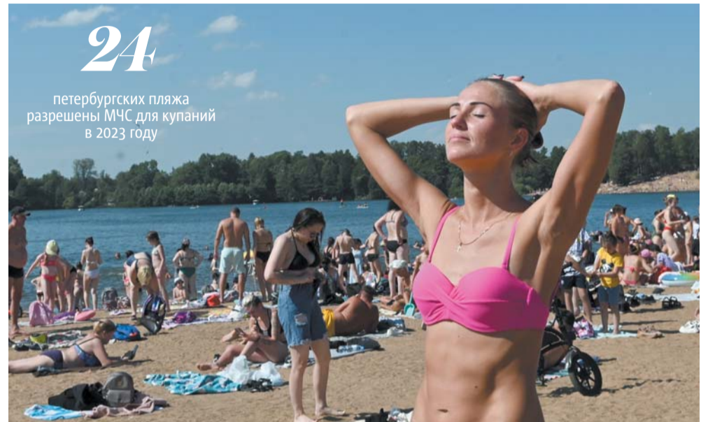
У Верхнего Суздальского озера ажиотаж — петербуржцы заполнили пляжи | ИГОРЬ АКИМОВ

Во избежание трагедий спасатели ежедневно устраивают профилактические рейды.