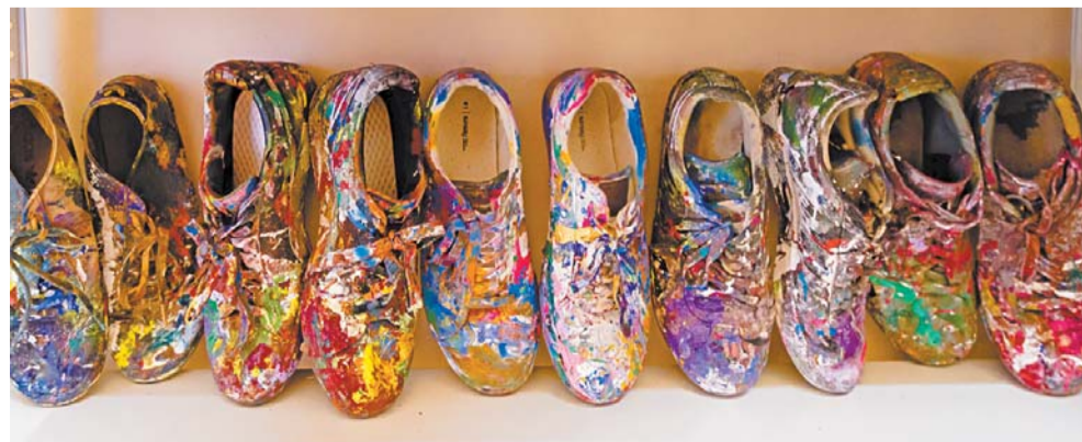
Коллекция кроссовок брейк-дансера из Петербурга

стиль – нукусизм. Он подразумевает бессознательные линии, которые пересекаются между собой, имеют своё