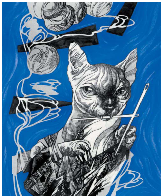
«Кот за вязанием»