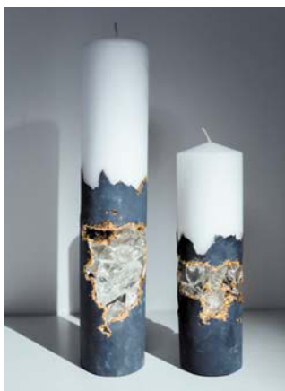
Свечи с горным хрусталём, созданные из продуктов переработки

— Директор этого регионального оператора — девушка. Если бы вы взглянули на неё, то в жизни бы никогда не подумали, что это руководитель. Она такая утончённая, лёгкая. Поэтому и верхние ноты фруктовые.