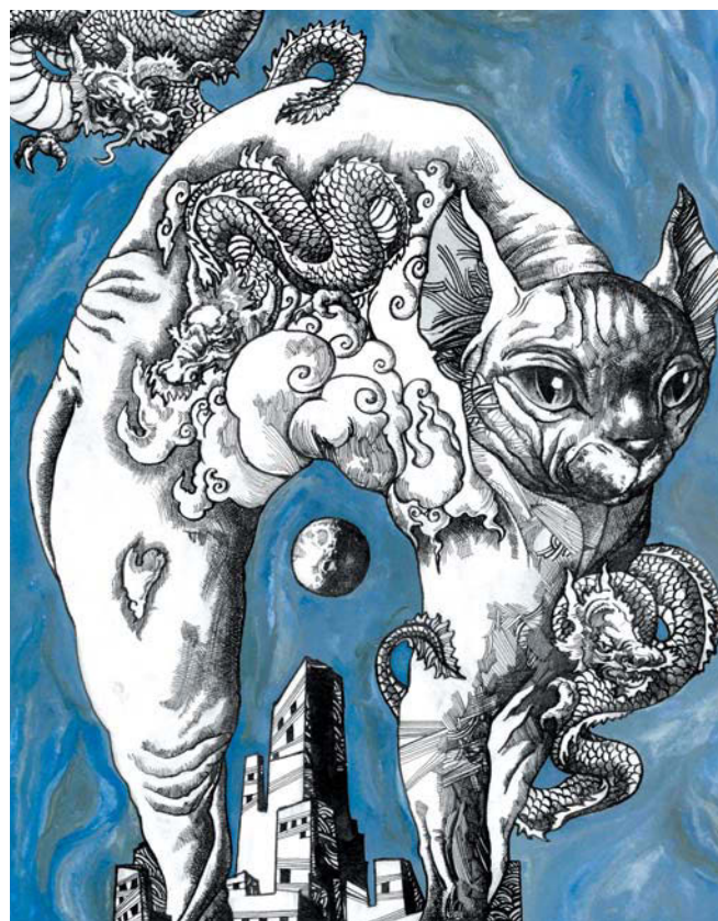
«Кот на высоте»