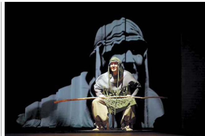
Сцена из спектакля «В чаще» (Якунтия)

– Я вообще очень люблю животных, – говорит Виктор. – Была бы моя воля, я бы завёл много кошек, собак, кролика и даже корову.