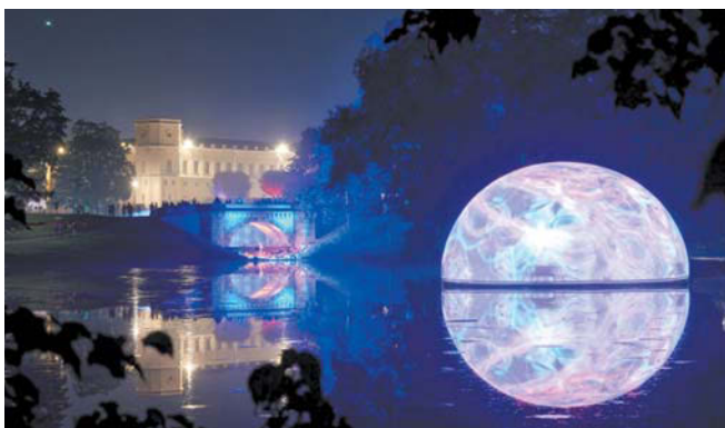
Тема фестиваля – взгляд в будущее