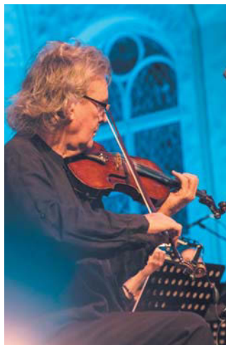
| ПРЕДОСТАВЛЕНО ОРГАНИЗАТОРАМИ

Под открытым небом обновлённого двора «Никольских рядов» – грандиозный музыкальный проект Ennio Morricone. Professional, в котором самая известная киномузыка великих итальянских композиторов Эннио Морриконе и Нино Рота соберётся на одной сцене 50 музыкантов и солистов.