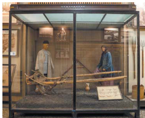
Праздничные наряды и повседневная одежда крестьян, по которым часто писал Толстой, также есть в музее

хозяйственный инвентарь – соху, борону, сеятели, а слышат: «...Старик слез с печи, обулся, надел шубу, шапку и пошёл на гумно. Когда бабы и девка пришли на гумно, ток был расчищен, деревянная лопата стояла воткнутой в белый сыпучий снег и рядом с нею метла прутьями вверх», – зачитывает экскурсовод.