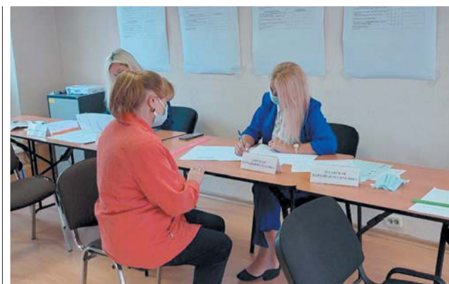
Жители новых регионов проголосовали в Петербурге

Посетителей также познакомят с интерьерами чайханы и дома грузинского князя. Экскурсии по произведениям Толстого, запущенные 1 сентября, вошли в постоянное расписание музея.