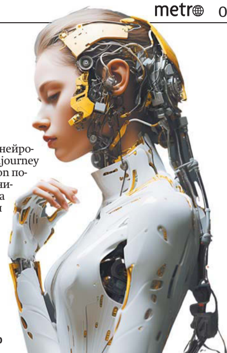
ЭТО ИЗОБРАЖЕНИЕ СДЕЛАНО НЕЙРОСЕТЬЮ