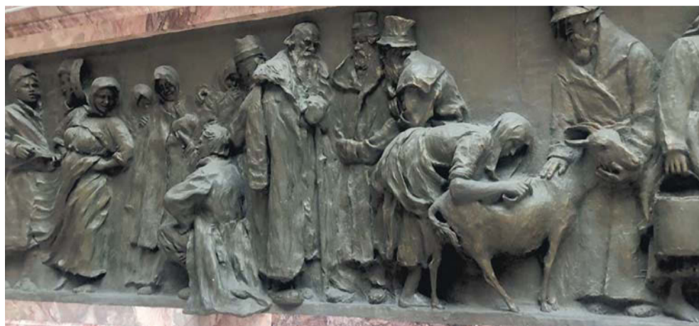
Тот самый горельеф, один из героев которого похож на Льва Толстого

«Хаджи-Мурат» и «Песни на деревне» легли в основу экскурсии. Просмотр экспонатов сопровождается чтением отрывков из этих произведений. Гости видят сельско-