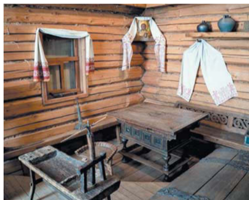
Посетителей знакомят с предметами русского быта, которые описывал Толстой в своих книгах