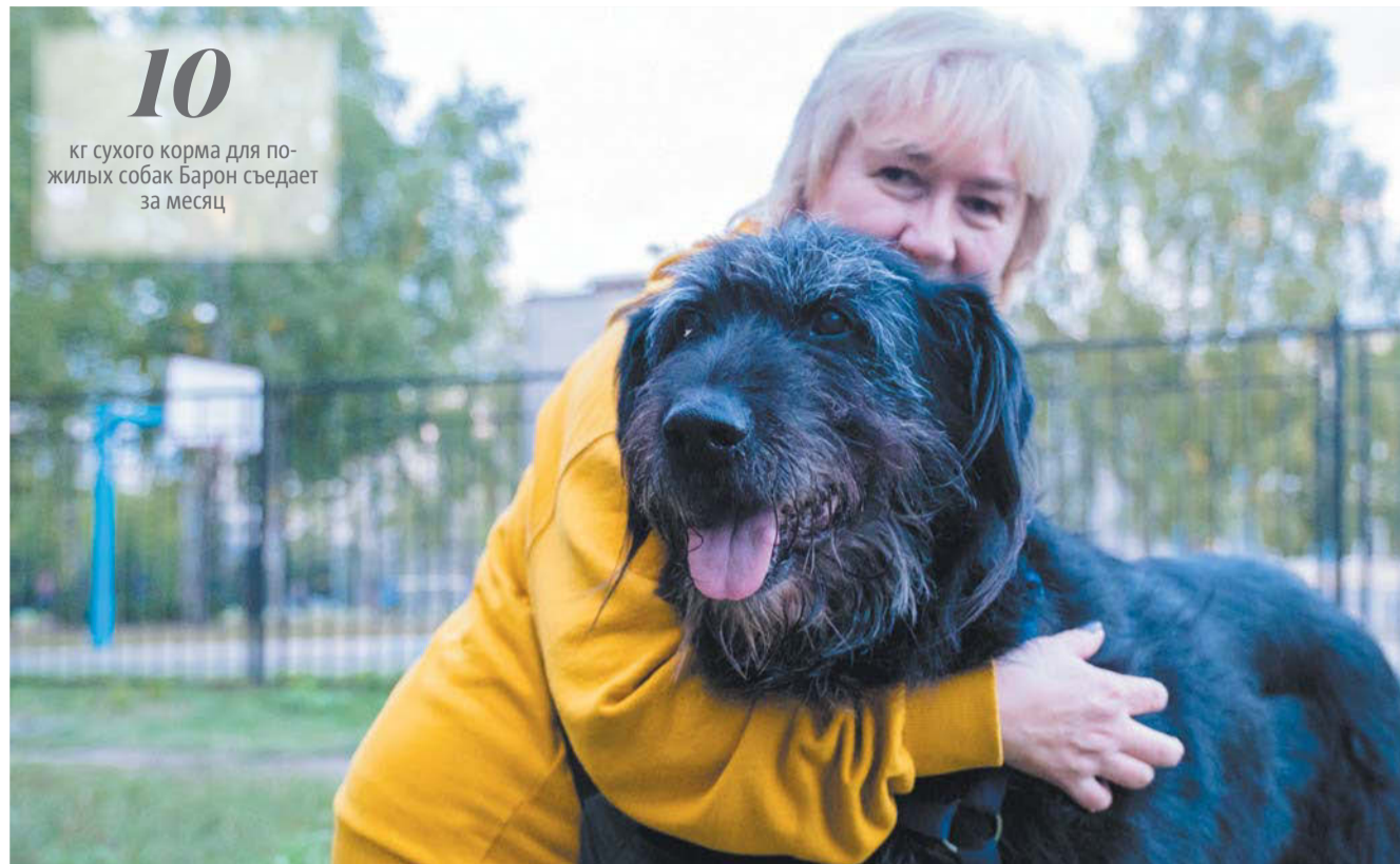
Барон и Людмила во время вечерней прогулки