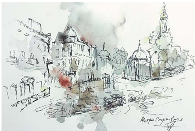
Одна из самых дорогих картин – «Метро «Спортивная»

– Выезды для них – это праздник. Они гуляют редко