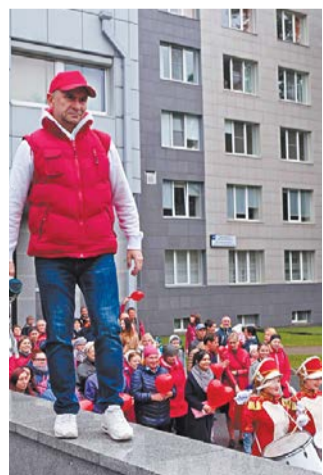
Организаторы просят горожан приходить в красной одежде

Во Всемирный день донора костного мозга, который отмечается 16 сентября, в Петербурге пройдёт благотворительная акция. В 14.30 состоится флешмоб «Бьющее сердце» под окнами детской онкологической больницы им. Р.М. Горбачёвой (ул. Рентгена, 12), на который соберутся неравнодушные люди, потенциальные и состоявшиеся доноры костного мозга.