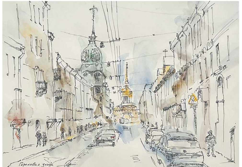
Стоимость полотен – от 25 до 90 прогулок

– Конечно, гулять с ними будут подготовленные соцработники и соцкураторы, – продолжает Евгения Соколовская. – Человек покупает картину и таким образом дарит другому человеку, который не может сам выйти из дома или покинуть стены психоневрологического