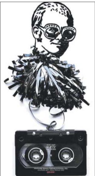
Элтон Джон в очках из его огромной коллекции