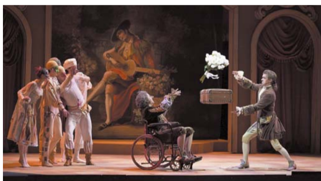
Опера «Дон Паскуале»