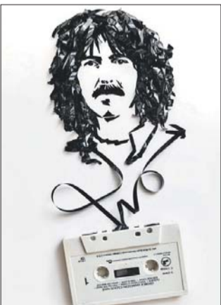
Джордж Харрисон – любимец Эми из битлов