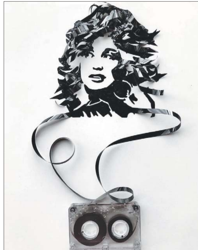
Над причёской Долли Партон художнице пришлось потрудиться

«Рисовать можно не только карандашом или красками. Иногда полезно выходить за пределы обычного. Меня однажды вдохновили аудиокассеты и их элементы – и я начала создавать портреты из этого непривычного материала».