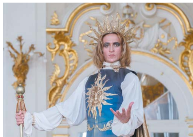
Фарух Рузиматов в костюме для моноспектакля «Король танцует»