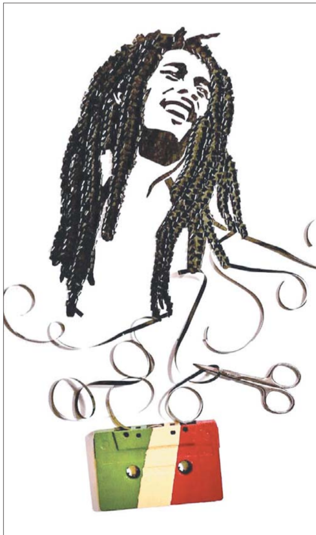
Жизнерадостный Боб Марли