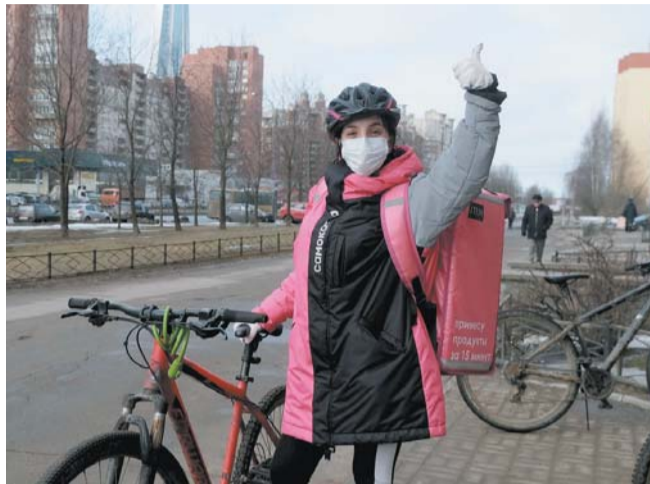
Курьер – самая популярная вакансия для студентов

– Это классный вариант, – призналась она Metro. – Нет ежедневной занятости, платят за каждый выход, а график можно подстраивать под расписание в универе. Хорошая, творческая работа, где можно импровизировать и нет необходимости постоянно напрягать «воспалённые» мозги.