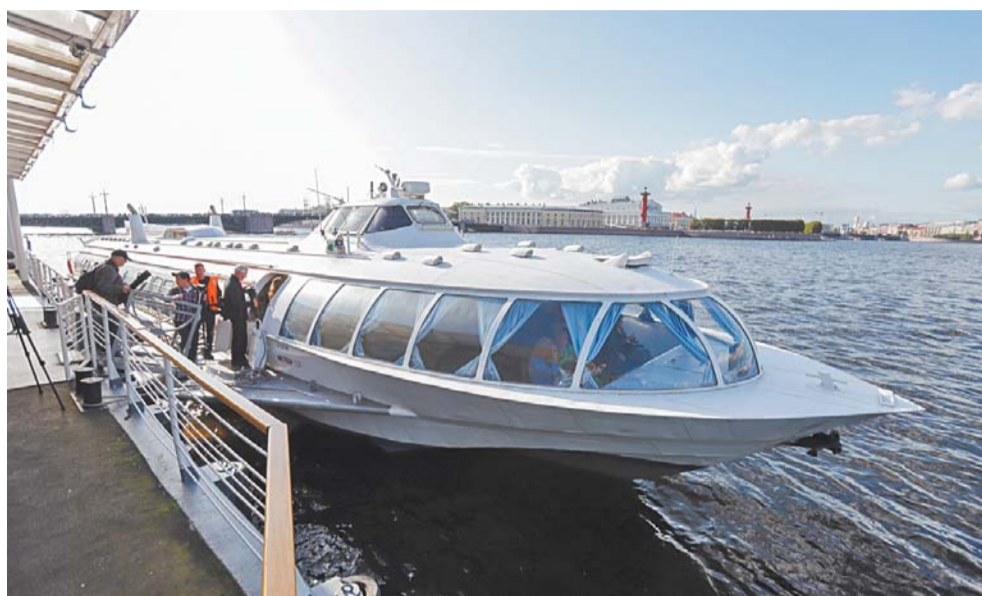
Маршрут тестовый. О его возможном расширении пока говорят осторожно | ИГОРЬ АКИМОВ

– Это социальный проект, направленный на то, чтобы горожанам было удобно добираться до работы. Утренние рейсы стартуют от Речного вокзала, где находятся густонаселённые районы Петербурга и существует проблема с транспортом, там нет метро в шаговой доступности, – рассказали представители компании «ВодоходЪ».