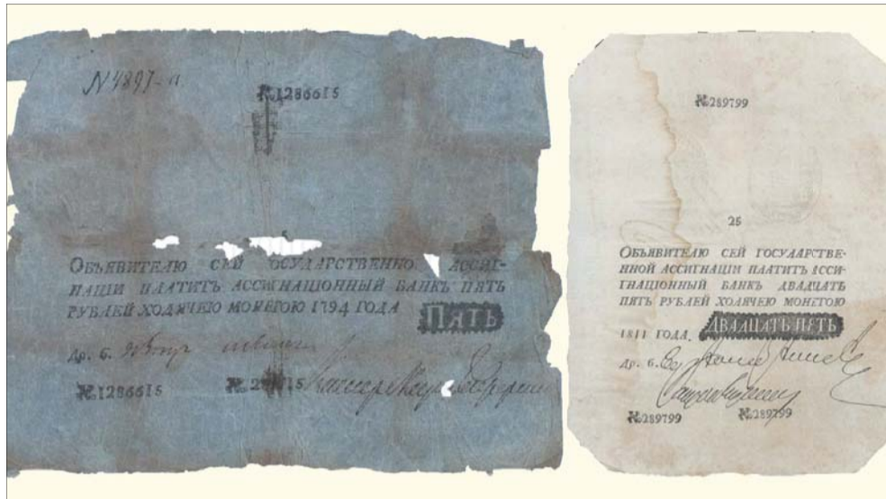
Слева – настоящая ассигнация, справа – фальшивка. Отличить оригинал от левака можно по печаткам: «государственная» и «ходячая»

В сентябре отмечается 211-я годовщина Бородинского сражения. При Наполеоне в нашей стране бесчинствовали французские фальшивомонетчики. Репортёр Metro изучил «наполеоновку» – фальшивую ассигнацию Российской империи – под лупой в Музее Банка России