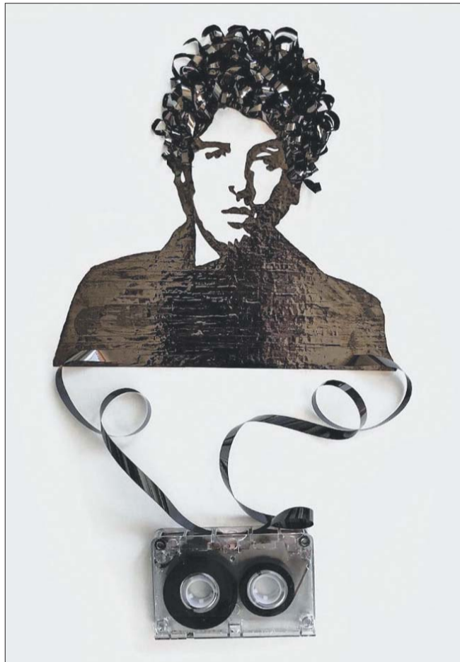
Молодой и романтичный Брюс Спрингстин