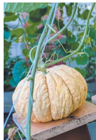
Дыня-гибрид «Необычайная» пахнет земляникой

Такого царского урожая в оранжереях заповедника не было с императорских времён.