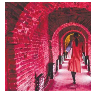
В рамках фестиваля горожане отправились на мастер-класс в мастерские Русского музея и увидели два эффектных аудиовизуальных представления: «Я – тень от чьей-то тени» и Михайловского замка и «Поток» в Петропавловской крепости