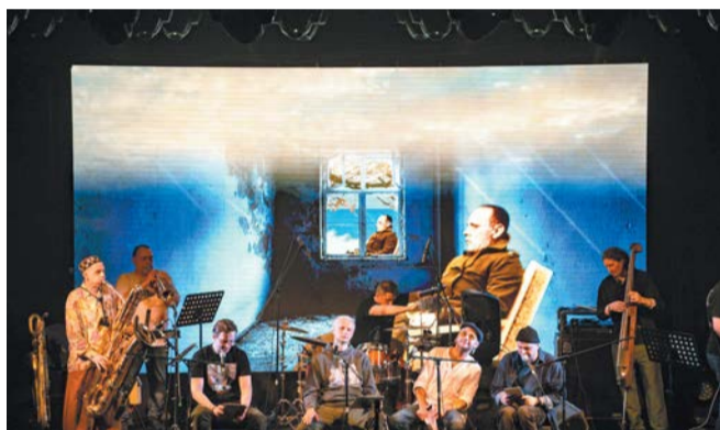
«Хармс.Doc Revival»