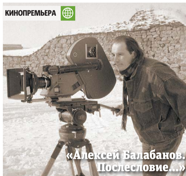
Фильм-посвящение вышел в прокат 6 октября

Всё очень по-простому – собраны архивные интервью с Алексеем Октябрьевичем: в старой квартире, на подоконнике в парадной. Балабанов говорит о любимом: о кино и людях. Документальные кадры перемежаются со вставками из всех его фильмов: как культовых, так и малоизвестных. На фоне играют песни Вячеслава Бутусова – хорошего друга режиссёра. Балабанов делится забавными случаями на съёмках, говорит, что никогда ничего не выдумывал для своего