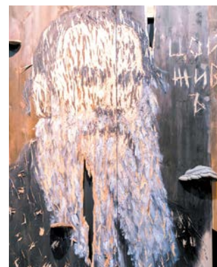
Лев Николаевич Толстой – панк начала XX века