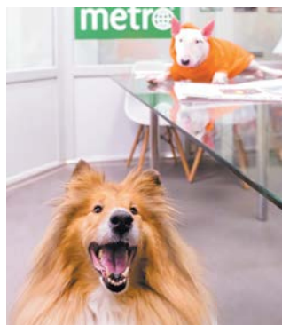
Колли Лотти и бультерьер Гера

Пока бультерьер Гера следила за процессом вёрстки и фотографировалась, колли Лотти морально поддерживала подругу и тоже пыталась попасть в кадр.