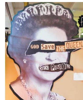
«Боже, храни королеву!» – один из самых известных синглов Sex Pistols

«Панк – тоже культура, кусочек большого лоскутного одеяла».