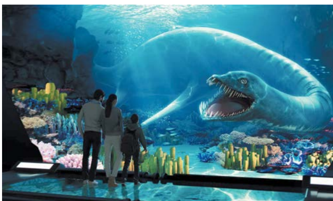
«Океан юрского периода»