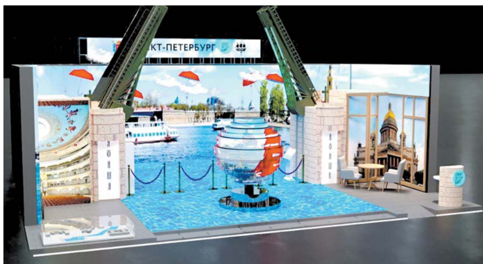
Стенд Петербурга позволит виртуально погулять по всему городу

В павильоне Петербурга идут последние приготовления. Гостей встречает большой макет разведённого Дворцового моста – одного из самых узнаваемых символов города. Сам павильон представляет собой панорамное мультимедийное пространство, заполненное от пола до потолка экранами. Зритель переносится то в зимний Петербург и ходит по замёрзшему льду Невы, то в Летний сад и шуршит осенними листьями. «Голосами» петербургско-