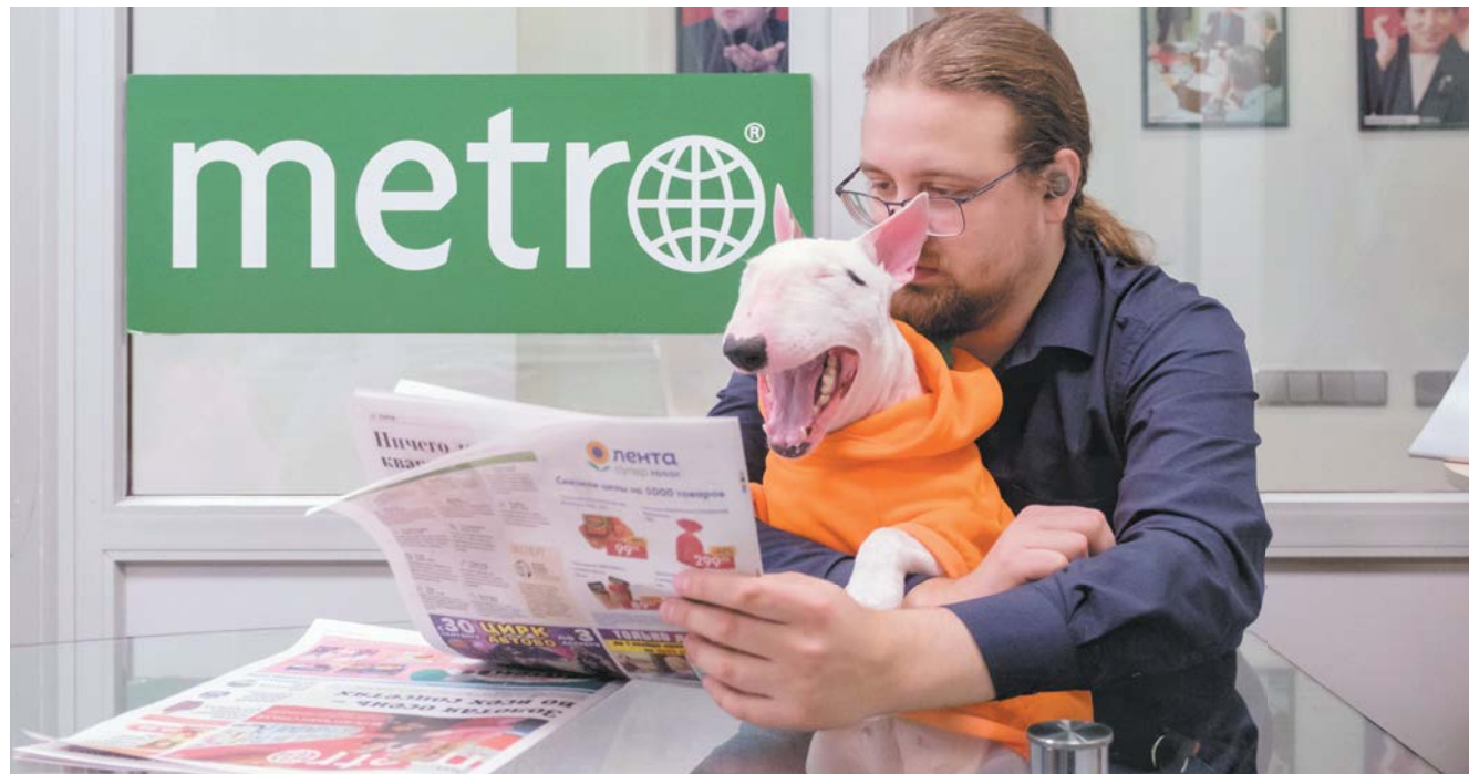
Бультерьеру Гере в редакции Metro явно понравилось. Она обещала придти к нам почаше