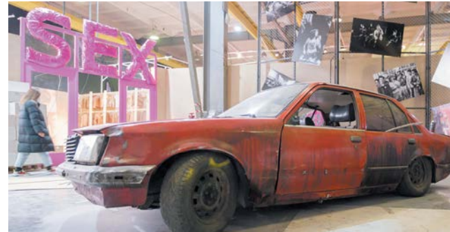
На машину можно будет забраться и устроить фотосессию

Один из ресторанов Петербурга разработал специальное меню для панк-столовой. Посетители могут попробовать первое блюдо «Будь как дома, супчик», съездь бутерброд «Вам тунец» или десерт «Мёд в рот».