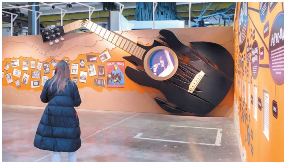
Авторы проекта предупреждают, что на выставке будет много текстов

ДОРОГО ПРИНИМАЕМ СТАРОЕ СЕРЕБРО ДО 7 НОЯБРЯ Роскошь ЗОЛОТА (812) 382-00-02