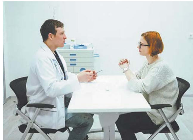
Симулированный пациент – нечто большее, чем просто актёр

ными пациентами становятся женщины. И они изображают самых разных людей, которых в любой день можно встретить в поликлинике: от девушек до мужчин-пенсионеров. Иногда возникает даже некоторая неловкость.