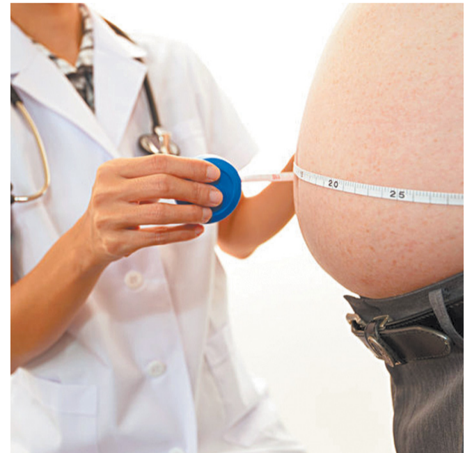
Контроль веса очень важен для профилактики диабета