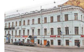
Литейный проспект, 36. Дом, где жил и работал Некрасов | МЕТРО

Район: Центральный Тип дома: старый фонд, время постройки – 1781–1782 гг. Количество комнат: 12 Цена: от 80 млн руб. Общая площадь: 716 кв. м Метро: «Владимирская», «Маяковская», «Чернышевская» Расстояние до метро: 15 минут Этаж: 2-й из 3 Балкон: есть Лифт: отсутствует Виды из окна: на Литейный проспект и во двор Инфраструктура: в шаговой доступности находятся продуктовые магазины, салон красоты, рестораны Достопримечательности: дом Мурузи, Спасо-Преображенский собор