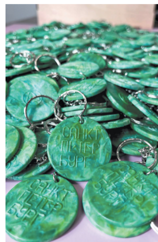
Такие брелоки сделают посетители выставки-форума «Россия»

– На выставку-форум мы привезли новую велодробилку. Изменили дизайн и учли недочёты прошлых конструкций: пластик стал лучше дробиться. Раньше