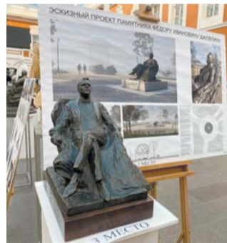
3-е место – скульптура работы Константина Гарапача