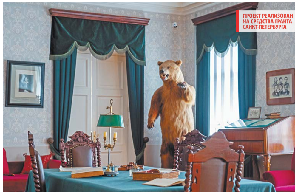
ПРОЕКТ РЕАЛИЗОВАН НА СРЕДСТВА ГРАНТА САНКТ-ПЕТЕРБУРГА

В кабинете – письменный стол на толстых резных ножках, изящная бронзовая чернильница, перья на под-