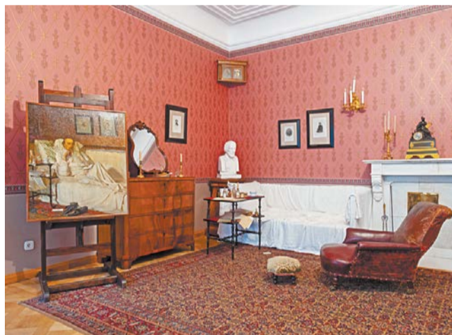
Спальня поэта. Здесь он отдыхал и писал стихи