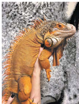
Игуана Рыжик работает только под присмотром хозяев

У владелицы домашнего экзотариума Ирины дома живут змеи, игуаны, вараны,