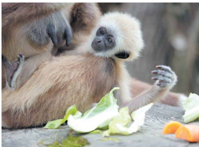
Для самца гиббонов выберут греческое имя | ЛЕНИНГРАДСКИЙ ЗООПАРК