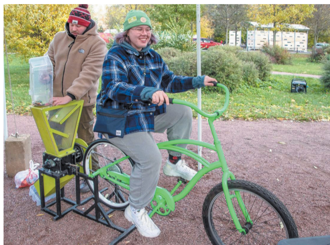
Новая версия велодробилки отличается не только стильным дизайном, но и высокой производительностью

– 16–17 ноября при поддержке Комитета по природопользованию Санкт-Петербурга пройдут мастер-классы по изготовлению брелоков с логотипом нашего города и значков с надписью «Действуй экологично», – рассказывает жур-