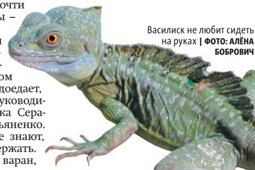
Василиск не любит сидеть на руках

– Чтобы этого не произошло, не надо делать таких сюрпризов, – говорит Серафим. – А если покупаете ящерицу себе, необходимо изучить вопрос её содержания и питания. Самые неприхотливые – бородатые агамы, они всеядны, им просто нужен просторный террариум. Василиски едят живых сверчков. Самые сложные в содержании – игуаны. Они вегетарианцы, круглый год должны питаться свежей травой. А кроме этого им необходимы особое освещение, обогрев и бассейн.