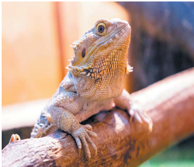
Бородатая агама из зоопарка «Элафион» иногда участвует в фотосессиях с посетителями

Сегодня в 19.00 в Академической капелле состоится показ литературно-музыкального проекта «О чём говорят женщины». Русский мир героинь Островского». Событие приурочено к 200-летию со дня рождения русского драматурга, которое отмечается в этом году. Купчихи, мамочки, бесприданницы, сказочные существа – зрители увидят самые популярные женские образы из произведений Островского. Их исполнят артистки ведущих петербургских театров. Оригинальности представлению добавит музыкальная часть. На сцене выступит симфонический оркестр Санкт-Петербургского музыкального театра им. Ф.И. Шалыпина «Северная Симфония». В зале прозвучат сцены из знаменитых опер Чайковского, Римского-Корсакова, Френкеля.