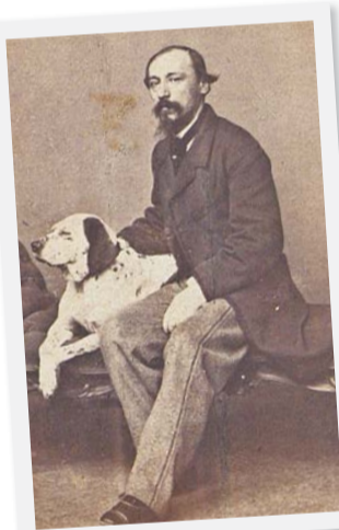
Некрасов с любимой собакой.

ставке, тяжёлый каменный пресс, изображающий собаку. На полу лежала тигровая шкура, обшитая красным сукном.