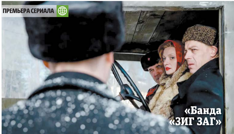
«Банда «ЗИГ ЗАГ»»

«Банда «ЗИГ ЗАГ» – масштабный проект о малоизвестной странице истории блокадного Ленинграда | KION