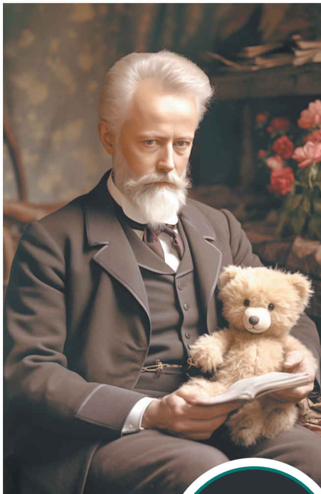
Классический мишка Петра Чайковского