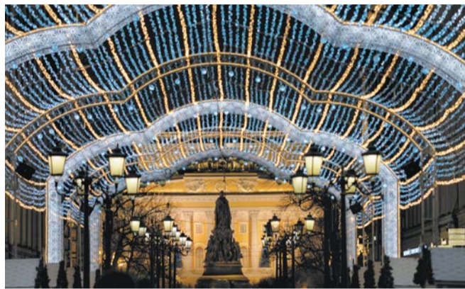
Новогоднее оформление Петербурга | АЛЁНА БОБРОВИЧ

ТЕКСТ: АЛЁНА БОБРОВИЧ, ФОТО: АЛЁНА БОБРОВИЧ, ПРЕДОСТАВЛЕНЫ ГЕРОЯМИ ПУБЛИКАЦИИ