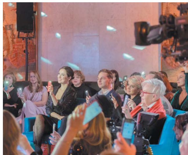
Зрители во время записи программы менялись каждые два часа