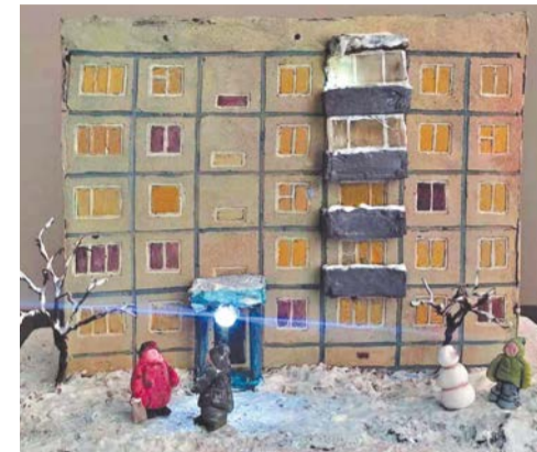
Тортик в виде «панельки»