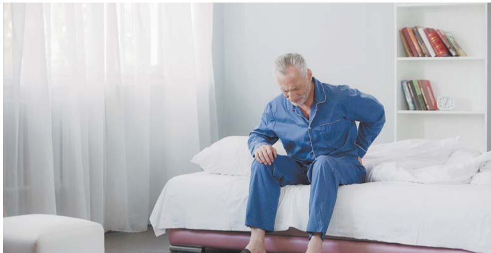
Самое главное – соблюдать режим сна

Медики утверждают, что привычка ложиться за полночь повышает риск развития деменции. Metro спросило у экспертов и выяснило, действительно ли недостаток сна грозит столь серьёзными осложнениями