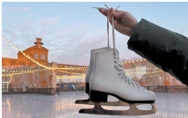
Впервые открылся каток в «Бруснице»