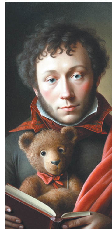
Кучерявый мишка Александра Пушкина