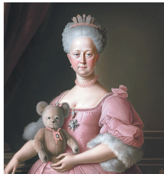
Мишка Екатерины II мог бы выглядеть так

Плюшевый мишка Владимира Маяковского получился «ярким и взъерошенным», как стихи поэта, пушкинский медведь – кудрявым, а игрушка Екатерины II – изысканной и благородной.