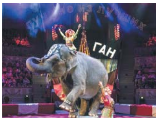
| ПРЕДСТАВЛЕНО ОРГАНИЗАТОРАМИ

с 22 декабря (0+) Цирк на Фонтанке представляет новогоднее представление. Гостей ждут номера от лучших артистов. «Маска» расскажет историю первого Нового года, а удивлять зрителя в программе будут канатоходцы, клоуны, тигры, попугаи, лошади и слон. Вместе они постараются создать новогоднее настроение в первом каменном цирке России.