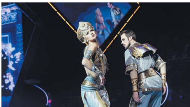
«История любви Шахерезады» | ПРЕДСТАВЛЕНО ОРГАНИЗАТОРАМИ