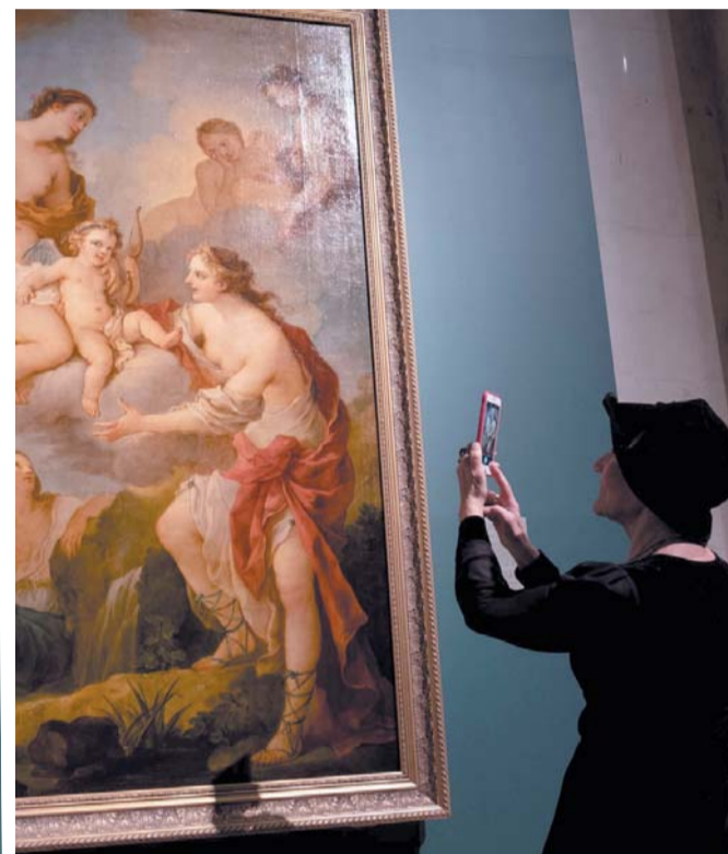
Выставка «Салоны» Дидро. Выставки современного искусства в Париже XVIII века

Эта выставка – совместный проект Государственного Эрмитажа и Пушкинского музея, где она проходила с июня по октябрь. А теперь петербургским зрителям предстоит узнать историю того, что сейчас кажется абсолютно естественной частью культурной жизни – выставки современного искусства, каталоги, художественная критика. В Париже XVIII века всё это зарождалось и развивалось. В Квадратном салоне Лувра сначала каждый год, потом – раз в два года представляли лучшее из созданного на тот момент.