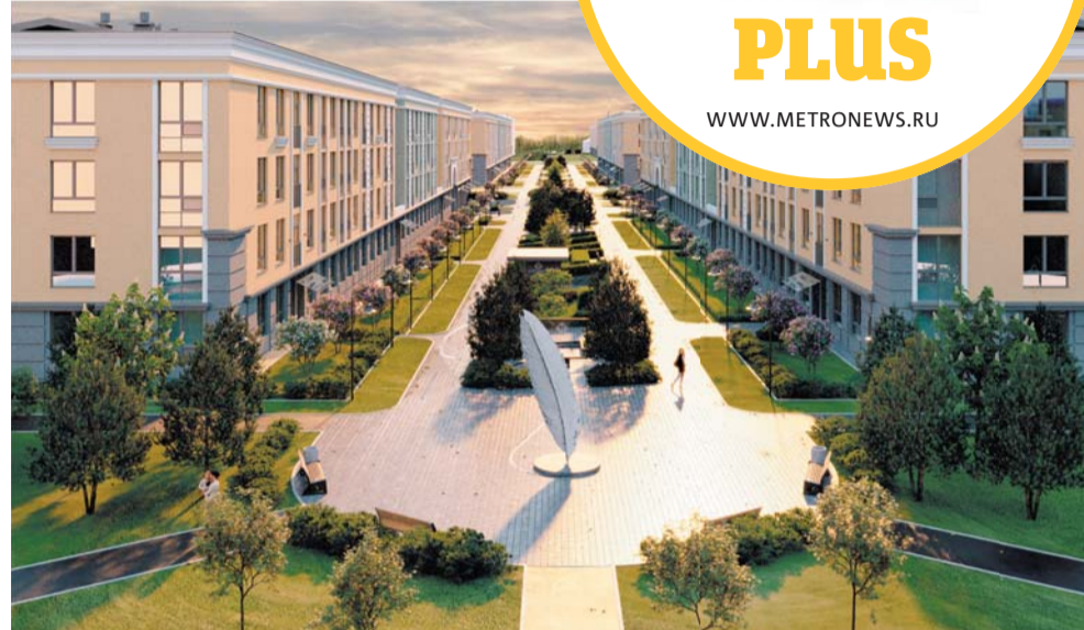
Застройщики в 2023 году выполнили все свои обязательства | ВСЕ ФОТО ПРЕДОСТАВЛЕНЫ КОМПАНИЕЙ «КВС»

– По сравнению с проектами 2–3-летней давности, сегодняшние новостройки – качественные, обеспеченные социальной и другой