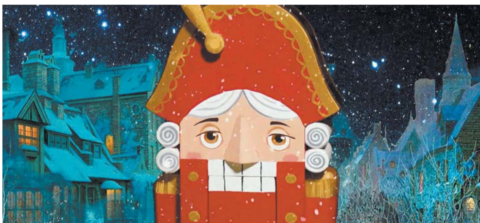
«Щелкунчик» | ТЕАТР БАЛЕТА ИМ. ЯКОБСОНА

Но для Николая Цискаридзе «Щелкунчик» – больше чем просто рождественская фантазия. Возглавив Академию русского балета имени А.Я. Вагановой, он первым делом переиздал книгу Агриппины Вагановой – чтобы напомнить о заветах основоположницы русского классического балета. Теперь выход в «Щелкунчике» станет сценической практикой для студентов Академии.