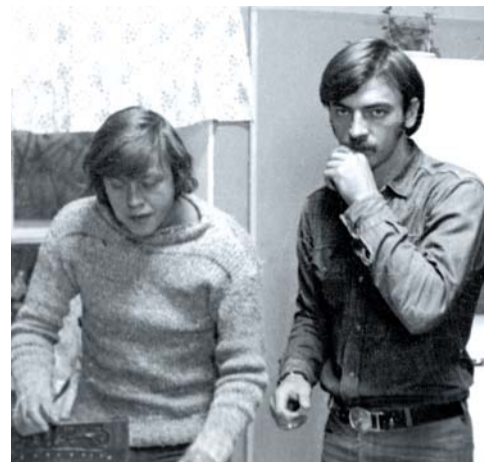
Николай Караченцов и Михаил Боярский на съёмках фильма «Старший сын»