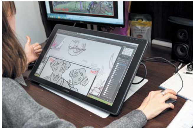
Вот так создаётся новый мультфильм про Ивана Царевича

За 25 лет самая крупная независимая студия России произвела 22 полнометражных фильма и 918 эпизодов сериала. Среди них франшизы о трёх богатырях и Иване Царевиче, «Барбоскины», «Лунтик» и многое другое. А ведущий режиссёр «Мельницы» Константин Бронзит дважды номинировался на «Оскар» за свои короткометражные работы.