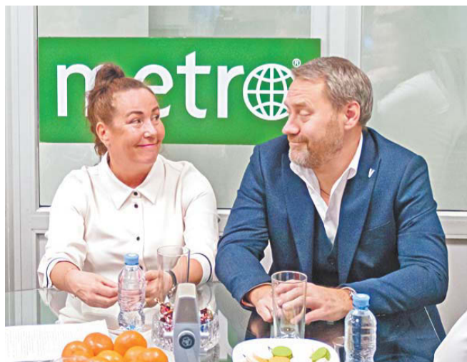
Бельские понимают друг друга с полуслова

ВБ: Дорогие, милые женщины, я от всей души поздравляю вас с этим замечательным праздником! А пожелать хочу от всего сердца, от всей души огромной любви. Любви от детей, любви вокруг, внутри себя. Чтобы вообще человека сопровождала только любовь. Только тогда женщина может быть счастлива. АБ: Виктория уже всё сказала. Поэтому я добавлю, что 8 Марта, в особый день, я хотел бы, чтобы у каждой женщины в нашем городе, в нашей стране, в мире сердце было наполнено весной, радостью, солнцем. Всё распускается, оживает, тает снег. Поэтому, конечно, в эти дни хотелось бы пожелать, чтобы в сердце всегда была весна, чтобы радовали близкие, чтобы всем достались подарки в это 8 Марта. И, конечно, чтобы в их сердце всегда жила любовь. С праздником!