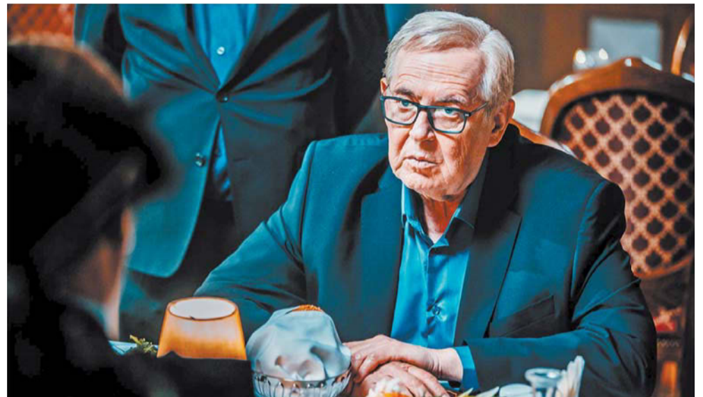
Кадр из сериала «Артист с большой дороги»

Нет, этого я не сделаю никогда. Я просто вам скажу, что он, конечно же, будет. Сейчас он на стадии написанного полностью сценария, а съёмки впереди. И не так далеко.