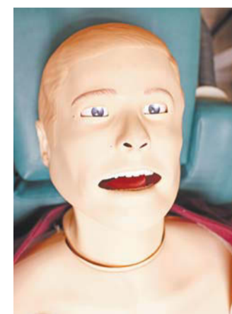
У манекена-тренажёра Семёна меняются зрачки, он может кашлять и стонать