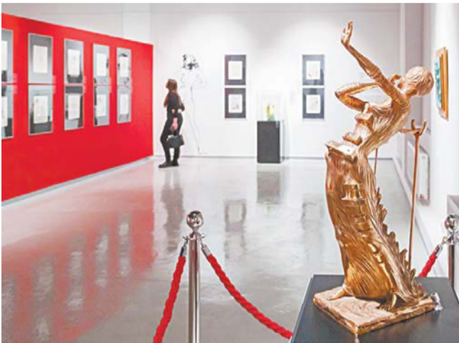
Скульптура «Женщина в огне»

Скульптуру «Венера» Дали дополнил подвижными ящиками. В каждом из них хранятся тайны