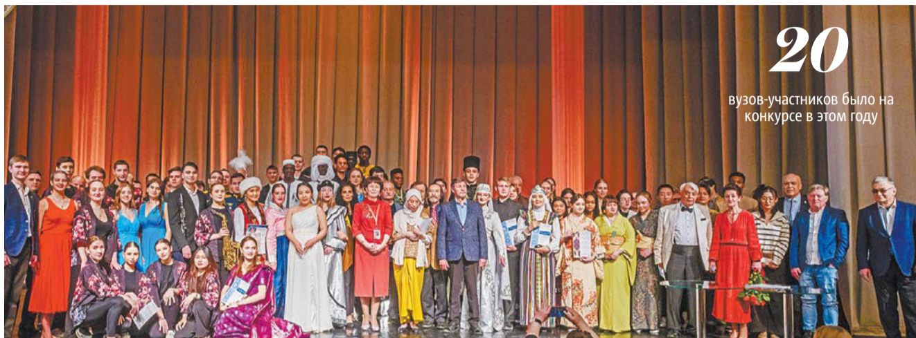
Более 100 студентов представили творческие номера на сцене ТКЗ им. А. Петрова СПБГУП