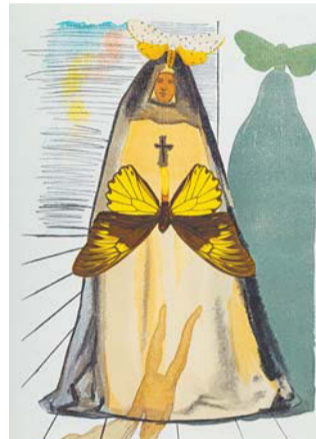
Сальвадор Дали. Из повести «Треуголка». Ксилография, 1958 год

ника в семье умер старший ребёнок. Сальвадора окружили заботой и обожанием, но у него тем не менее всегда было ощущение, что он – инкарнация умершего брата. Однажды отец оставил без присмотра учебник по венерическим заболеваниям. Увиденное впечатлило подростка и стало ассоциироваться с женщинами. Он боялся их. До встречи с Галой у него не было женщин. Именно ей удалось изменить жизнь Дали, сделать её более полной и яркой. Для Сальвадора Дали женщина