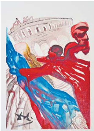
Сальвадор Дали. «No, o прекрасная Диона...». Из «Науки любви» Овидия. Ксилография, 1979 год