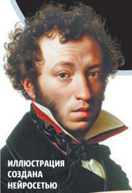
ИЛЛЮСТРАЦИЯ СОЗДАНА НЕЙРОСЕТЬЮ

Друзья, в этом году Россия будет отмечать 225-летие со дня рождения Александра Пушкина. Напишите свои любимые строки, принадлежащие его перу (не более 70 знаков), и пришлите нам на адрес: konkurs@metronews.ru с пометкой «Ай да Пушкин!».