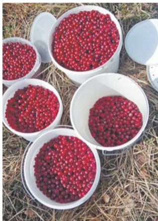
Петербуржцы открыли ягодный сезон сбором весенней клюквы

Как говорят специалисты, весенняя клюква ничуть не теряет своей свежести и полезных свойств благодаря содержащейся в ней бензойной кислоте – природному консерванту. В перезимовавшей под снегом ягоде много витаминов, в первую очередь витамина С. Знайки советуют ходить на верховые болота, которые расположены более высоко и не такие топкие. Они есть в Выборгском,