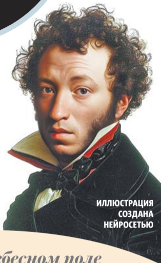
ИЛЛЮСТРАЦИЯ СОЗДАНА НЕЙРОСЕТЬЮ

Друзья, в этом году Россия будет отмечать 225-летие со дня рождения Александра Пушкина. Напишите свои любимые строки, принадлежащие его перу (не более 70 знаков), и пришлите нам на адрес: konkurs@metronews.ru с пометкой «Ай да Пушкин!».