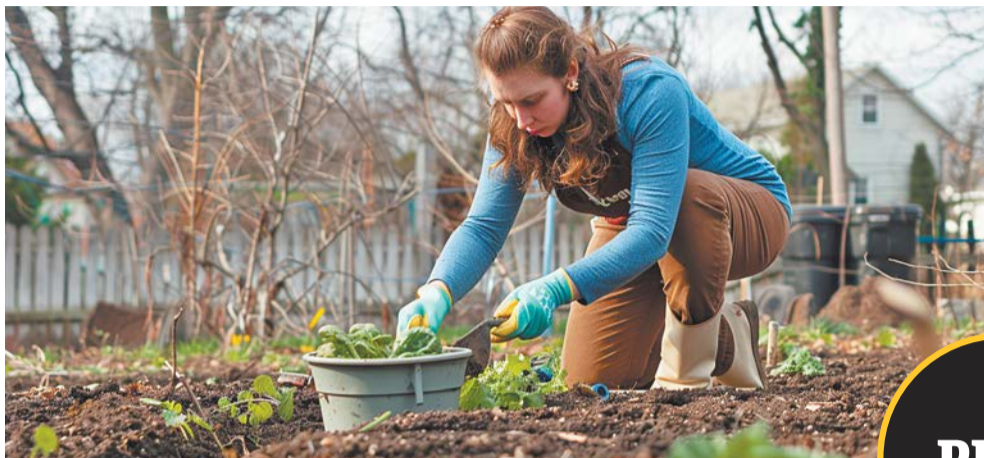
Займитесь подготовкой почвы к посадкам – внесите удобрения, прорыхлите, промульчируйте | КОНСТАНТИН ЛЕБЕДИН

Специалисты советуют использовать органические удобрения. Во-первых, они более натуральные и безопасные, во-вторых, обеспечивают растения полным набором необходимых питательных элементов. Не стоит бояться использовать натуральные готовые мага-