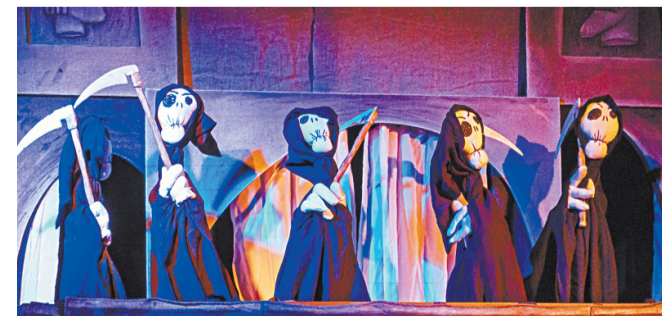
Смерть – один из основных персонажей спектакля. Но в спектакле её никто не боится

– Все знают, чем заканчивается история этой пары, но наш спектакль получился светлым и даже смешным, – считает актёр. – Вроде бы трагедия, но при этом в петрушках. На самом деле, главный персонаж народного театра Петрушка тоже побеждает смерть. И наши влюблённые Ромео и Джульетта её победили.