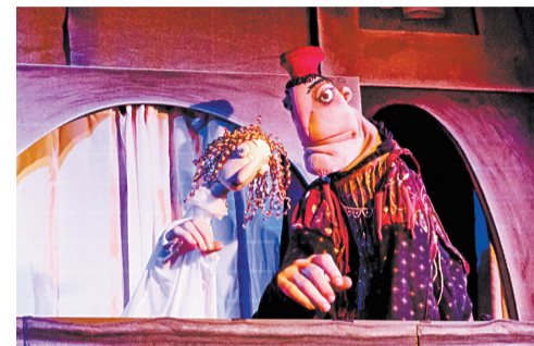
Ромео и Джульетта договариваются о тайном венчании с братом Лоренцо; кормилица – один из самых добрых персонажей спектакля; персонажи Джульетты и сеньора Капулетти сделаны в разных техниках: она – петрушка, он – мимирующая кукла