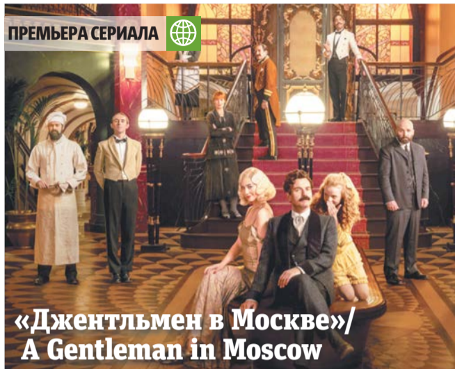
Граф Ростов (Юэн Макгрегор) не привык пасовать перед сложностями | PARAMOUNT+ (18+)

Каждую неделю мы рассказываем о самом интересном в мире ТВ