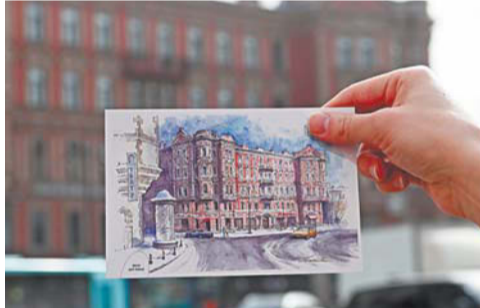
На каждой точке есть открытки с изображением одного из 12 зданий