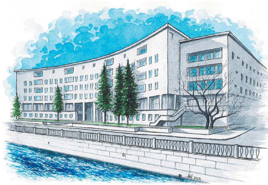
На память об экскурсии участникам останутся открытки, созданные руками петербургских художников | ПРЕДОСТАВЛЕНО ОРГАНИЗАТОРАМИ

Пятиэтажный дом построен в стиле эклектики. Лицевые фасады украшены наличниками и эркерами. Пешеходная экскурсия открывает не только здания, но и авторов.