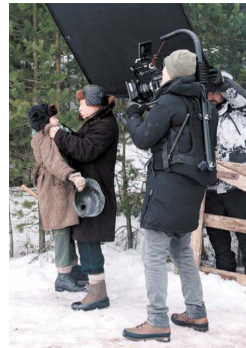
Большая часть фильма «Блокадный Трезорка» снимали на улице – в естественных декорациях