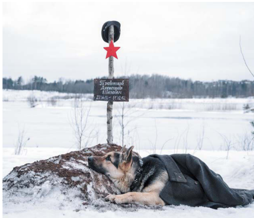
Пёс Фрам прекрасно справился с первой главной ролью