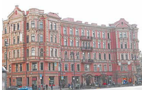
Доходный дом Корзинина был архитектурной доминантой на площади Льва Толстого | ИГОРЬ АКИМОВ