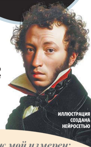
ИЛЛЮСТРАЦИЯ СОЗДАНА НЕЙРОСЕТЬЮ

Друзья, в этом году Россия будет отмечать 225-летие со дня рождения Александра Пушкина. Напишите свои любимые строки, принадлежащие его перу (не более 70 знаков), и пришлите нам на адрес: konkurs@metronews.ru с пометкой «Ай да Пушкин!».