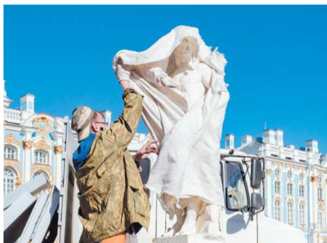
К концу недели в Царском Селе разденут все статуи