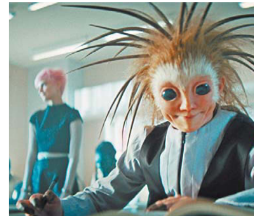
«Сто лет тому вперёд» (6+) выйдет в прокат 18 апреля