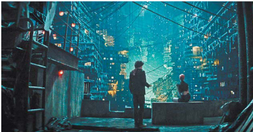
Футуристическая стилистика фильма во многом вдохновлена аниме

с ними в схватку, чтобы восстановить ход времени.