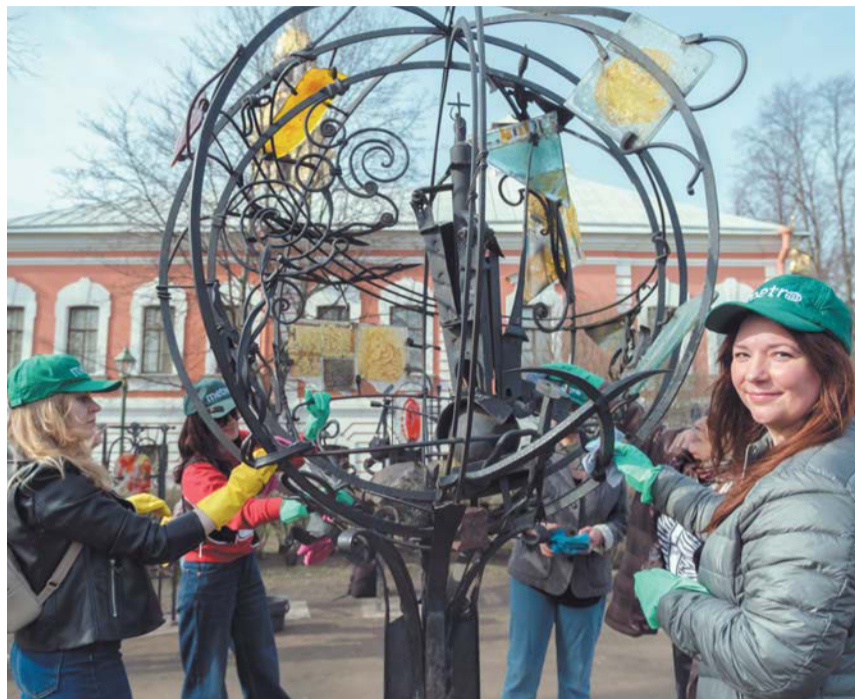
Нам понадобился час, чтобы помыть 12 стульев и дерево-глобус | ВСЕ ФОТО: АЛЁНА БОБРОВИЧ