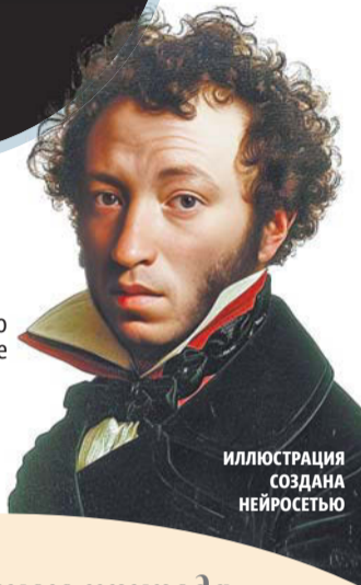
ИЛЛЮСТРАЦИЯ СОЗДАНА НЕЙРОСЕТЬЮ

Друзья, в этом году Россия будет отмечать 225-летие со дня рождения Александра Пушкина. Напишите свои любимые строки, принадлежащие его перу (не более 70 знаков), и пришлите нам на адрес: konkurs@metronews.ru с пометкой «Ай да Пушкин!».