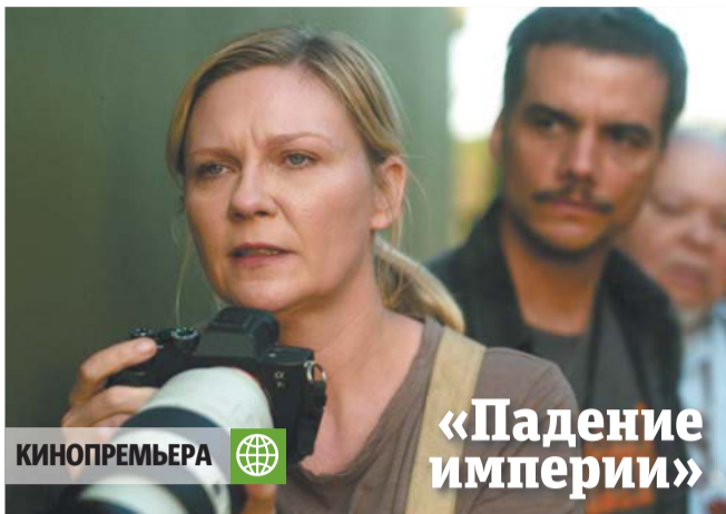
Кирстен Данст целится в фотосюжет

В кинотеатрах вышла картина «Падение империи» о новой гражданской войне в США