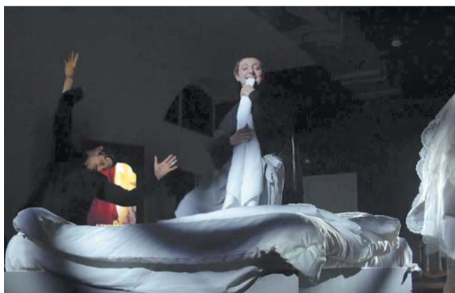
«Кроткая. Монтаж» | ТЮЗ ИМ. А.А. БРЯНЦЕВА

Спектакль поставлен в относительно небольшом пространстве Малой сцены, в котором, очевидно, не спрячешься ни за декорацией, ни за световой партитурой. Тем не менее всё же в декорации удалось создать образ спектакля – большой двухспальный диван. Для сюжета «Кроткой» эта вещь – ключевая по смыслу, потому что основной разлад в семье начинается (так у Достоевского)