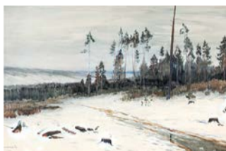
В.В. Переплётчиков, «Зима» | ГОСУДАРСТВЕННЫЙ РУССКИЙ МУЗЕЙ

было место и сатире. В акварелях Владимира Маковского «Деловой визит к коллекционеру», «В ложе» представлены яркие образы. Ещё один любимый жанр художников – портреты. Мастера стремились передать полноту внутреннего мира человека со всеми его