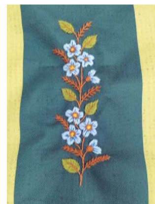
Незабудки, вышитые по образцам из альбомов издания 1942 года