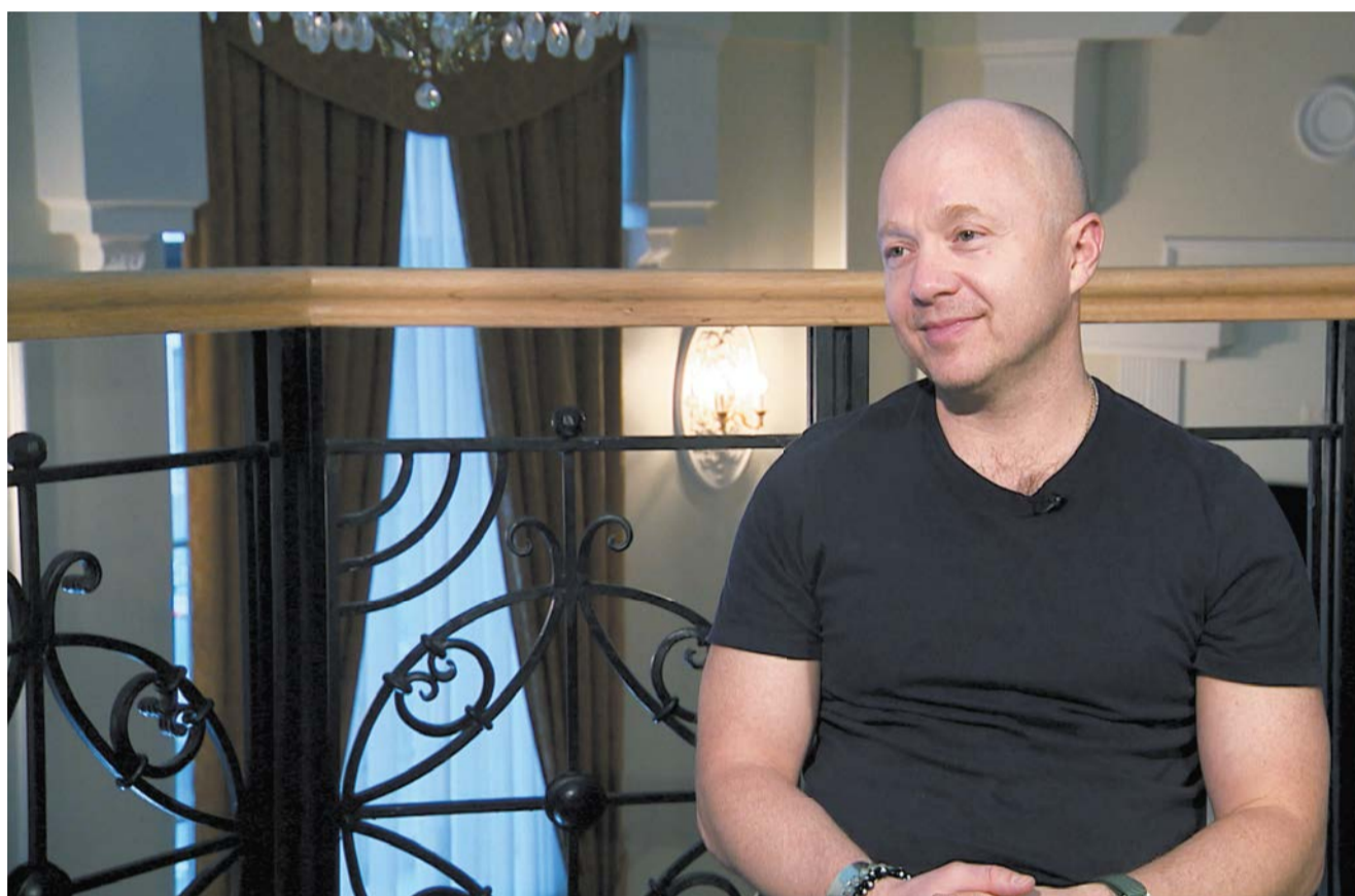
Евгений Стычкин

Да, мне ужасно жалко, что Евгения Стычкина на театральной сцене стало гораздо меньше. Из каких-то спектаклей я ушёл, какие-то закрылись по разным причинам. Я даже некоторое время назад звонил, писал Андрею Могучему, просил