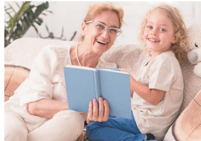
Учить ребёнка можно только на своём примере, считают эксперты. Сидишь в телефоне – жди аналогичной ситуации | DEPOSITPHOTOS