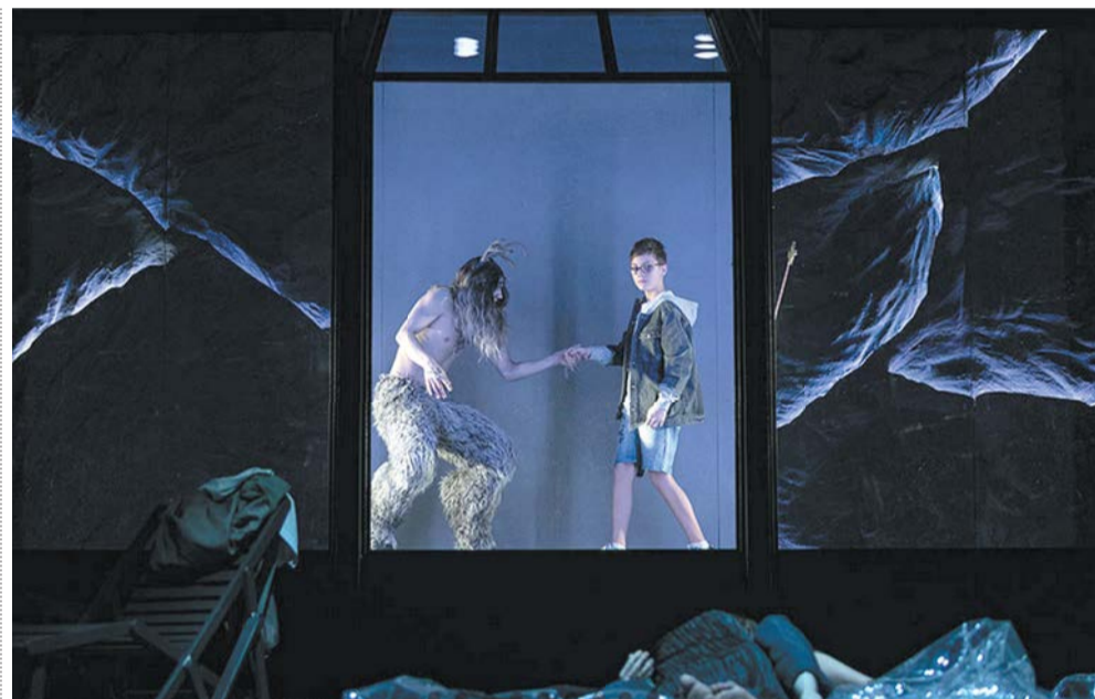
«Месяц в деревне» | ТЕАТР ИМ. В.Ф. КОМИССАРЖЕВСКОЙ

Действие спектакля динамично, экспрессивно, наполнено множеством дополнительных деталей. Актёры поют песни совсем из другого времени, произносят своеобразные стендапы. Кроме того, придуман ещё и параллельный видеоряд, в котором есть намёк и на дворы Петербурга, но главный его контрапункт действию – это кадры из фильма Ларса фон Триера «Рассекая волны».