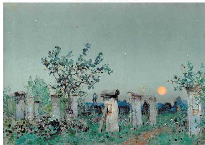
1) И.И. Левитан, «Пасека» 2) К.В. Лемох, «Девочка с корзинкой» | ГОСУДАРСТВЕННЫЙ РУССКИЙ МУЗЕЙ