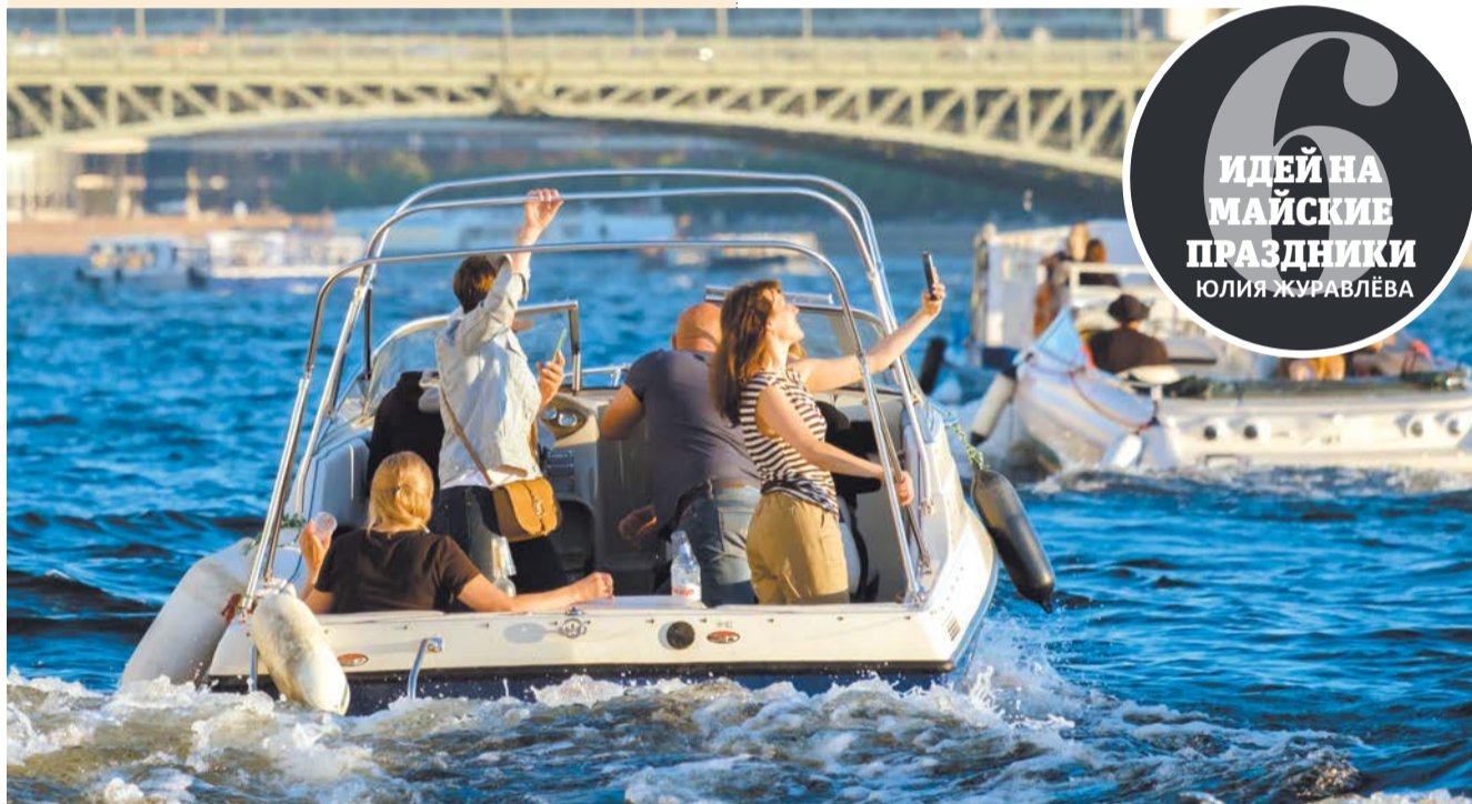
В Петербурге открыли сезон навигации

Крепость Орешек появилась в 1323 году по указу князя Юрия Даниловича, внука Александра Невского. С 1612 по 1702 год оборонительная локация принадлежала шведам. Три века назад крепость использовалась как политическая тюрьма. Первой узницей стала сестра Петра I Мария Алексеевна. Позже здесь отбывали срок известные декабристы. Проходили в крепости и казни – к примеру, в её стенах простился с жизнью брат Ленина Александр Ульянов. Добраться до исторической локация можно на теплоходе или метеоре.