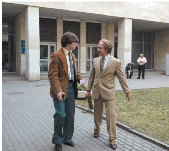
Евгений Стычкин (справа) в эпизодической роли в сериале «Игры» (18+)

Я не знаю. С одной стороны, всегда говорят: «Вот эти – они ничего не понимают. Вот мы...» С другой – скорость, с которой меняется мир, всё время в геометрической прогрессии растёт. Соответственно, вероятно, также растёт и разрыв, растояние в голове, в сердце, в душе между нами и следующим поколением. Не знаю, мне кажется, что это очень индивидуально. В том смысле, что есть счастливые родители. И я тешу