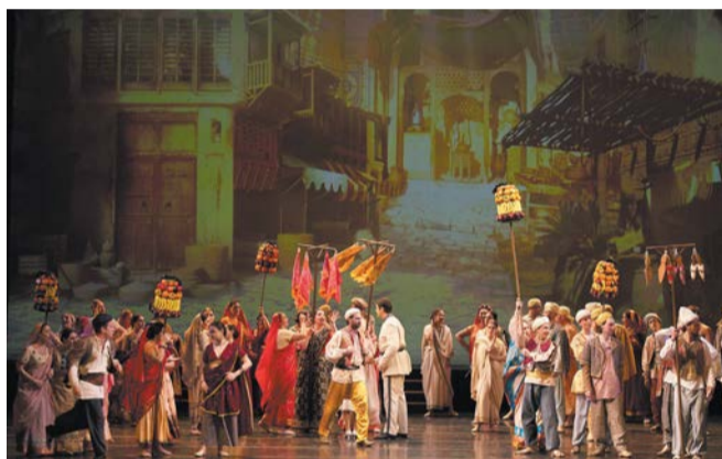
«Лакме» | ФОТО МИХАИЛА ВИЛЬЧУКА | МАРИИНСКИЙ ТЕАТР