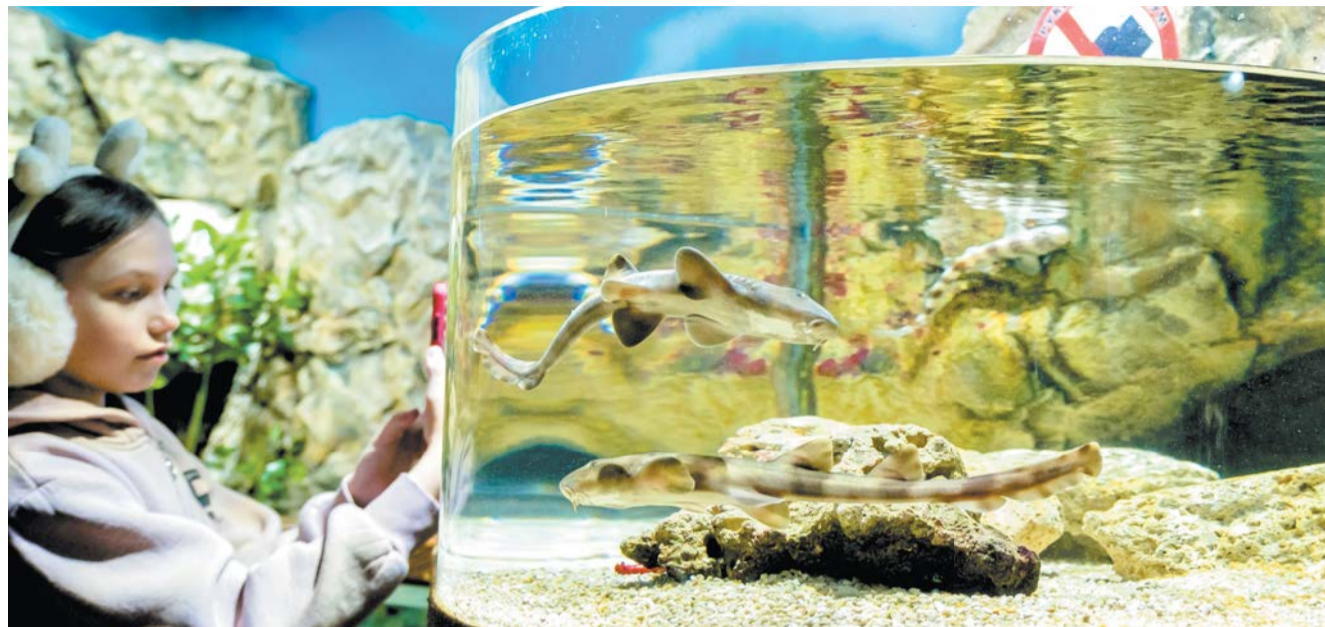
Спят детёныши акулы между кораллами, питаются по расписанию