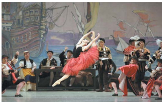
«Дон Кихот» | ФОТО НАТАШИ РАЗИНОЙ | МАРИИНСКИЙ ТЕАТР