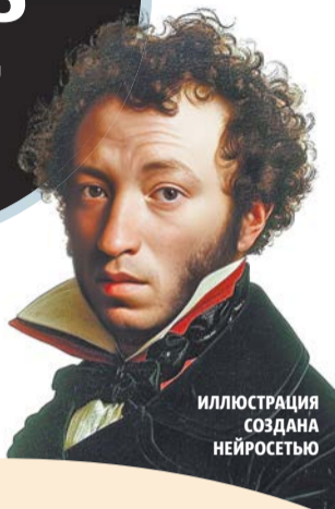
ИЛЛЮСТРАЦИЯ СОЗДАНА НЕЙРОСЕТЬЮ

Друзья, в этом году Россия отмечает 225-летие со дня рождения Александра Пушкина. Напишите свои любимые строки, принадлежащие его перу (не более 70 знаков), и пришлите нам на адрес: konkurs@metronews.ru с пометкой «Ай да Пушкин!».