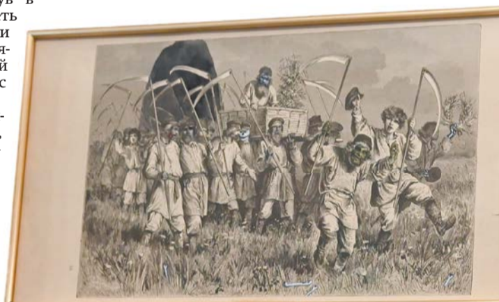
Художница дорисовала крестьянам лица мертвецов