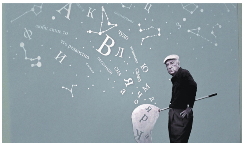
Петербургская художница увидела в Набокове ловца слов. Этот образ она воплотила в своей инсталляции