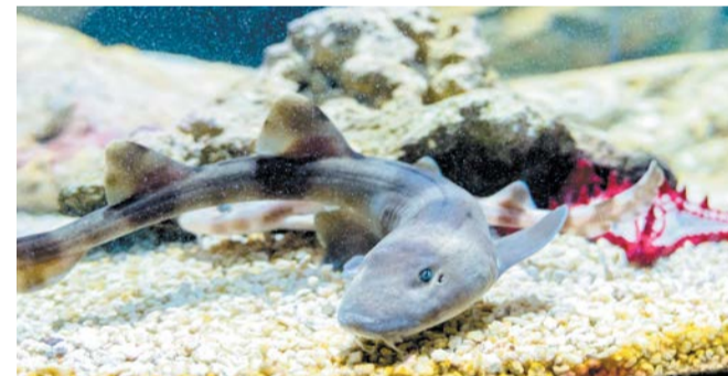
Этому малышу несколько недель

– Взрослым я даю корм в обычных рабочих перчатках, – говорит он. – Бывает, что во время шоу-кормления какая-нибудь особо голодная подопечная может цапнуть за палец. Ощущение от укуса – будто в кожу воткнули несколько очень тонких иголок. Это не больно и быстро заживает. Зубы у кошачьей акулы – как щётка: они очень маленькие, но их много.