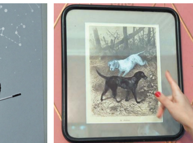
Новая гравюра в Музее Некрасова посвящена охотничьей собаке, которую жена поэта случайно застрелила

— Концепция инсталляции, игра света и тени, вообще присуща Набокову. Если вы откроете любой его рассказ — «Катастрофа», «Пильграм», «Совершенство», — везде присутствуют свет, тень. У него даже есть такой оксюморон, как «слепящая тьма». Он очень любил описывать, как тёмное про-