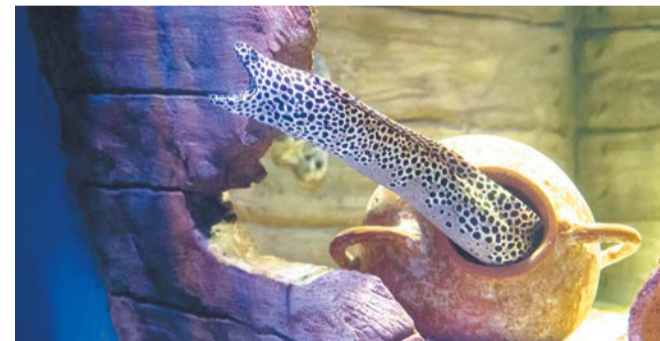
Муренам, как и акулам, тоже построили новое жильё. Теперь у каждой обитательницы аквариума есть своя квартира – кувшин-амфора