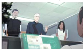
| ПРЕДСТАВЛЕНО ОРГАНИЗАТОРАМИ

Анимационный фильм – участник Каннского кинофестиваля. 2200 год, Марс. В центре сюжета два сыщика – Алин Руби и её напарник андроид Карлос Ривьера. По заданию состоятельного клиента детективы выслеживают студентку-хакера, создавшую код для снятия всех этических ограничений с роботов.