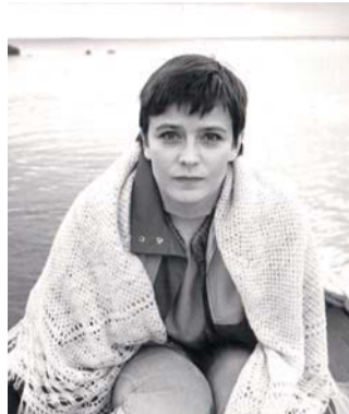
Елена Сафонова в фильме «Зимняя вишня» (1985, реж. Игорь Масленников)

фотографов, работавших на «Ленфильме», будут представлены в серии выставок