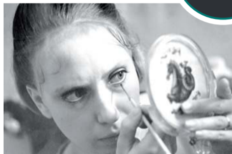
Инна Чурикова в роли Паши Строгановой в трагикомедии «Начало» (1970, реж. Глеб Панфилов)