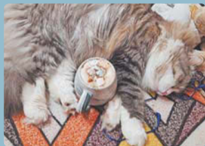
«Моя Чапа – это как целая эпоха Возрождения», – хозяйка Виолетта.