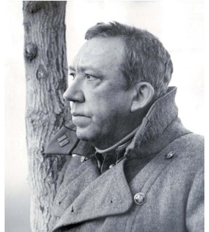
Юрий Никулин в роли военного журналиста Василия Лопатина в драме «Двадцать дней без войны» (1976, реж. Алексей Герман)