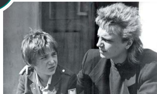
Музыкант Константин Кинчев на съёмочной площадке картины «Взломщик» (1987, реж. Валерий Огородников)