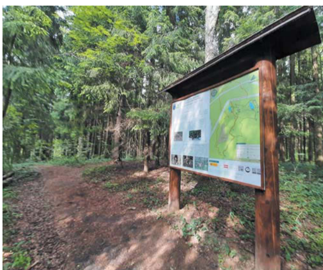
Заказник «Линдуловская роща» – один из самых популярных природных парков в Ленинградской области, туристический поток тут огромный

«Регулировать число посетителей важно для сохранения популяций птиц и животных в заказниках».