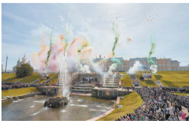
Праздник фонтанов