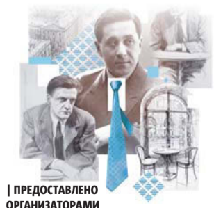
| ПРЕДОСТАВЛЕНО ОРГАНИЗАТОРАМИ

16 мая по 30 июня (6+) В Петербурге к 130-летию великого советского писателя пройдёт фестиваль «Такой Зошченко?!». Ключевым событием проекта станет открытие 16 мая в «Гостином Дворе» на втором этаже в пространстве Литературного музея «XX век» мультимедийной выставки, посвящённой жизни и творчеству литератора. В целом фестиваль будет включать творческие встречи, лекции и паблик-токи.