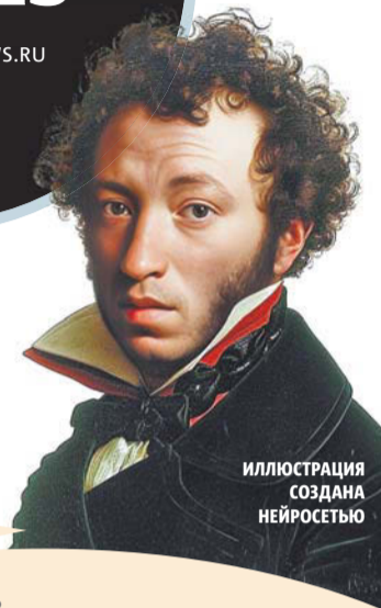
ИЛЛЮСТРАЦИЯ СОЗДАНА НЕЙРОСЕТЬЮ

Друзья, в этом году Россия отмечает 225-летие со дня рождения Александра Пушкина. Напишите свои любимые строки, принадлежащие его перу (не более 70 знаков), и пришлите нам на адрес: konkurs@metronews.ru с пометкой «Ай да Пушкин!».