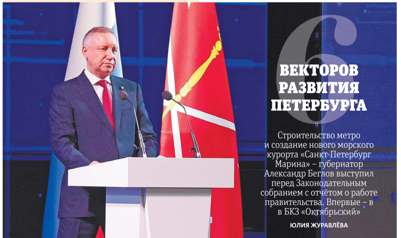
Губернатор отчитался о работе правительства Петербурга

Частично исторический парк открыт сейчас. Там работает музей, в котором находится атомная подводная лодка «Ленинский комсомол».