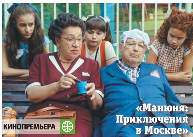
78-летний Евгений Петросян впервые сыграл в кино – в фильме «Манюня: Приключения в Москве»

На экраны вышло продолжение комедии про приключения подружек-пионерок Манюни, Маринэ и Каринэ, которые на сей раз оказались в Москве и встретили там Юрия Никулина