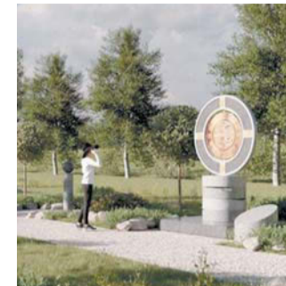
Скульптура в парке Кнорозова | СОЦСЕТИ КРАСНОГВАРДЕЙСКОГО РАЙОНА

Отсылкой к трудам учёного станут скульптуры «Солнце инков» и «Календарь майя». Обе фигуры разместят у входов: первую — с Новочеркасского проспекта, вторую — с противоположной стороны. А между ними — парад планет: разноцветные шары разного диаметра.