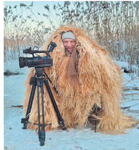
Ради удачных кадров приходится сидеть в засаде

«И вот он меня, значит, дубасит, а я пытаюсь установить камеру на треногу, выставить баланс белого».