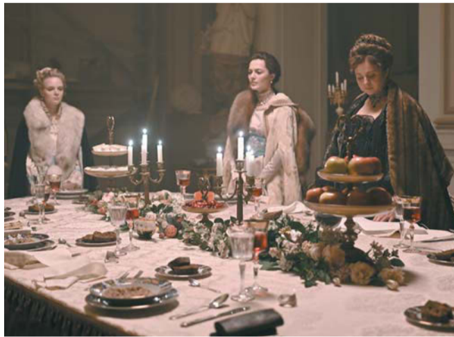
Драматичная сцена ужина императорской семьи

Находящийся на реставрации особняк барона Штиглица, расположенный на Английской набережной, идеально изображает Михайловский замок с его гнетущей атмосферой, куда переехал в последний год жизни Павел I вместе со своей семьёй. В обеденном зале на втором этаже царит полумрак, обстановка контрастирует с богато накрытым столом: накрахмаленные салфетки, белоснежная посуда и бутфорские яства в вазочках. Здесь будут снимать эмоциональную сцену, где Павел в кругу домашних начинает подозревать, что его еда отравлена.