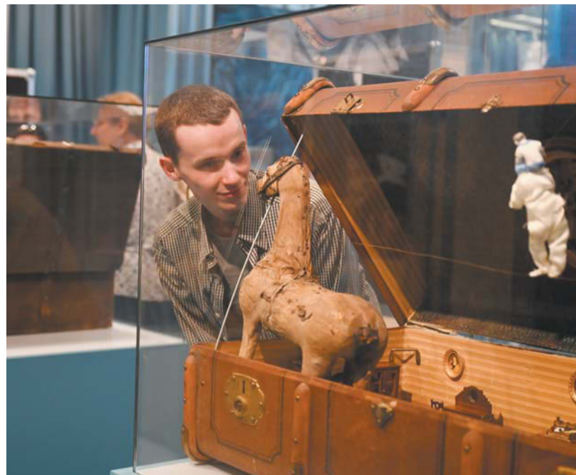
Чемодан слева с игрушкой-лошадкой XIX века символизирует мир Алексея Каренина, с женскими ногами справа – Алексея Вронского