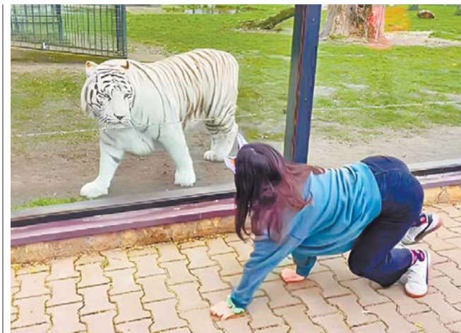
Девочка-квадробер показывает, как движется кошка