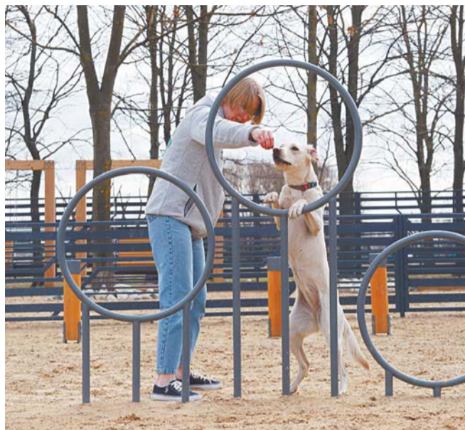
Петербуржцы смогут предлагать свои поправки в закон о содержании собак в течение двух месяцев – до 1 сентября 2024 года

место по количеству домашних собак занимает Петербург в России