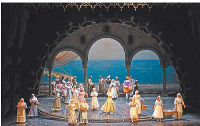
«Обручение в монастыре»