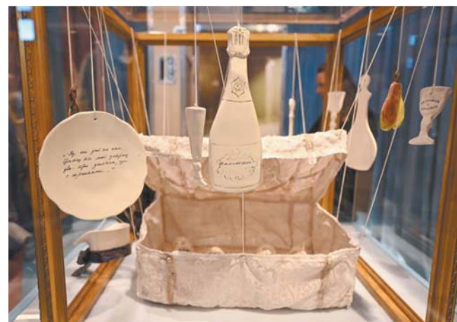
Графины и бокалы на ниточках передают хрупкость мира Стива и Долли, а железная конструкция – его нерушимость

Выставка «Тайны Карениной» на Витебском вокзале продлится до 30 сентября.