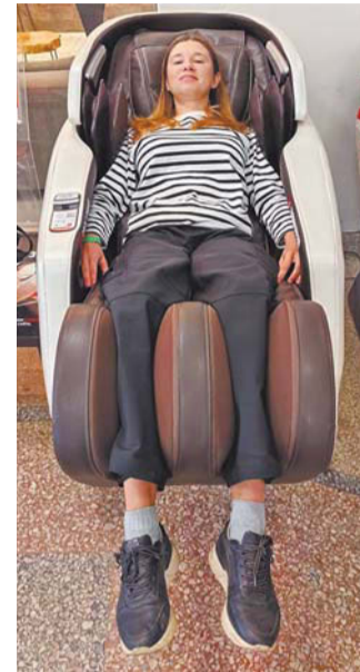
Цена услуги доступная – примерно 100 рублей за 10 минут

Что касается противопоказаний, то они те же, что и при обычном массаже: повышенная температура, высокое/низкое артериальное давление, сердечная недостаточность, варикозное расширение вен, новообразования на коже и в целом любое заболевание в острой форме.