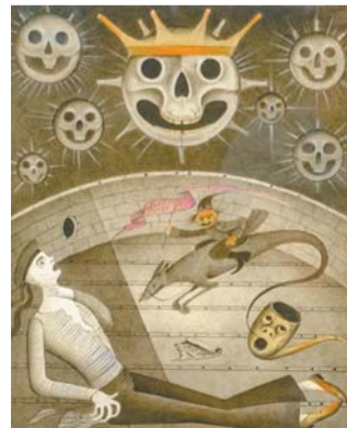
Иллюстрация к стихотворению «Спасите наши души»

– Шемякин показывал Высоцкому работу Рембрандта, на которой из-за туши быка