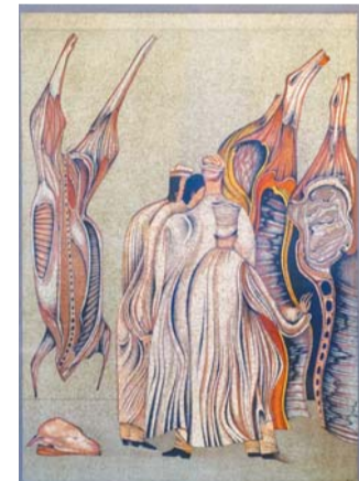
Литография из серии «Чрево Парижа»

– Впервые Михаил Михайлович продекламировал стихи, которые были посвя-