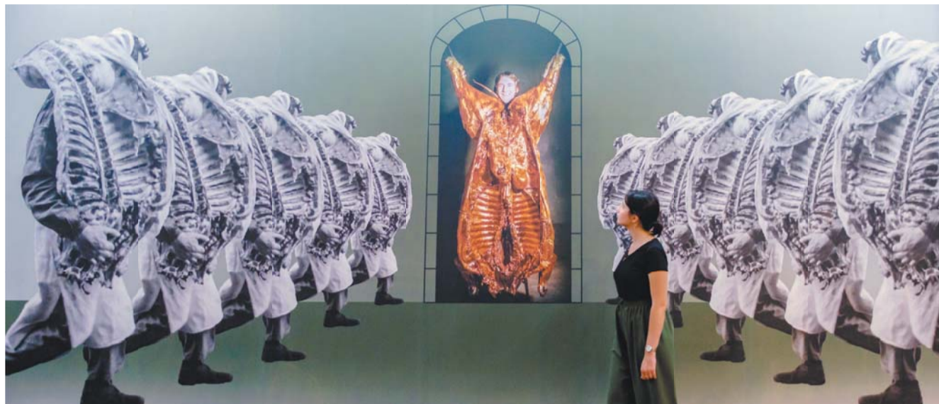
Коллаж, сделанный Михаилом Шемякиным для выставки