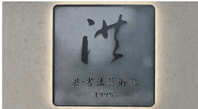
Выставку посвятили китайской каллиграфии

Русский музей познакомит петербуржцев с древней письменностью жителей Поднебесной: завтра, 31 июля, в Михайловском замке откроется выставка «Искусство китайской каллиграфии на Великом чайном пути: персональная выставка мастера Лю Хуншэна». На стендах посетителей ожидают свитки со старинными надписями. Это копии, сделанные современным китайским каллиграфом Лю Хуншэном. Он посвятил изучению этого направления более 40 лет. Также там есть материалы, где он разбирает стиль великих мастеров: Чжао Мэнфу, Янь Чжэньцин, Ван Сичжи и Ми Фу.