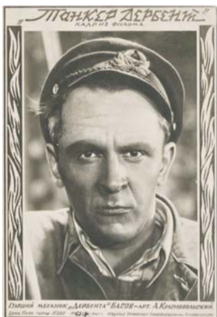
Открытка с кадром из фильма «Танкер «Дербент»

Здесь шла музыкальная комедия «Приключения Корзинкиной», приключенческие фильмы «Сокровища погибших кораблей» и «Танкер «Дербент» и многие другие.