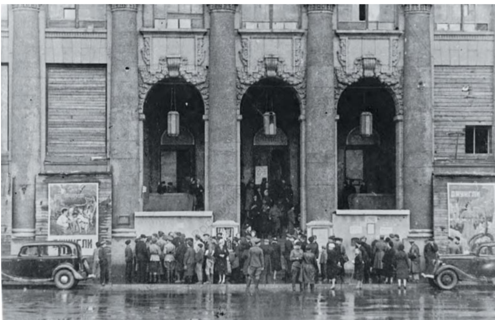
2 июня 1944 года. Люди идут в кинотеатр «Родина» на просмотр английского фильма «Джунгли». Так в советском прокате упростили название знаменитой картины «Книга джунглей Редьярда Киплинга». Влиятельный продюсер Александр Корда подарил этот фильм СССР в знак признательности советскому народу за борьбу с нацизмом