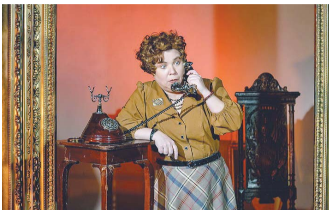
«И никаких но!..»