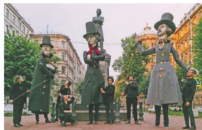
Классики русской литературы перед гастрольными прогулками по ночному Петербургу