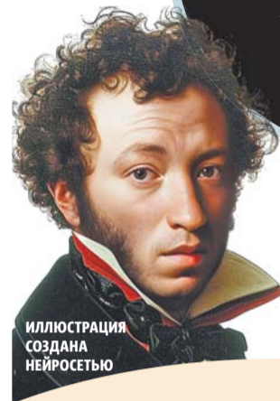
ИЛЛЮСТРАЦИЯ СОЗДАНА НЕЙРОСЕТЬЮ

Друзья, в этом году Россия будет отмечать 225-летие со дня рождения Александра Пушкина. Напишите свои любимые строки, принадлежащие его перу (не более 70 знаков), и пришлите нам на адрес: konkurs@metronews.ru с пометкой «Ай да Пушкин!».