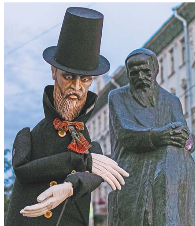
Великанец Достоевский рядом с памятником Фёдору Михайловичу на Владимирской площади