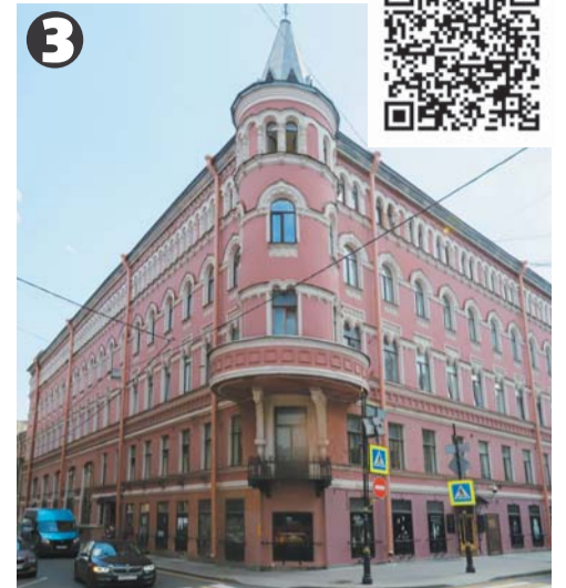
по QR-коду доступен аудиогид