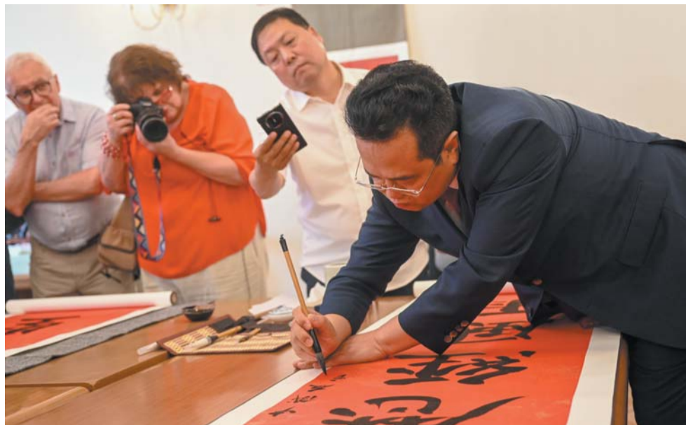
На открытии художник провёл мастер-класс по каллиграфии