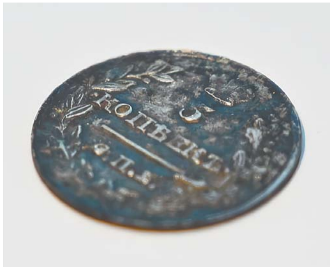
Старинная монета