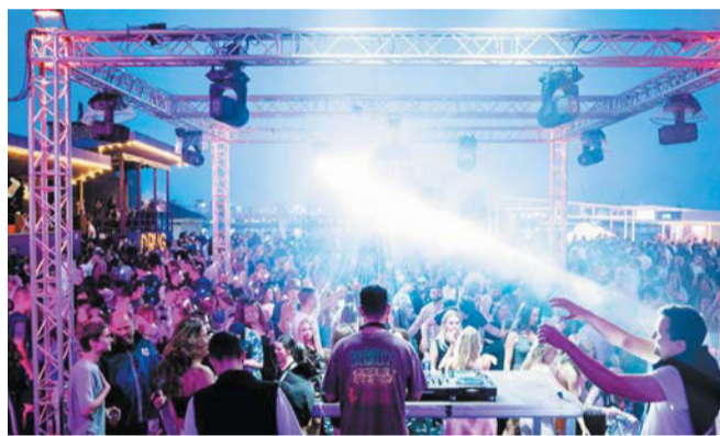
Вечеринка ÇAVA MTV HITS