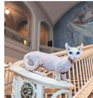
Пифия в Этнографическом музее