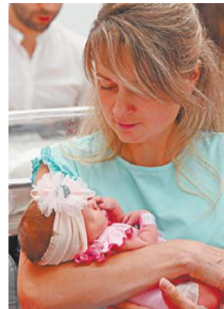
Малышка Василиса получила имя в честь советского военачальника