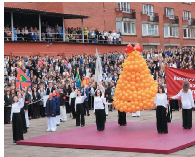
Яркий праздник на площади Лихачёва ежегодно собирает около 5000 человек

– Патриотизм – это многогранное слово, но в первую очередь это знание своего дела. В тот момент, когда нужен стране, ты можешь просто оказаться неспособным. Поэтому так важно разбираться в том, что делаешь,