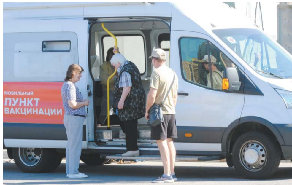
Взрослым для проведения процедуры достаточно иметь с собой паспорт и полис ОМС

Пункты преимущественно располагаются в торговых центрах и у станций метро: «Василеостровская», «Приморская», «Пр-т Просвещения», «Озерки», «Парнас», «Гражданский пр-т», «Пл. Ленина», «Академическая», «Пл. Мужества», «Ленинский пр-т», «Ново-Черкасская», «Ладожская», «Электросила», «Московская», «Пр-т Большевиков», «Ул. Дыбенко», «Ломоносовская», «Чкаловская», «Горьковская», «Старая Деревня», «Командантский пр-т», «Чёрная речка», «Беговая», «Пионерская», «Купчино», «Международная», «Владимирская». Иммунизация детей в передвижных пунктах не производится!