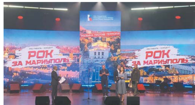
«Рок за Мариуполь» прошёл в 2023 году