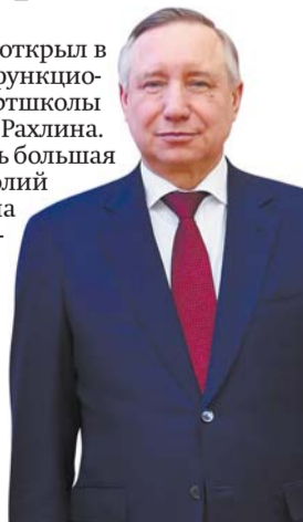
Александр Беглов