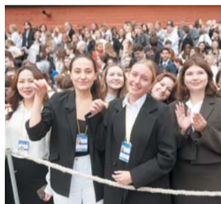
Счастливые студенты Университета профсоюзов

Санкт-Петербургский Гуманитарный университет профсоюзов в этом году снова оказался популярным местом для поступления: средний конкурс – 64 человека на место. Однако, как подчеркнул ректор Александр Запесоцкий, поступает и на яркий праздник попадает настоящая элита, поздрав-