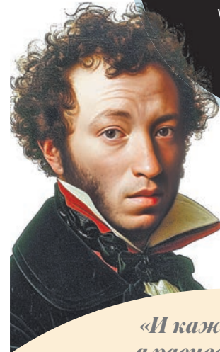
ИЛЛЮСТРАЦИЯ СОЗДАНА НЕЙРОСЕТЬЮ

«И каждой осенью я расцветаю вновь; Здоровью моему полезен русский холод».