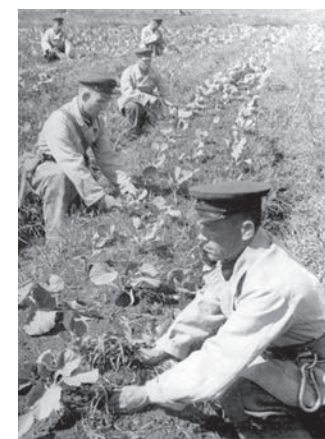
На блокадных огородах выращивали лук, свёклу, капусту. Морковь и картофель в Ленинграде росли плохо

Выставка «Приказано выжить. Огороды блокадного Ленинграда» открыта до 25 декабря.