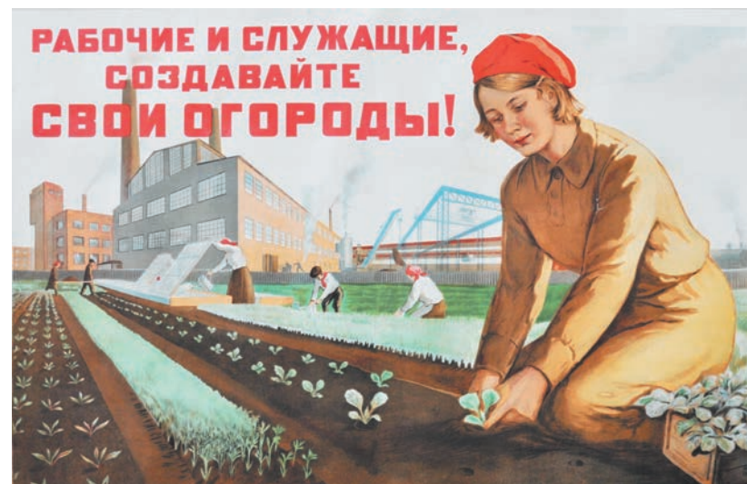
Агитационные плакаты 1942 года

ПРОЕКТ РЕАЛИЗОВАН НА СРЕДСТВА ГРАНТА САНКТ-ПЕТЕРБУРГА