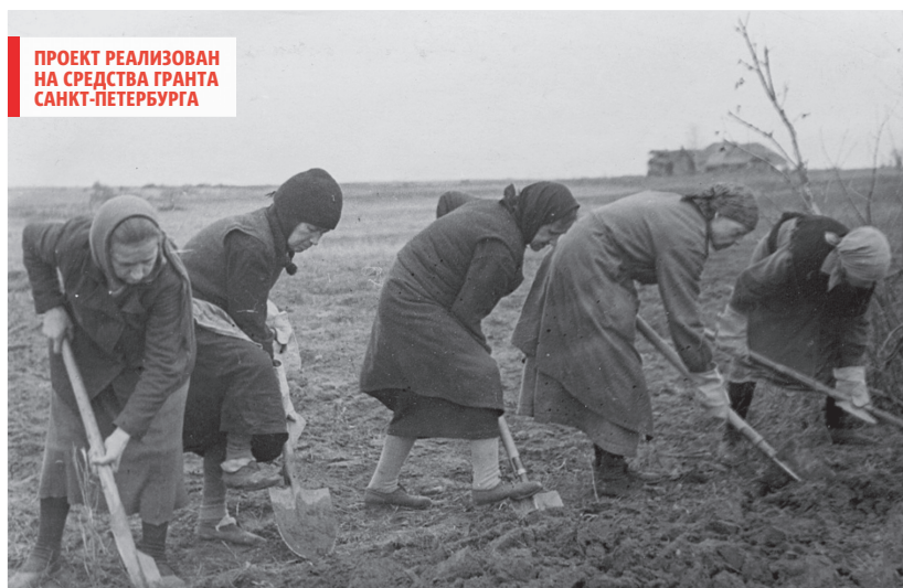
Ленинградцы, выжившие после первой голодной зимы, берутся за выращивание овощей

– Весной 1942 года разворачивается мощнейшая агитационно-разъяснительная кампания. Людям пытались объяснить, что по Ладож-