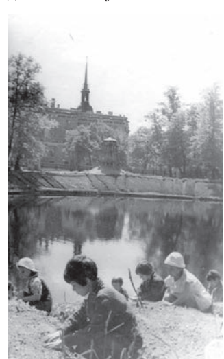
Жителям блокадного города выдавали земельные участки для обустройства огородов

Зелёный и репчатый лук, свёклу, редис выращивали жители блокадного Ленинграда. Однако королевой грядок была капуста.