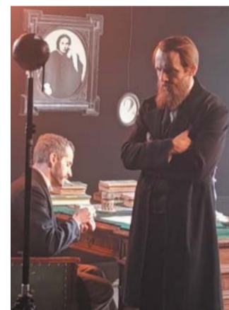
С костюмами для съёмок помогла киностудия «Ленфильм»

просто при обработке стираем. Современные технологии позволяют убрать всё лишнее – людей, аппаратуру. Остаётся только то, что должно быть – персонажи и место действия.