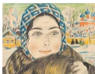
Б.М. Кустодиев. Молодая купчиха в клетчатом платочке, 1919

о выставке «Линия. Штрих. Пятно. Рисунок XX века из собрания Русского музея» (6+) в Государственном Русском музее (до 8 декабря)