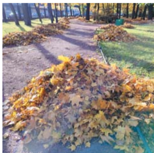
Опавшие листья – удобрение для деревьев, но в условиях мегаполиса их лучше убирать | ИГОРЬ АКИМОВ

– Осенний листопад – это защитный механизм древес-