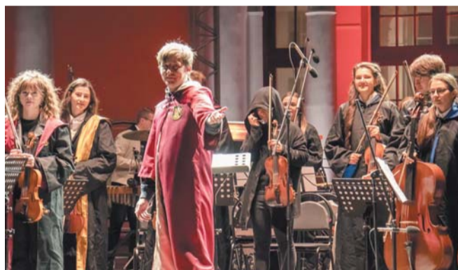
«Гарри Поттер. Симфонический саундтрек»