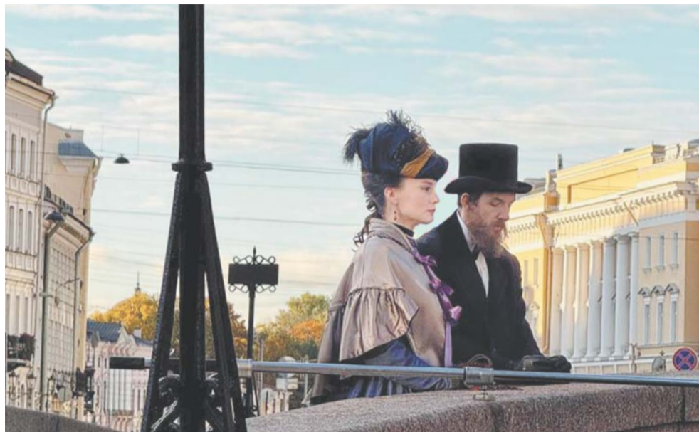
Каждая серия VR-сериала будет длиться 15–20 минут