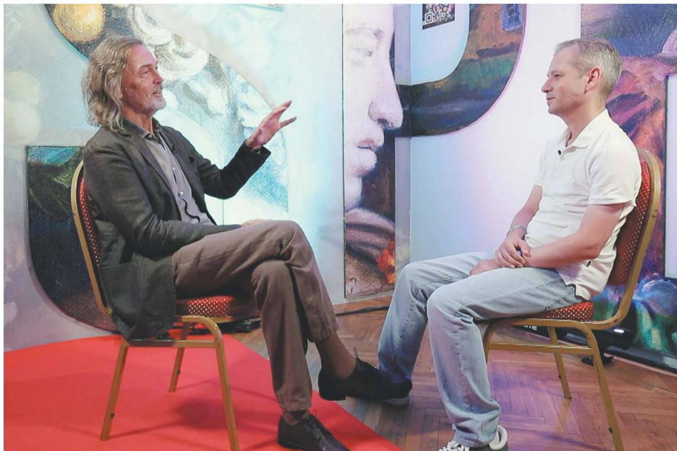
Никас Сафронов

Я жалею о 80 процентах работ, которые я написал. Я бы их уничтожил. Нам очень обидно и грустно, что Гоголь уничтожил второй том. Но, с другой стороны, если бы эта книга осталась, то сколько бы критики было... Достаточно одной вещи: Eagles, «Отель Калифорния». Поэтому иногда произведение искусства должно быть в одном экземпляре, в двух, но не обязательно во многих. Я работал в наиве, будучи зрелым художником, пытался вернуться к наиву, как это