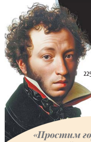
ИЛЛЮСТРАЦИЯ СОЗДАНА НЕЙРОСЕТЬЮ

«Простим горячке юных лет И юный жар, и юный бред».