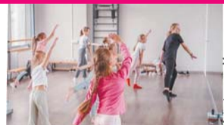
Mainstream - Mainstream

Важно также учитывать инфраструктуру образовательного центра. Центр Mainstream располагает более чем 300 квадратными метрами учебных помещений,