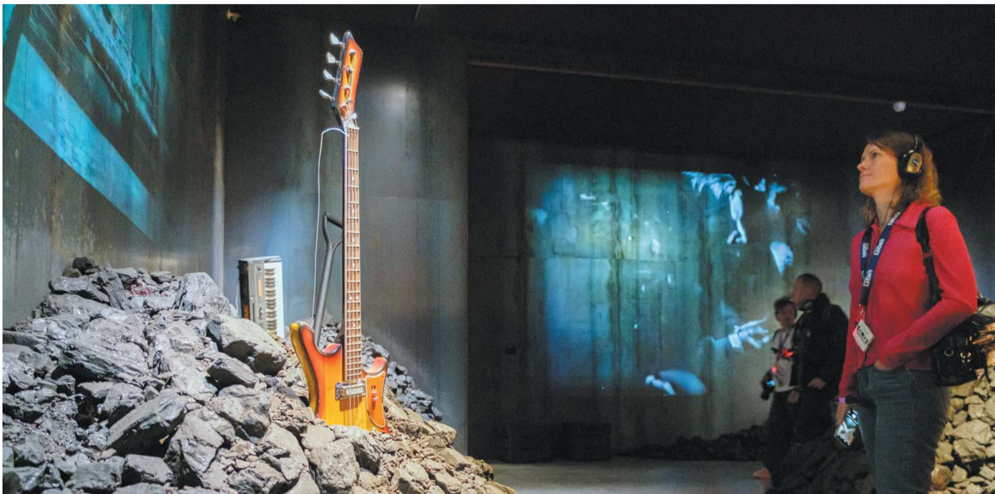
«Виктор Цой. Легенда»