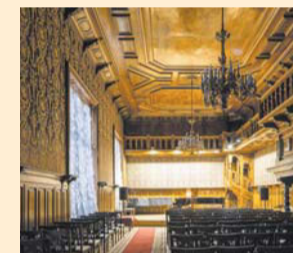
Дубовый зал Дома композиторов