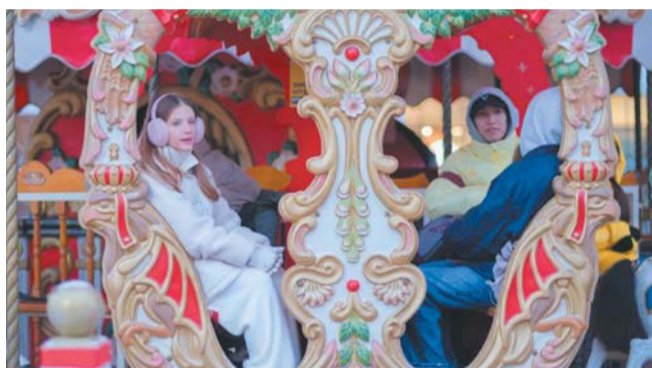
На Кленовой улице снова появится двухэтажная карусель | АЛЕНА БОБРОВИЧ