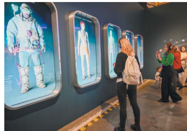
«Лёд. Жизнь»

главных вопросов о льде сформулировали организаторы. Посетители должны найти ответы на них в процессе посещения выставки