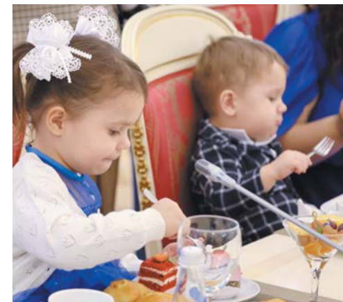
Встреча прошла в неформальной обстановке, в формате чаепития