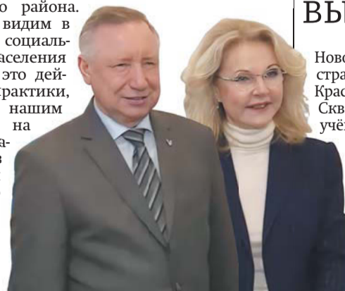
Александр Беглов и Татьяна Голикова

Губернатор Петербурга Александр Беглов и заместитель председателя правительства РФ Татьяна Голикова обсудили с пожилыми петербуржцами реализацию проекта «Серебряный возраст». Встреча прошла в центре соцобслуживания Московского района. «То, что мы сегодня видим в Комплексном центре социального обслуживания населения Московского района, это действительно лучшие практики, которые позволяют нашим гражданам, несмотря на возраст, найти себе занятия, найти себя в обществе, приобрести новых друзей и новую профессию», – сказала Татьяна Голикова.